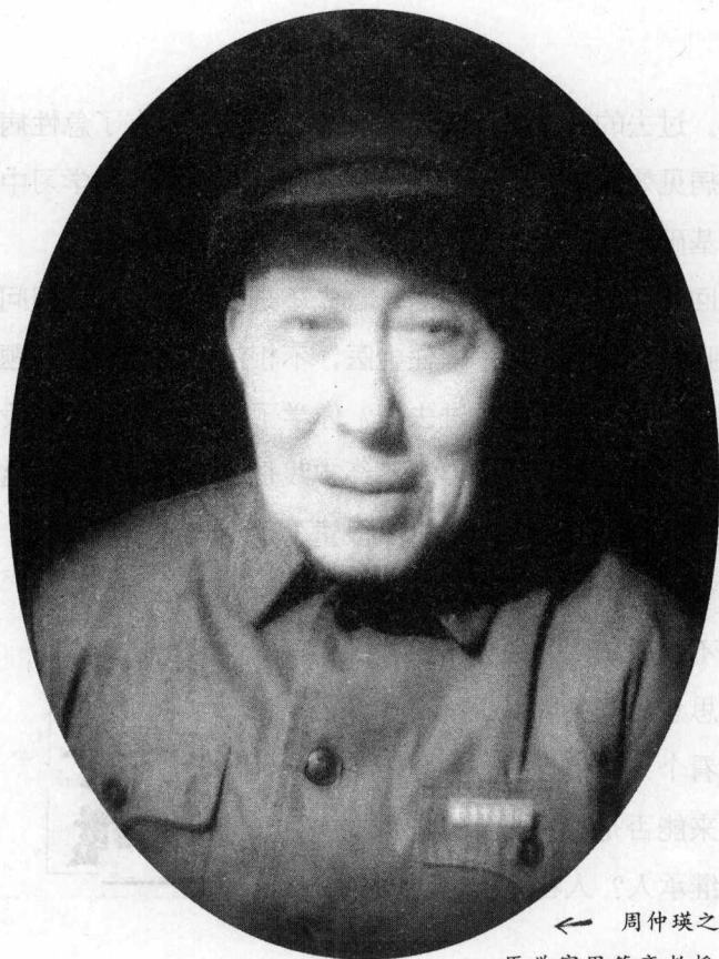
← 周仲瑛之父，著名中 医学家周筱斋教授。

祖业，庶可服务桑梓，藉为生计。乃誓志研究，常以“不经一番寒彻骨，那得梅花扑鼻香”自为勉励。从兹，日间执行药业，夜间攻读医书，每至深夜方寝。