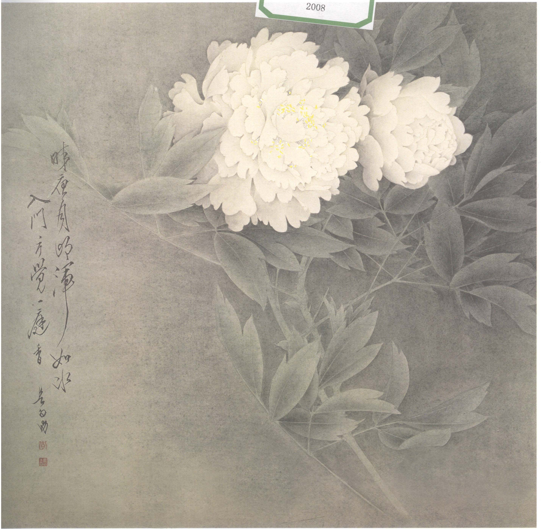
李长白 黄牡丹 66cm × 66cm