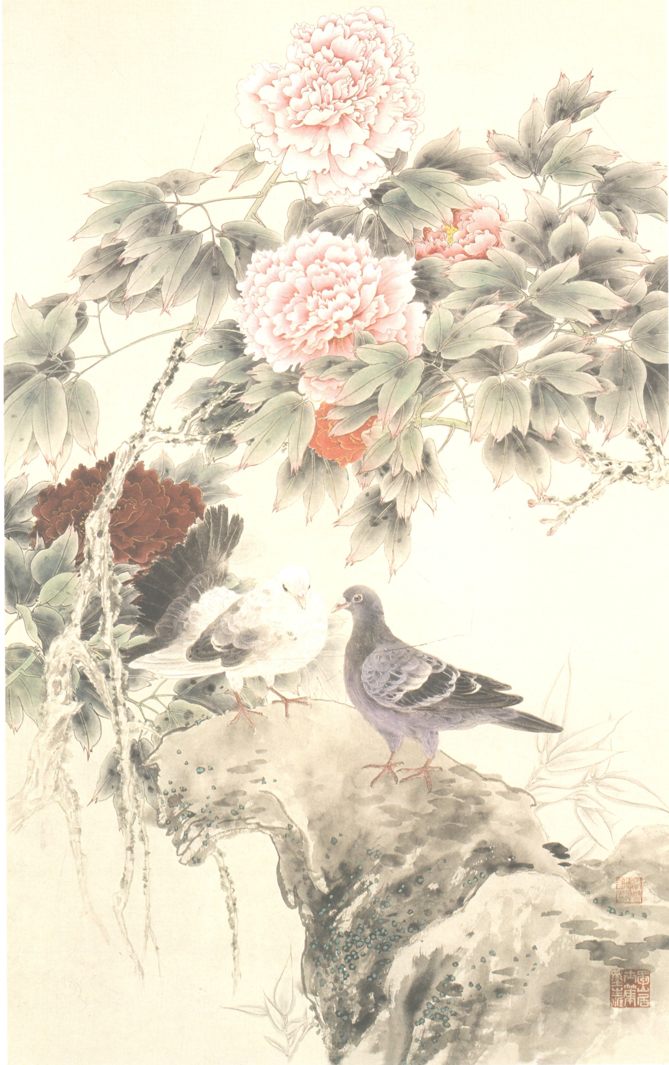
郭汝愚 牡丹双鸽 133cm x 66cm

牡丹傾國 色奪香 花甲王老 較承綠 葉新莖 茂紫叢 疏懶沐朝露 粉腮映月光 生來即富貴 深山也稱王 不常以雕琢 自茲耀明堂 應笑寒風第 蕭索待冰霜 畫到淡雅處 似若有天香 再添鳳羽禽 從得鶴上陽 丙戌春郭汝愚 并句於成都