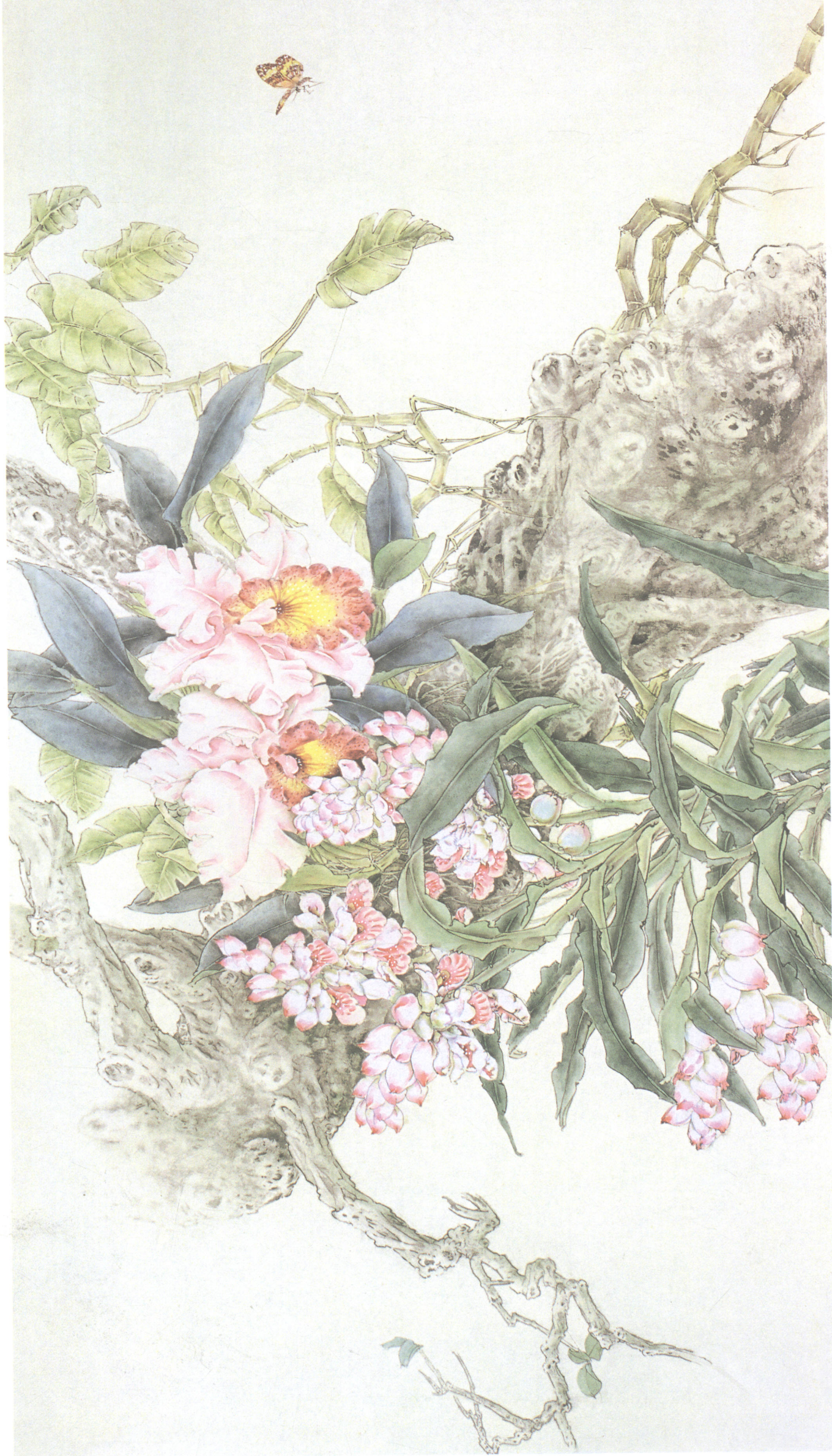
曾昭咏 雨林异卉 135cm × 65cm