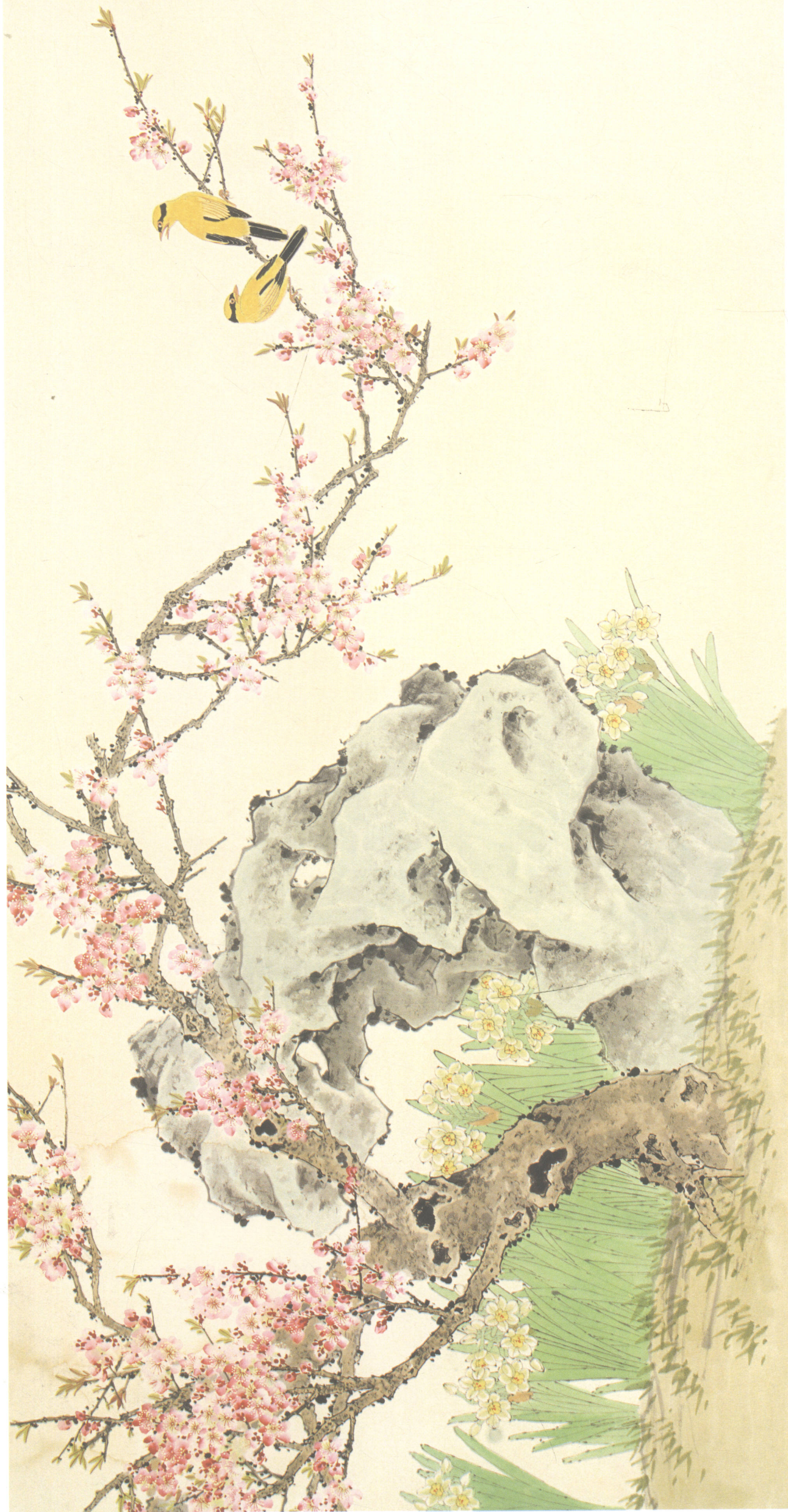
龔文祜 梅花大石图 133cm × 65cm