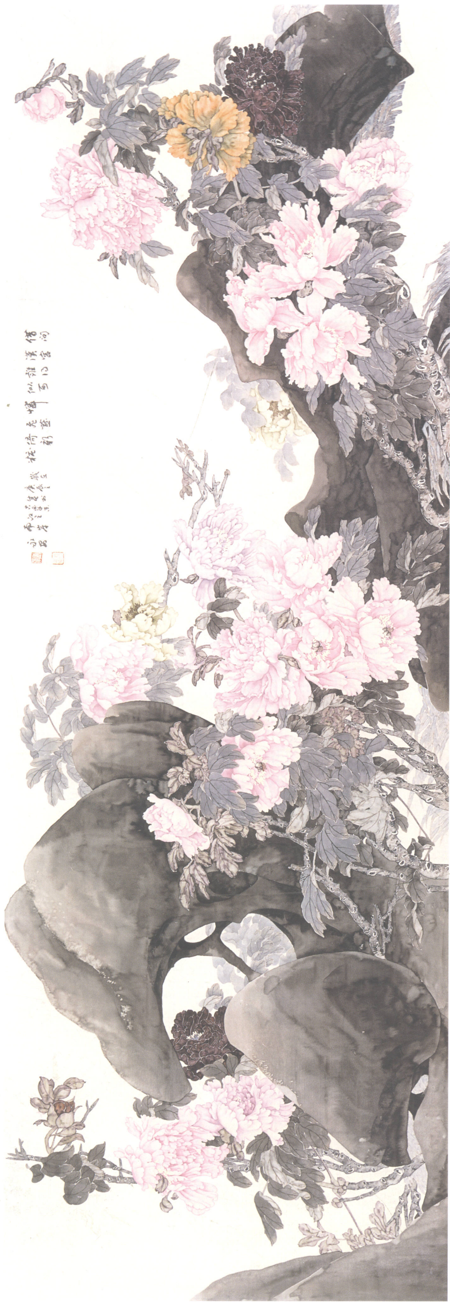
赵永安 牡丹大石图 80cm × 240cm