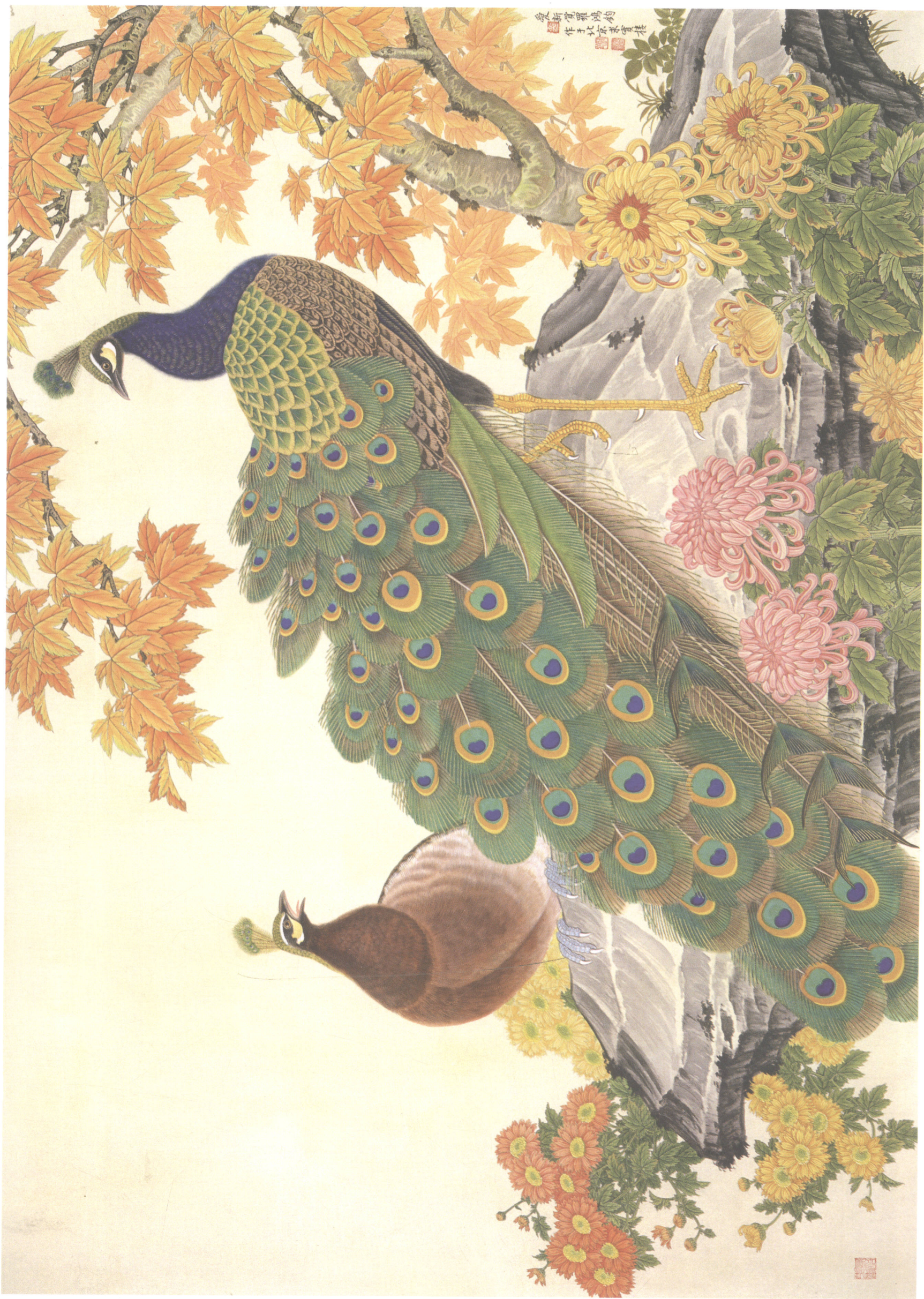
金凤钗 秋光翠羽 130cm × 90cm