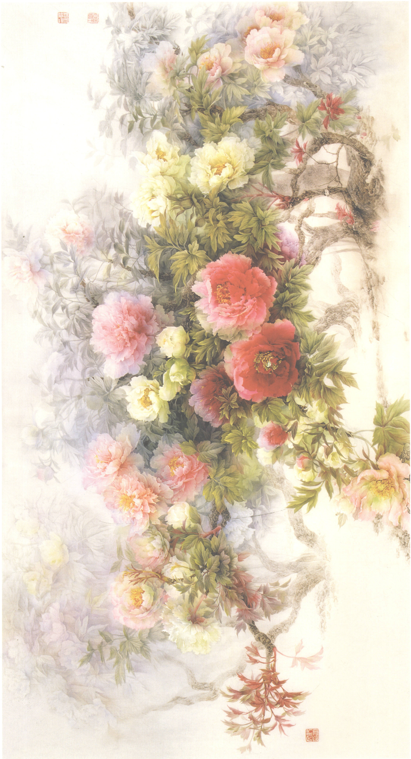
纪淑文 邱皓 邱月 春日里来百花开 133cm × 65cm