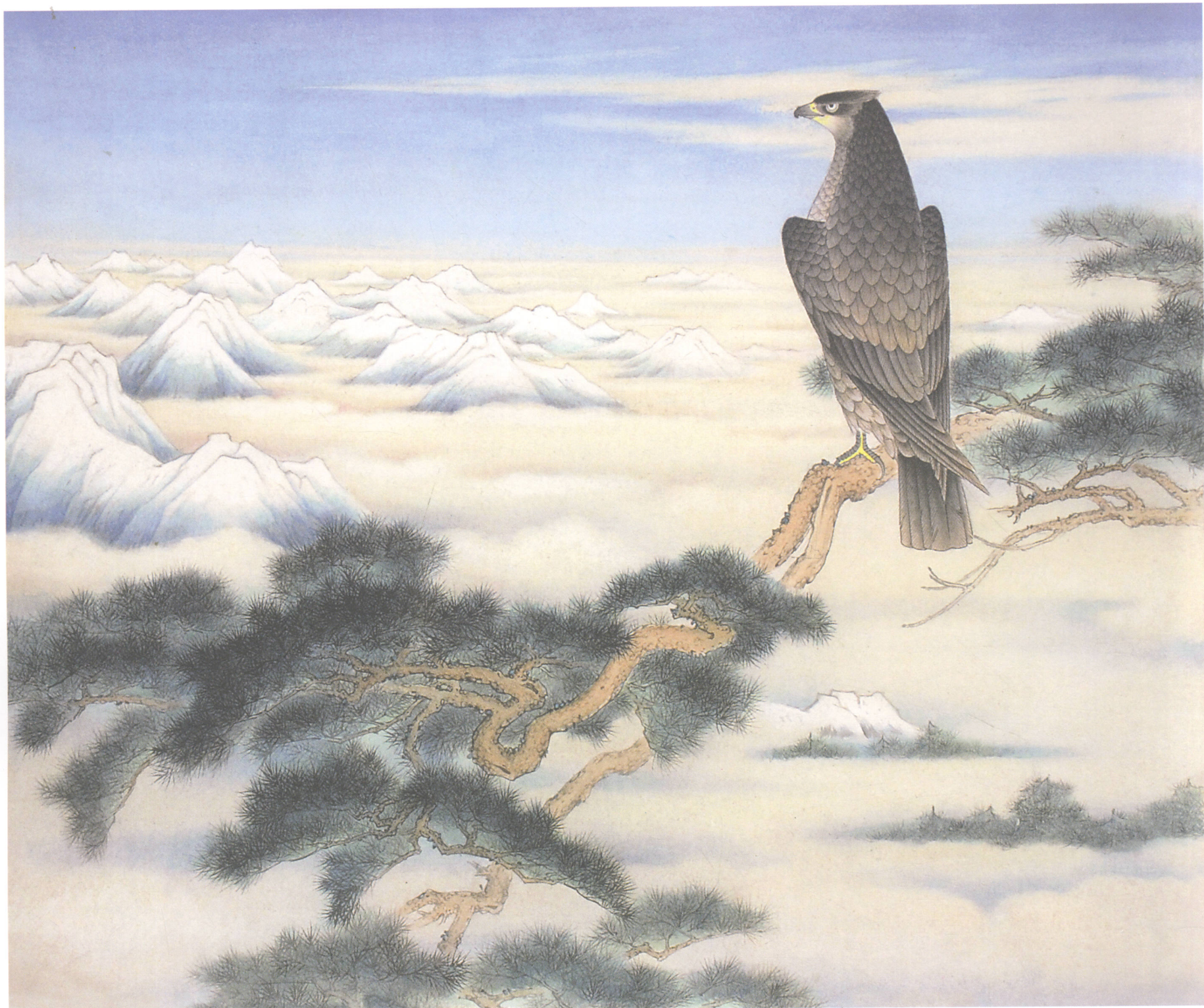
李长白 松鹰图 41cm × 49cm