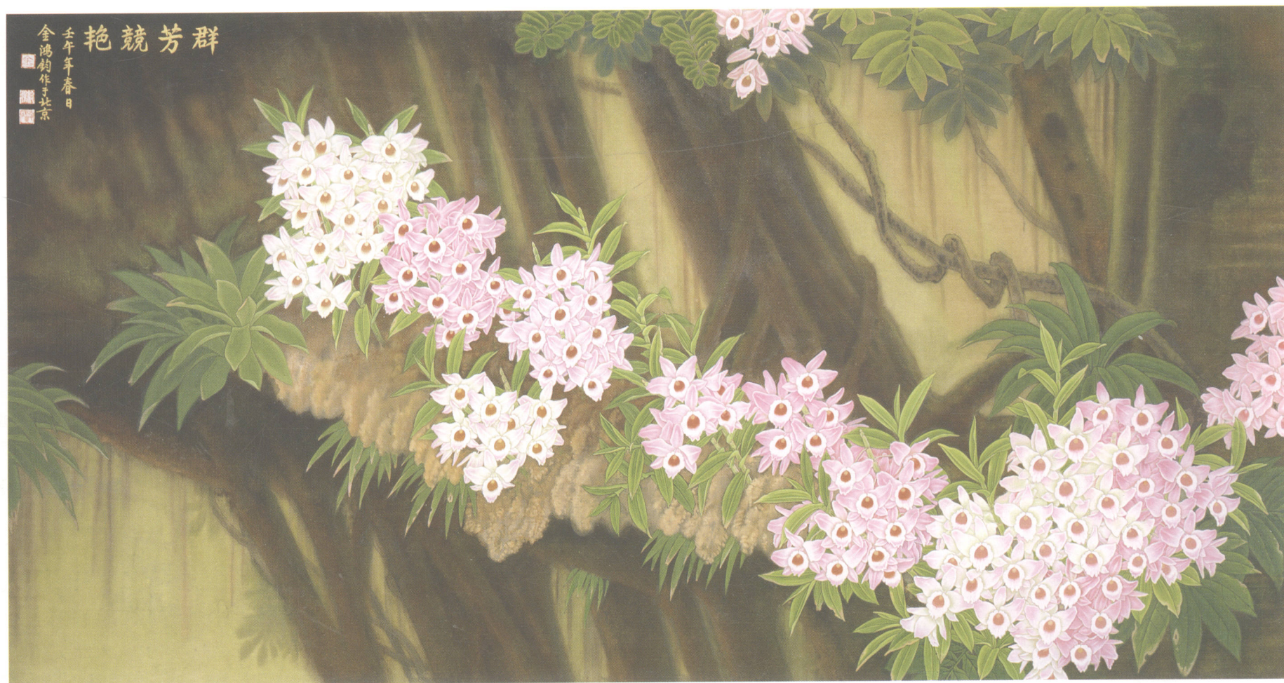
金鸿钧 群芳竞艳 90cm × 190cm