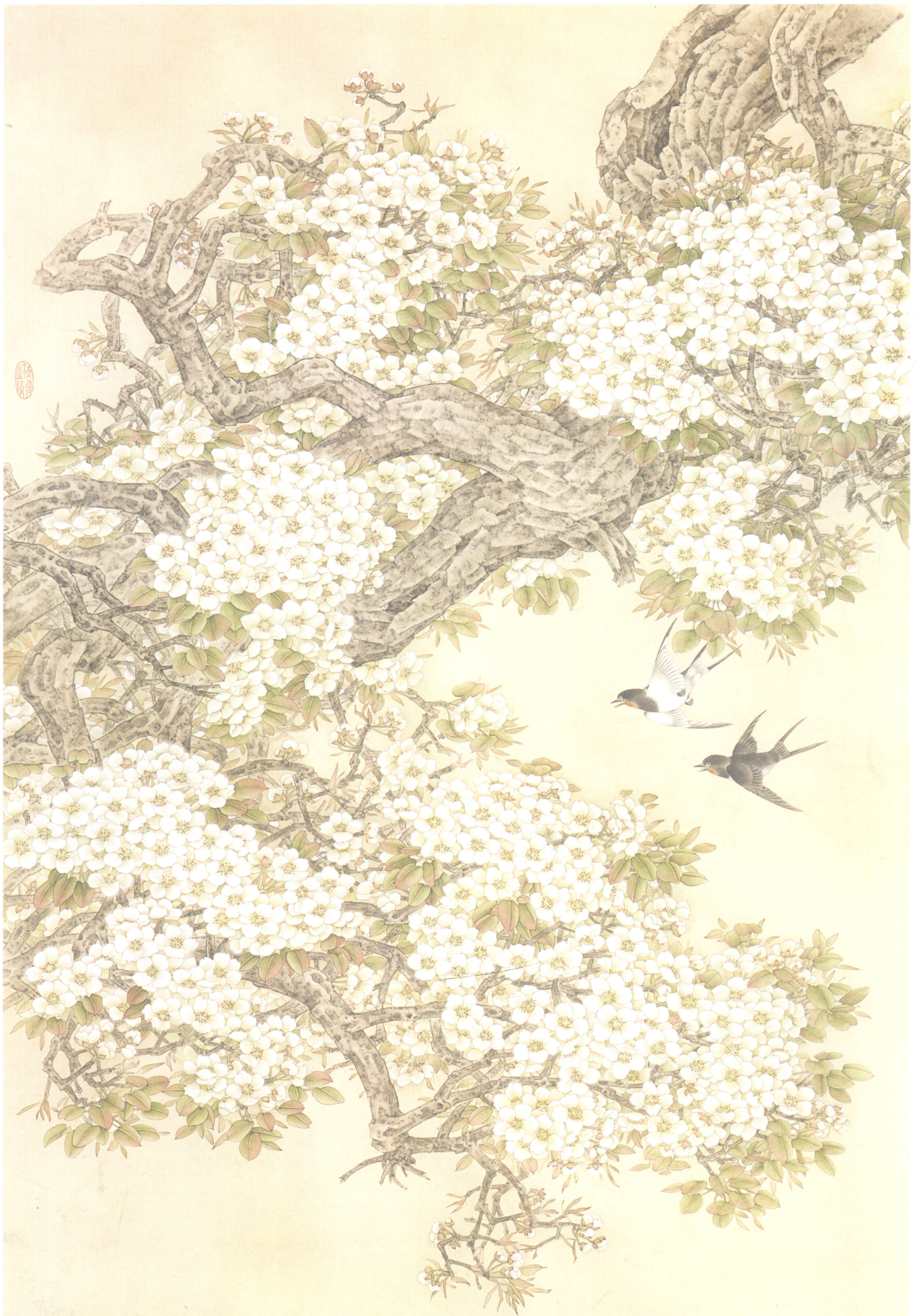
莫建成 春风 160cm × 90cm

香浮 昔風 微風細雨 清潤足枝 頭萬萬排 明珠齊開 竟發不知 數獎耀冰 雪明村墟 錄宋代蘇 轍梨花詩 步其意韵 拭寫之時 在丁亥年 孟春於蘭 州知草堂 莫建成畫 并記之