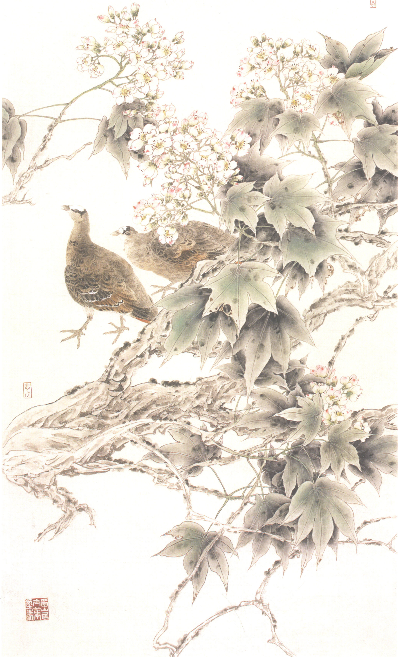
郭汝愚 桐荫幽禽 133cm x 66cm