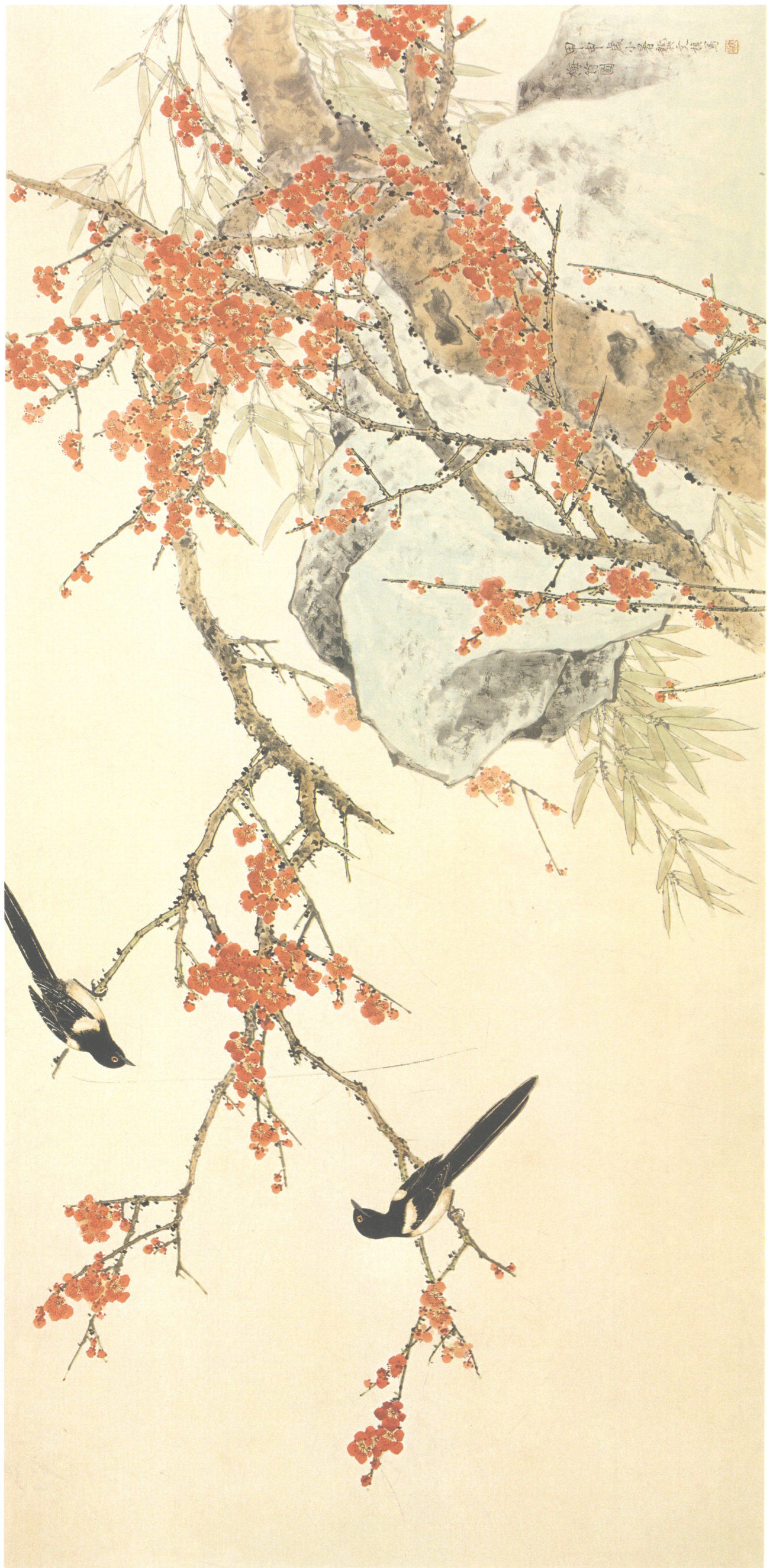
龚文祯 梅竹图 133cm × 65cm