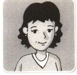
지훈이 어머니 영석이 아버지의 여동생, 영석이의 고모 治勋妈妈 永锡爸爸的妹妹, 永锡的姑姑