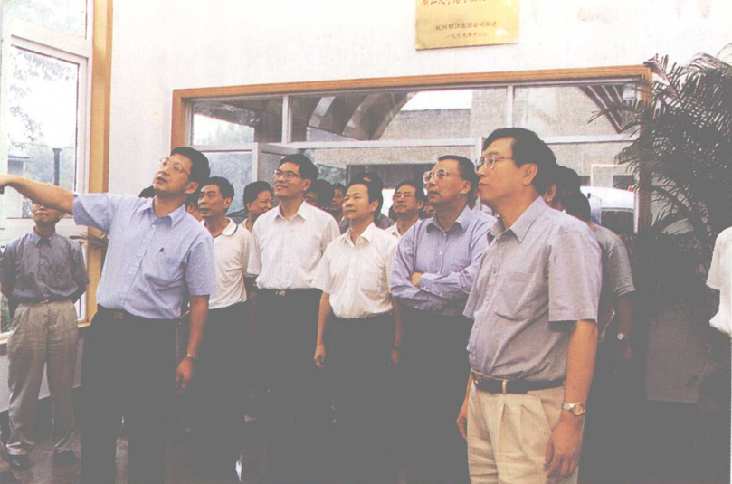
◀ 9月27日，中共浙江省委书记张德江来我校考察调研。