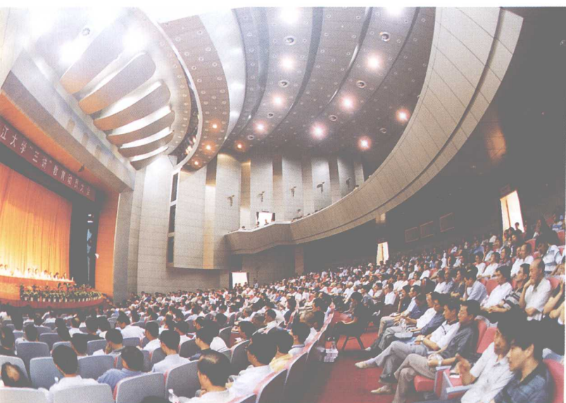
◀ 9月12日，浙江大学“三讲”教育动员大会在永谦学生活动中心召开。