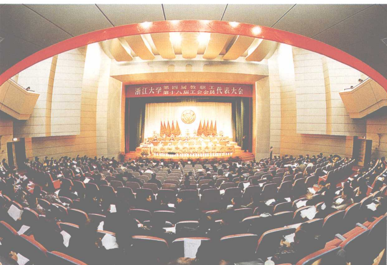
◀ 12月21—23日，新的浙江大学成立以来的第一次“双代会”——第四届教职工代表大会、第十八届工会会员代表大会在玉泉校区召开。