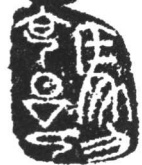
著名刑法学家、全国刑法学研究会名誉会长马克昌题词