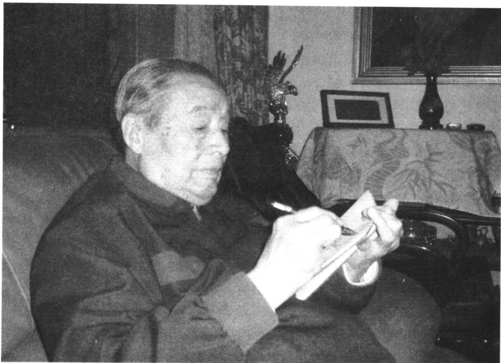
中国环境法学的开拓者和奠基人韩德培

规定》的文章，揭露了中美商约在移民问题上对中国的平等规定，并建议中方应要求美国就中国移民问题取消或修改不合理的限制，加强对在美华侨利益的保护。1948年又在《国立武汉大学学报（社会科学季刊）》第9卷第1号上发表论文《国际私法上的反致问题》，至今仍然是我国国际私法学界关于这个问题最权威的论述。