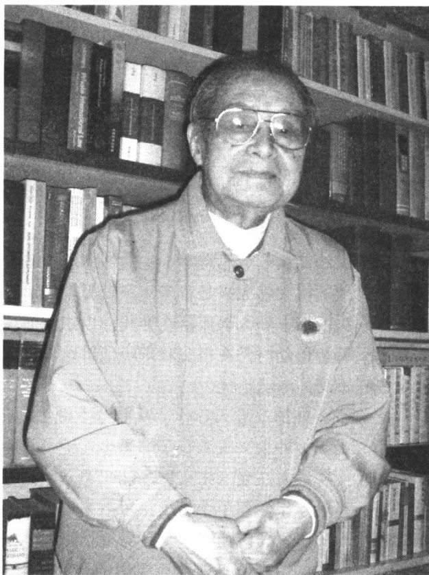
中国环境法学的开拓者和奠基人韩德培