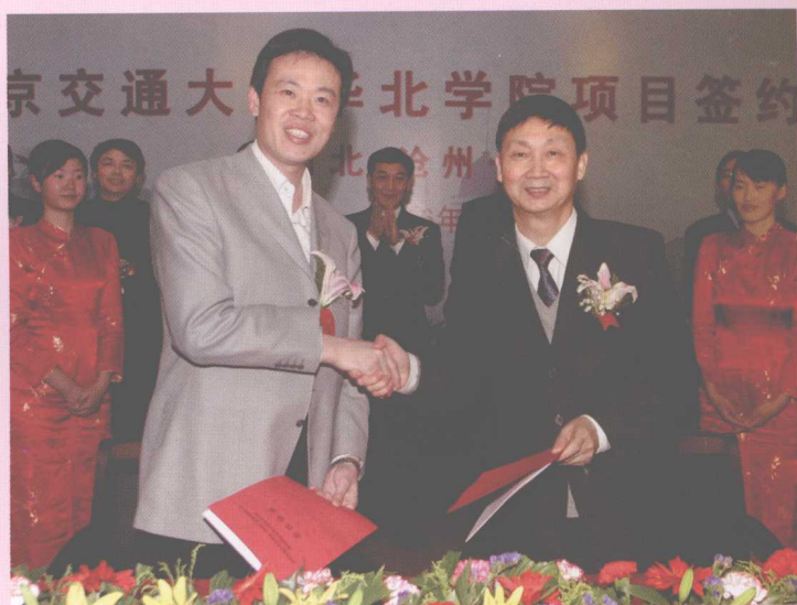
4月6日,北京交通大学——“北京交通大学海滨学院”签约仪式举行