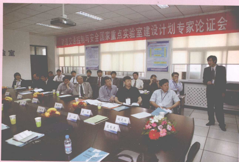
5月，轨道交通控制与 安全国家重点实验室 通过建设计划论证并 获准建设