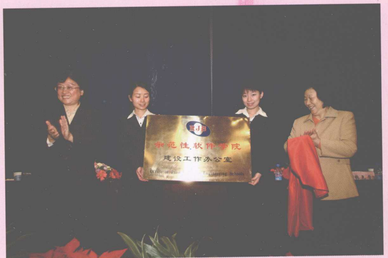
11月28日，教育部副部长吴启迪（左一）为设在我校的国家示范性软件学院建设工作办公室揭牌并视察学校