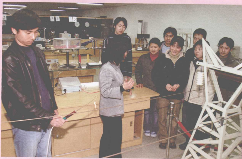
4月，物理实验中心 被评为首批国家级 实验教学示范中心