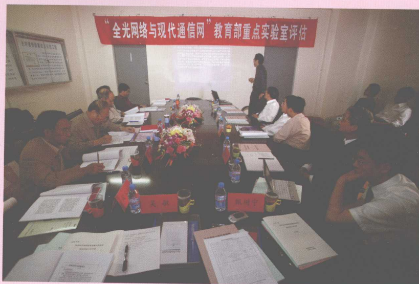
9月，“全光网络与 现代通信网”教育部 重点实验室以优秀 成绩通过教育部 评估