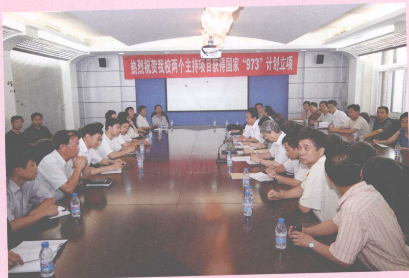
8月10日，学校召开会议，通报两项主持项目“大城市交通拥堵瓶颈的基础科学问题研究”和“一体化可信网络与普适服务体系下基础理论研究”获国家“973”计划立项，并研究部署相关工作