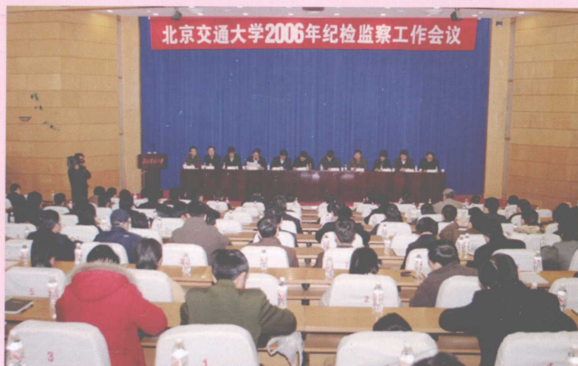
3月13日,学校党委召开2006年纪检监察工作会议