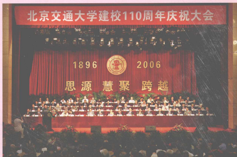
9月9日，北京交通大学 建校110周年庆祝大会 隆重召开