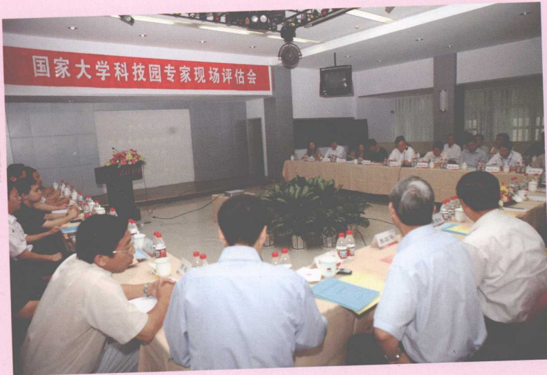
10月，北京交通大学科技园被认定为国家大学科技园