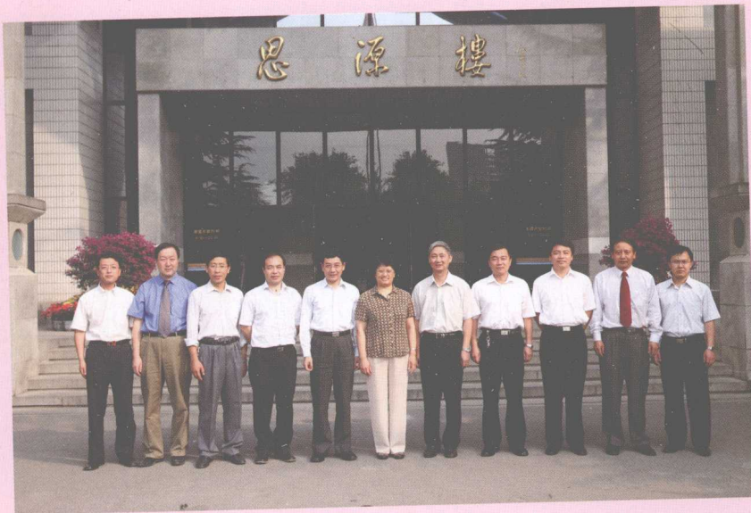
9月19日，教育部副部长李卫红(中)一行来校视察