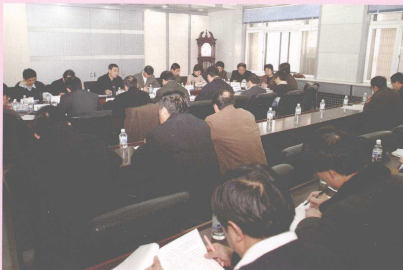
2月24日,中共北京交通大学第九届委员会召开第三次全体(扩大)会议,审议通过《关于提升自主创新能力 加快研究型大学建设的决议》