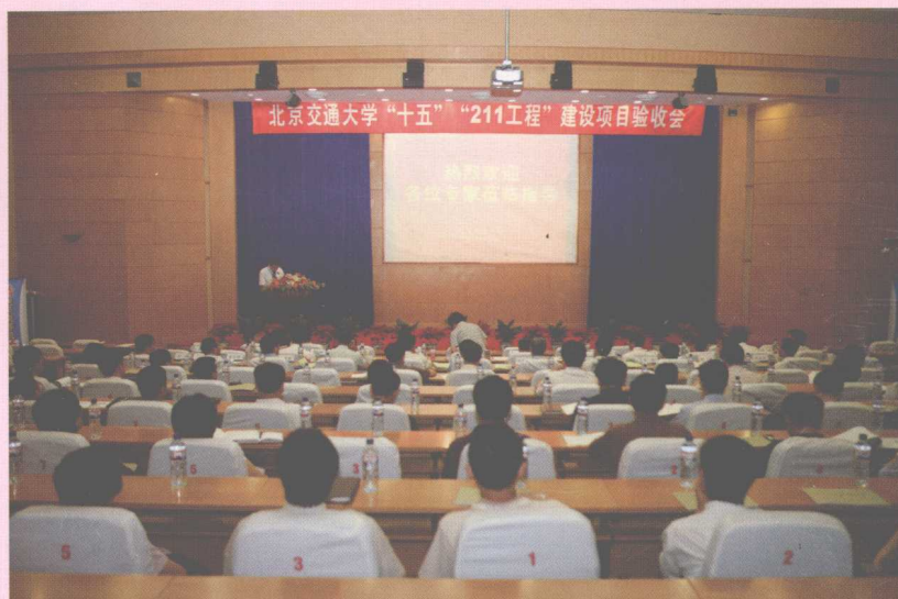
6月23—24日，学校 顺利通过国家“十五” “211工程”验收