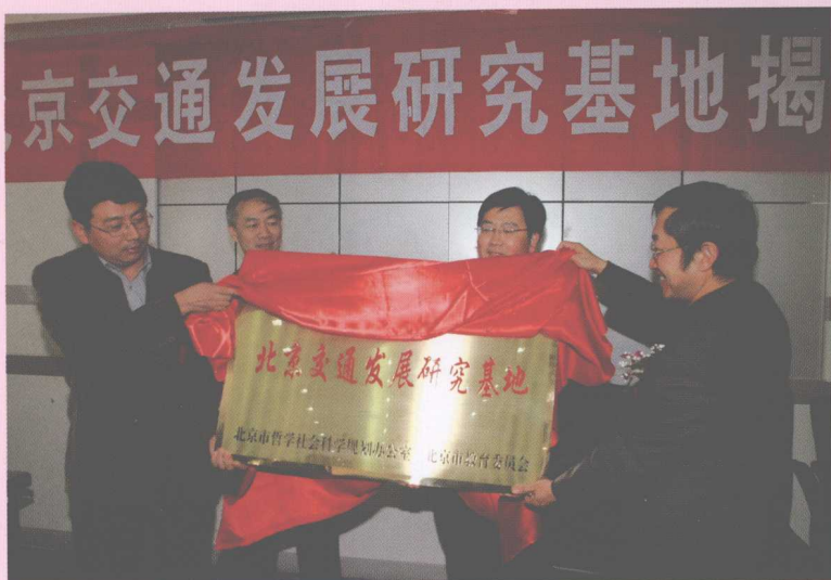
4月8日,北京市哲学社会科学北京交通发展研究基地揭牌仪式在学校举行