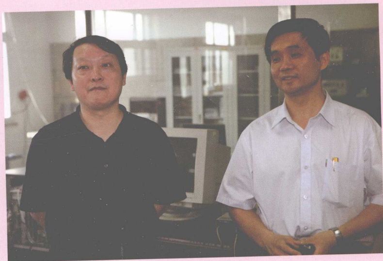
6月15日，建设部副部长黄卫(左)一行来校调研