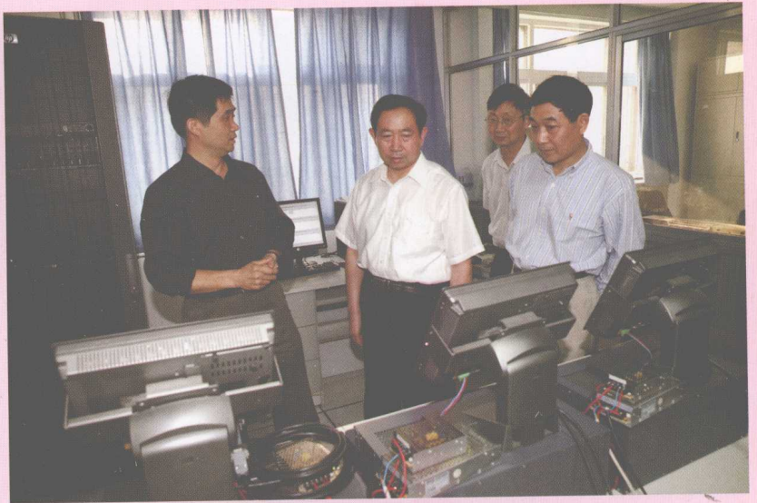
5月31日，教育部党组副书记、副部长袁贵仁（左二）一行来校视察