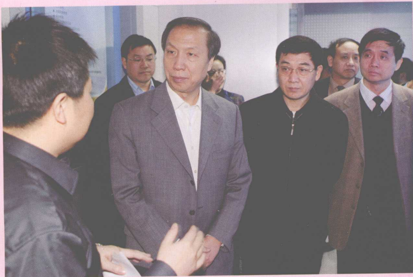
3月22日，教育部副部长赵沁平（左三）一行来校视察