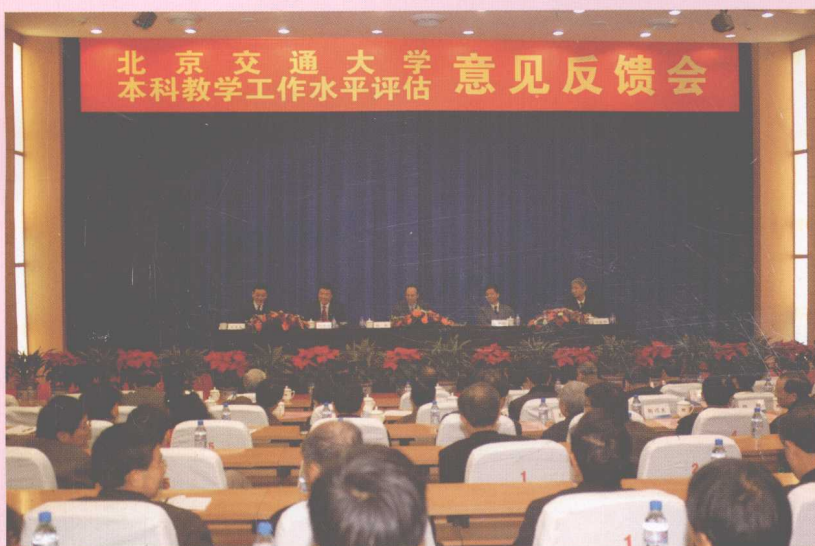
11月13—17日，学校 顺利通过教育部本科 教学工作水平评估