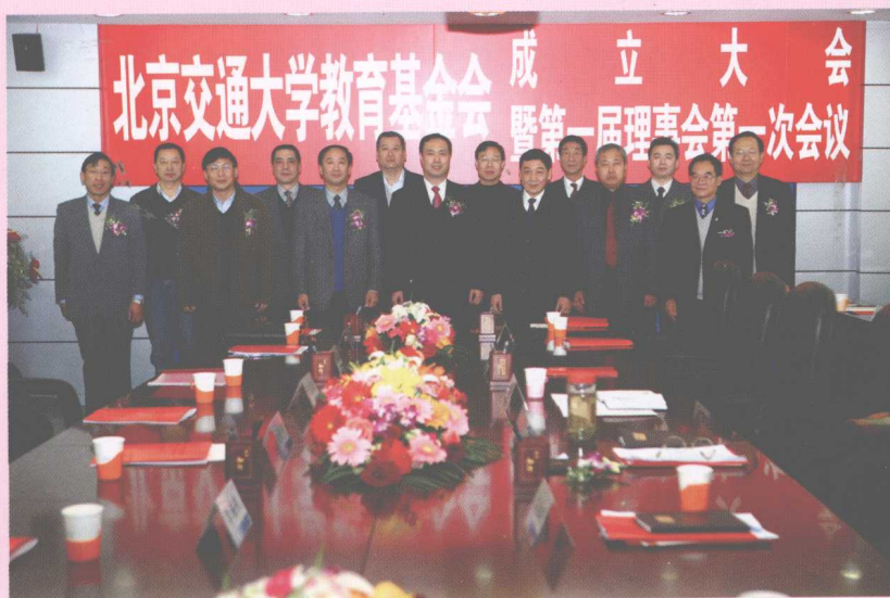
12月8日,北京交通大学教育基金会成立大会召开