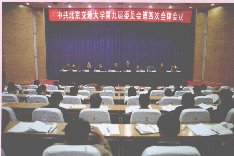
11月8日,中共北京交通大学第九届委员会召开第四次全体(扩大)会议,审议通过《北京交通大学“十一五”事业发展规划》等7个规划