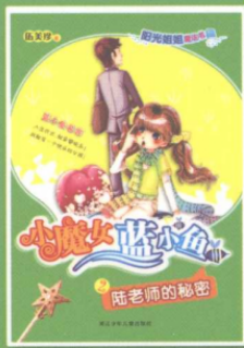
小魔女蓝小鱼 ② 陆老师的秘密