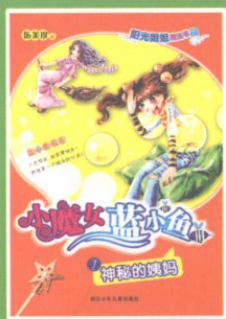
小魔女蓝小鱼 ① 神秘的姨妈