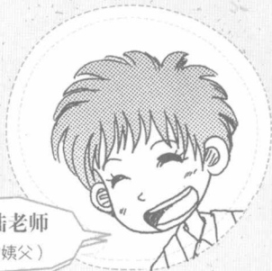
年轻的陆老师 (蓝小鱼未来的姨父)