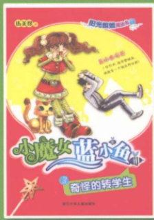
小魔女蓝小鱼 ③ 奇怪的转学生