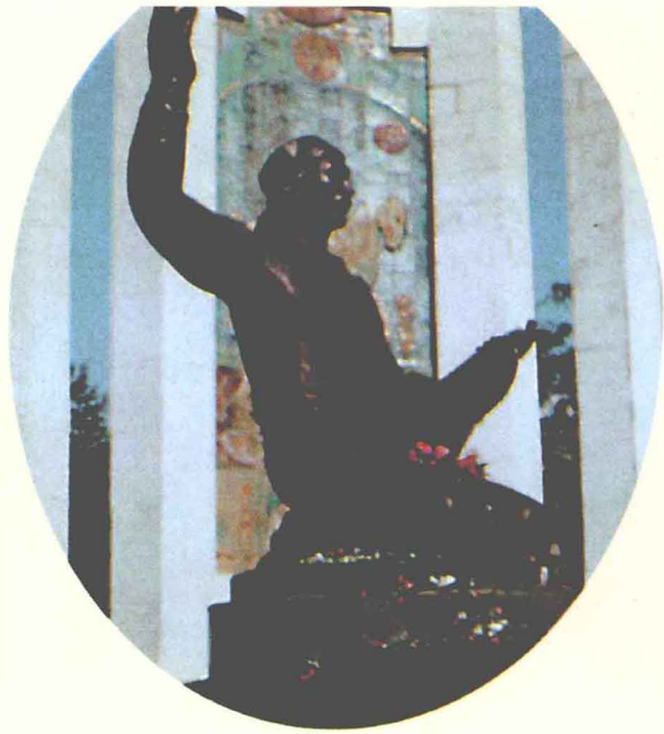
1990年8月在厄利斯塔修建的著名江格尔奇鄂利扬·奥夫拉纪念碑（1990年 摄）