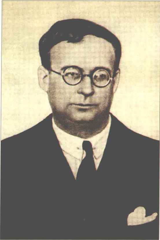
苏联著名蒙古学家鲍·雅·符拉基米尔佐夫院士（1931年 摄）