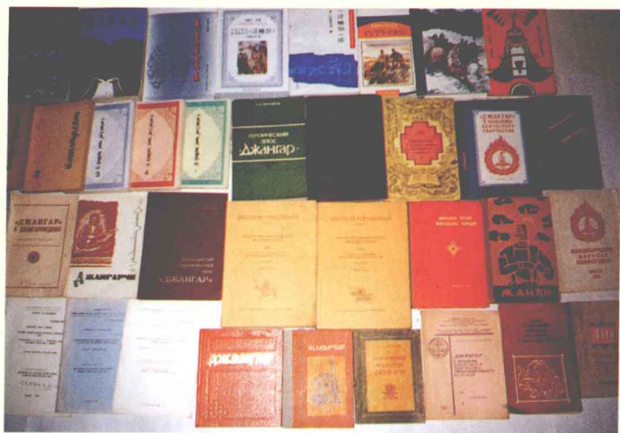
国内外出版的《江格尔》文本