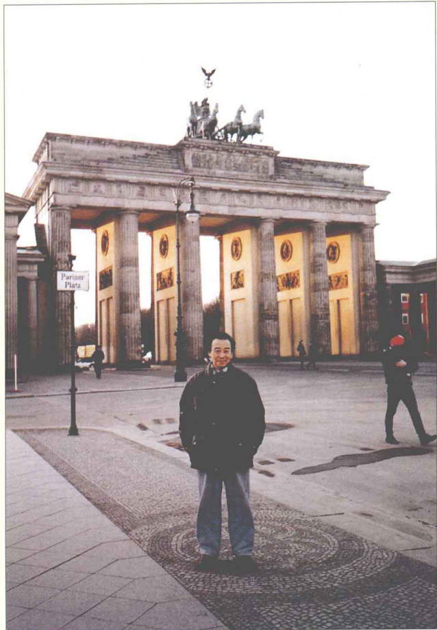
作者在德国布兰登堡（1997年 摄）