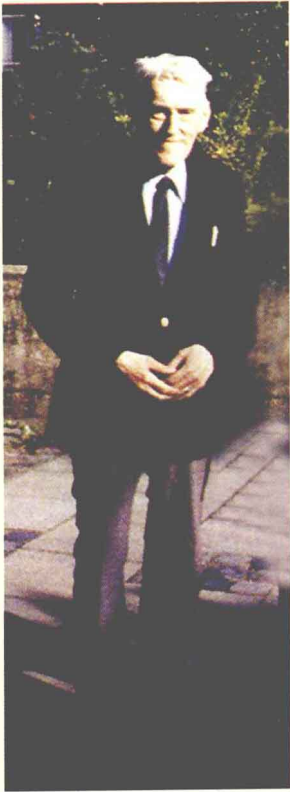
著名蒙古学家尼·波佩 （1983年 摄）