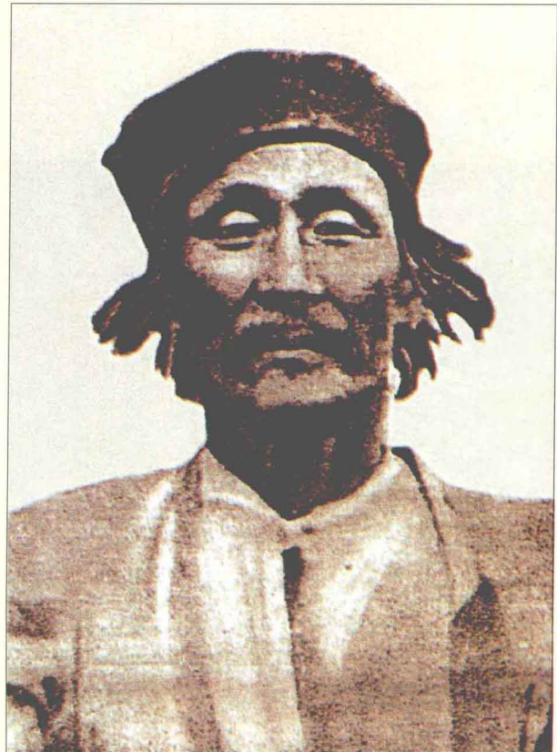
卡尔梅克江格尔奇鄂利扬·奥夫拉（1857~1920年）（1910年）