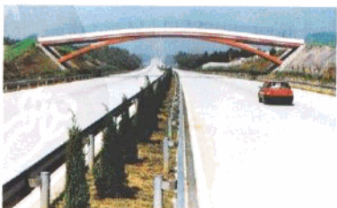
多姿多彩的跨线桥