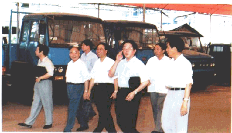
长沙市委副书记钟兴祥(右三)、市人大常委会副主任李振高(右五)、市政协副主席李显模(右四)在长沙一汽汽车有限公司进行改制调研。