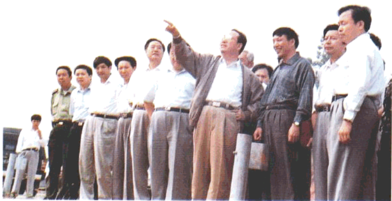
中共湖南省委书记、省人大常委会主任杨正午（右四）视察长潭高速公路。