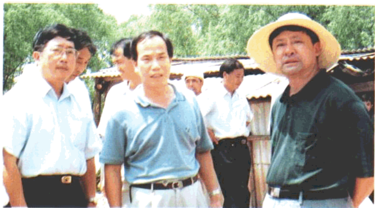
中共湖南省委副书记、省长储波（右一）视察长沙国道绕城高速公路建设工地。