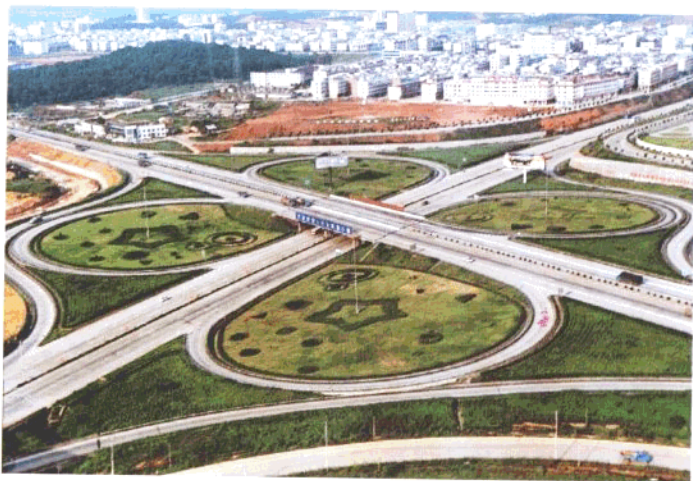
319、107国道交汇处牛角冲互通