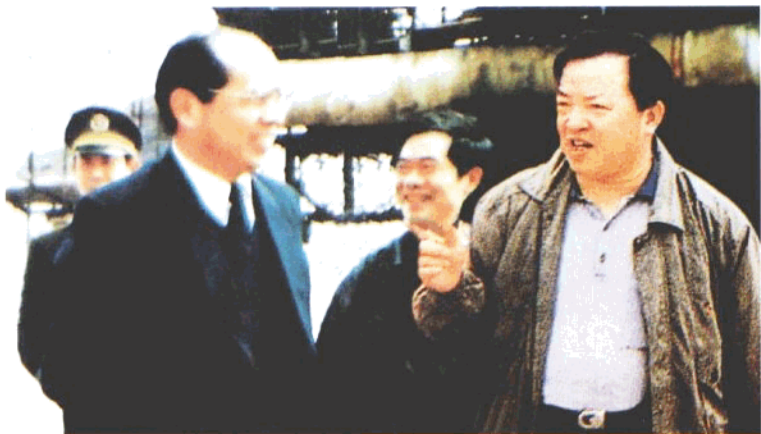
交通部部长黄镇东（左一）视察长沙等地公路建设。