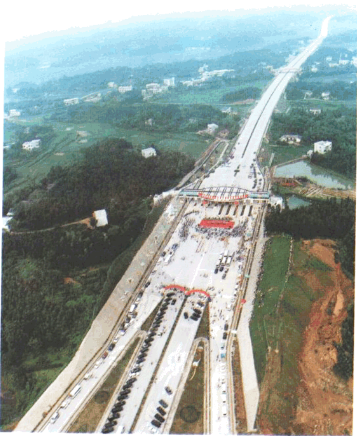
长沙至益阳段通车典礼长沙会场盛况