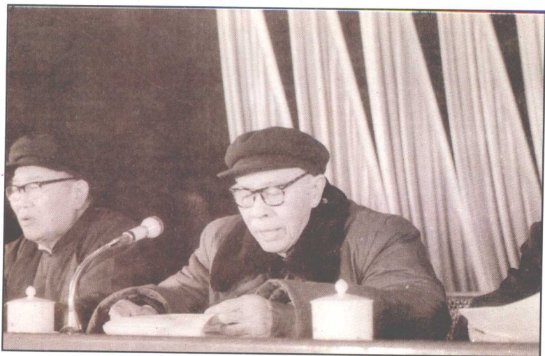
△ 1979年4月30日省政协四届二次会议改选主席，选举时任中共湖南省委书记的周里为省政协主席。图为周里在省政协四届五次会议开幕式上主持大会。左为穰明德副主席。