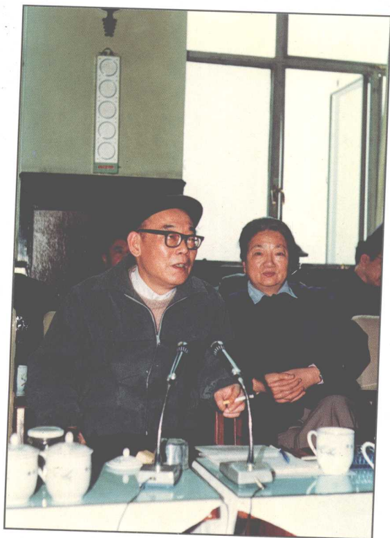
◁ 1988年1月，省政协六届一次会议选举时任中共湖南省委副总书记的刘正为省政协主席，图为刘正在六届一次会议主席团会议上讲话。右为尹长民副主席。