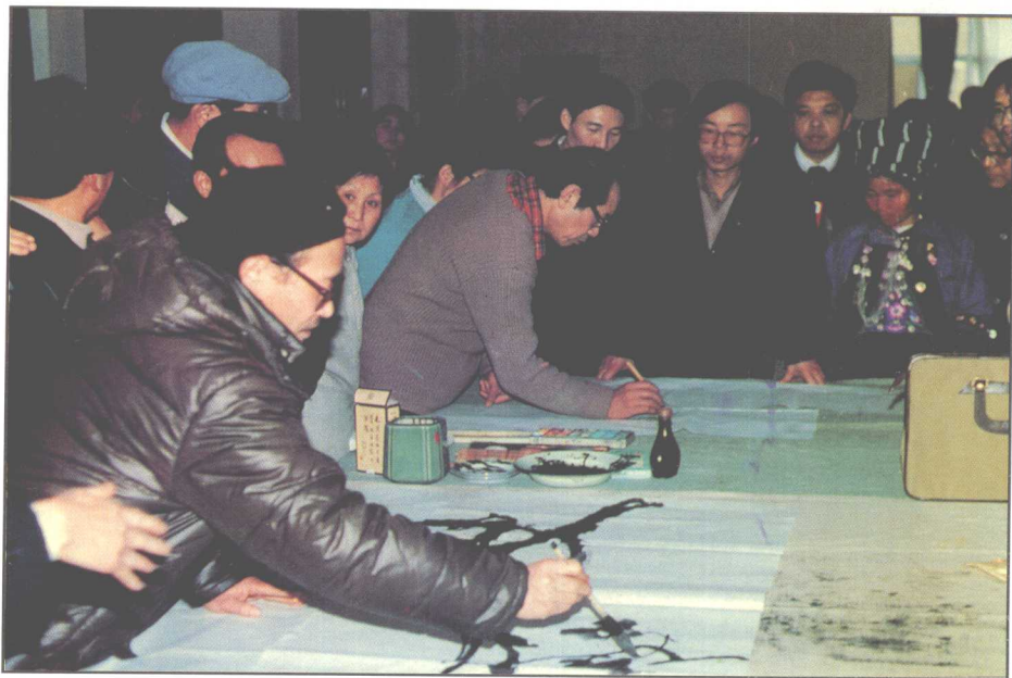
△ 1988年1月29日出席省政协六届一次全会的政协委员中的画家在第一个委员活动日作画。