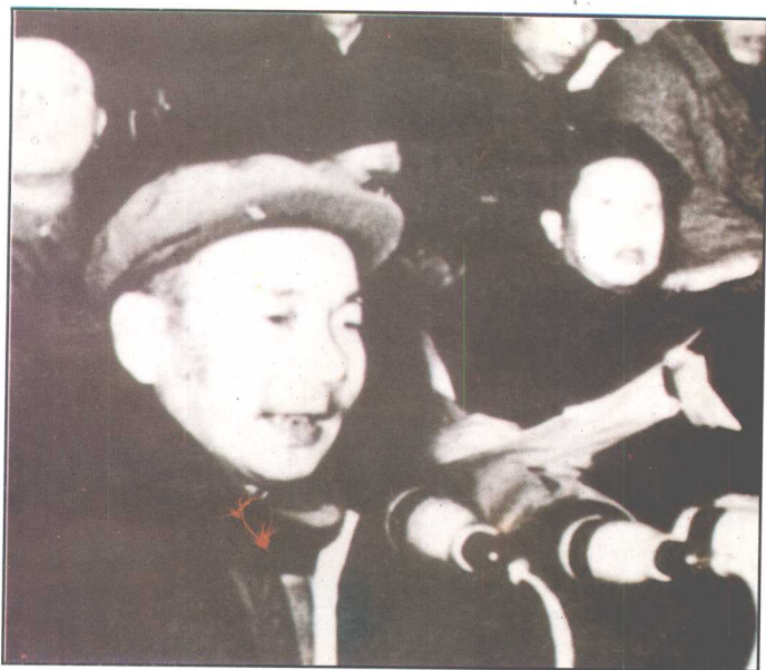
◁ 1959年12月省政协二届一次会议和1964年9月省政协三届一次会议,选举时任中共湖南省委第一书记的张平化。图为张平化在省政协二届一次会议讲话。