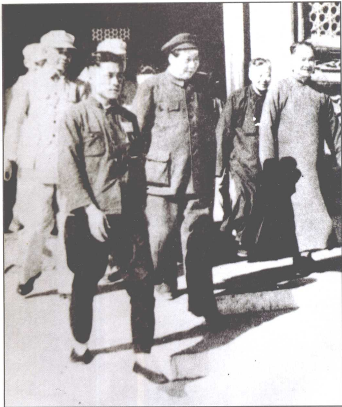
◁ 1949年9月，毛泽东主席邀请程潜(右一)、陈明仁(前左一)先生到北平(北京)作客。