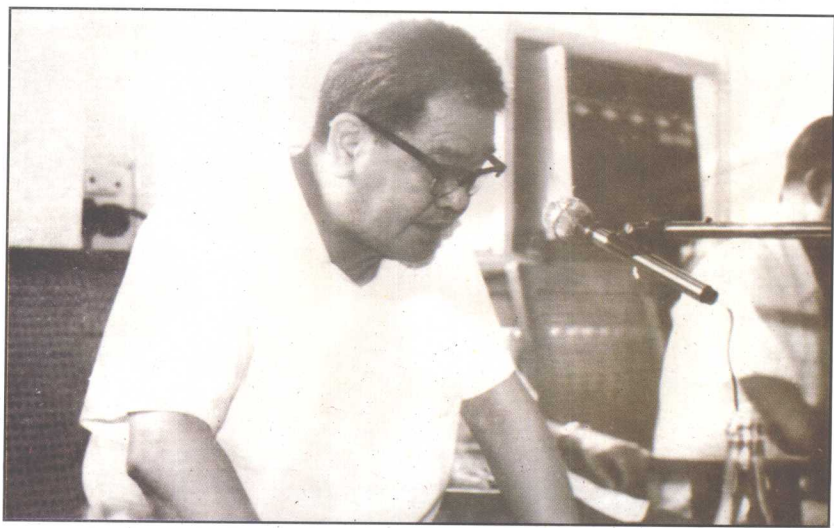
△ 1977年11月省政协四届一次会议,选举时任中共湖南省委第一书记的毛致用为省政协主席。图为毛致用在预备会上讲话。