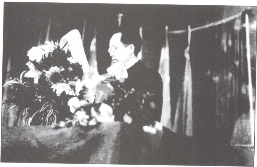
△ 图为黄克诚副主席（时任湖南省委书记、省军区司令员兼政委）在湖南省首届第一次各界人民代表会议上讲话。