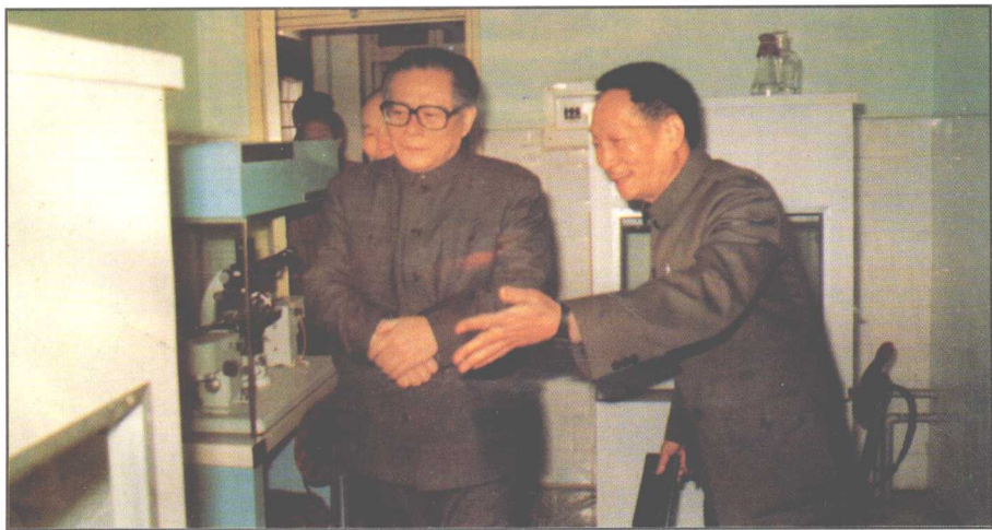
▽ 1991年3月16日，江泽民总书记视察湖南杂交水稻研究中心，图为省政协副主席、“杂交水稻之父”袁隆平向江泽民总书记汇报工作。