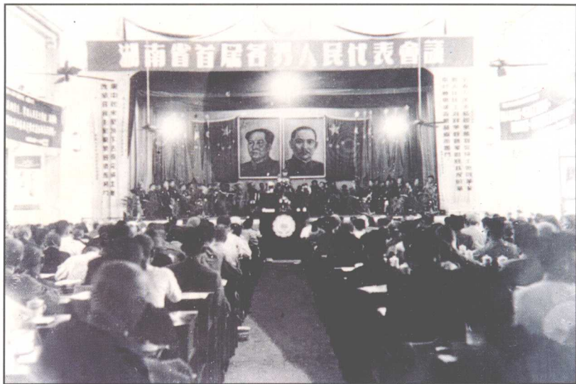
△ 1950年10月15日，湖南省首届各界人民代表会议在长沙召开。图为大会会场。