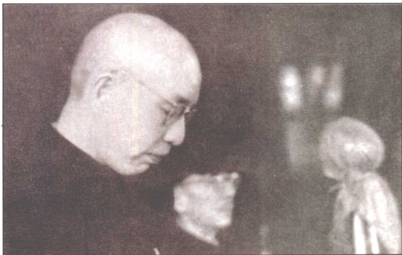
△ 1955年2月21日省政协一届一次会议，选举时任中共湖南省委书记的周小舟为省政协主席。图为周小舟在省政协一届一次会议上作政治报告。