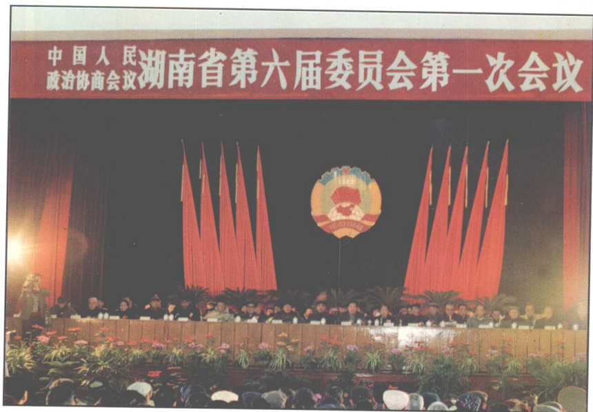
△ 省政协第六届委员会第一次会议会场。