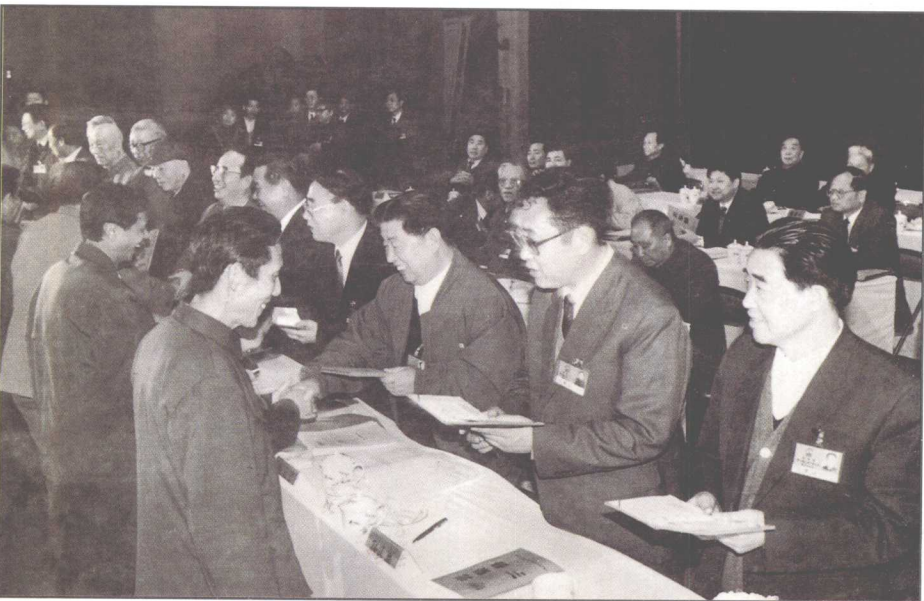
△ 1992年4月25日省党政领导人在省政协六届五次会议期间的全省政协工作表彰会上，向政协工作先进集体、个人颁奖。