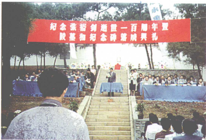
张裕钊逝世100周年 纪念会暨陵园落成典礼