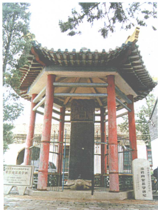
河北南宫市《南宫县学记》碑亭