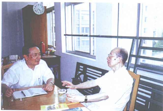
教向介绍 名在江宁 学右恩江 著贤在情 大(叶)况 京初先生 南赞作先 蒋书钊执 授本裕院 张书池书