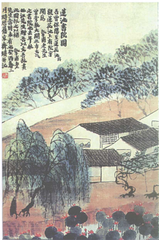
齐白石所画《莲池书院图》