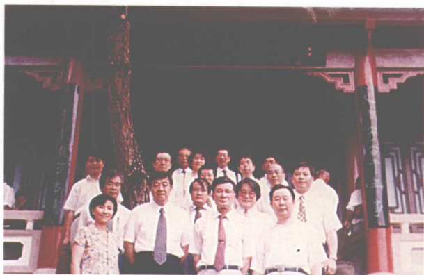
鄂州市领导与日本 友人拜谒张裕钊陵园后 合影