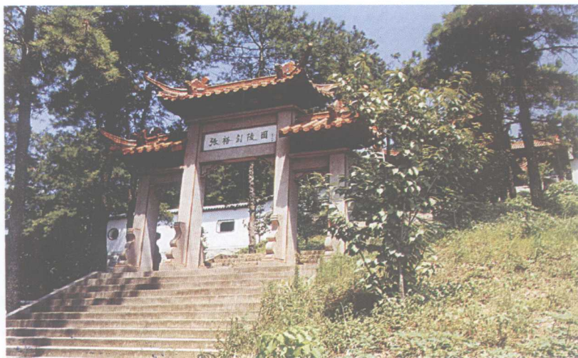
湖北鄂州张裕钊陵园