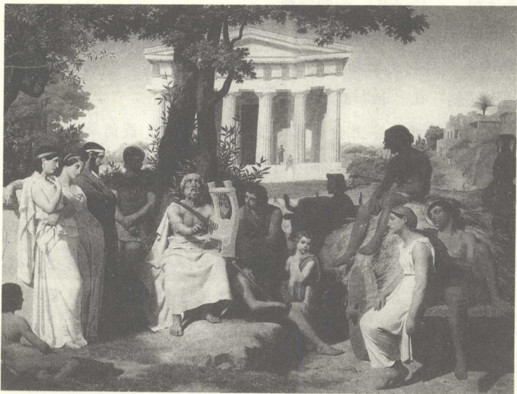
盲诗人荷马在唱诗

希腊神话始于荷马，古希腊最早的文字记录就是他的《伊利亚特》和《奥德赛》，一般认为不早于公元前1000年。而罗马神话除了加入些“本土神仙”，其他基本上是照搬希腊的，只不过“入乡随俗”地给神们起了相应的罗马名字，比如希腊神话中的“阿弗洛狄忒”、“雅典娜”、“厄洛斯”在罗马分别是“维纳斯”、“弥涅尔瓦”、“丘比特”。