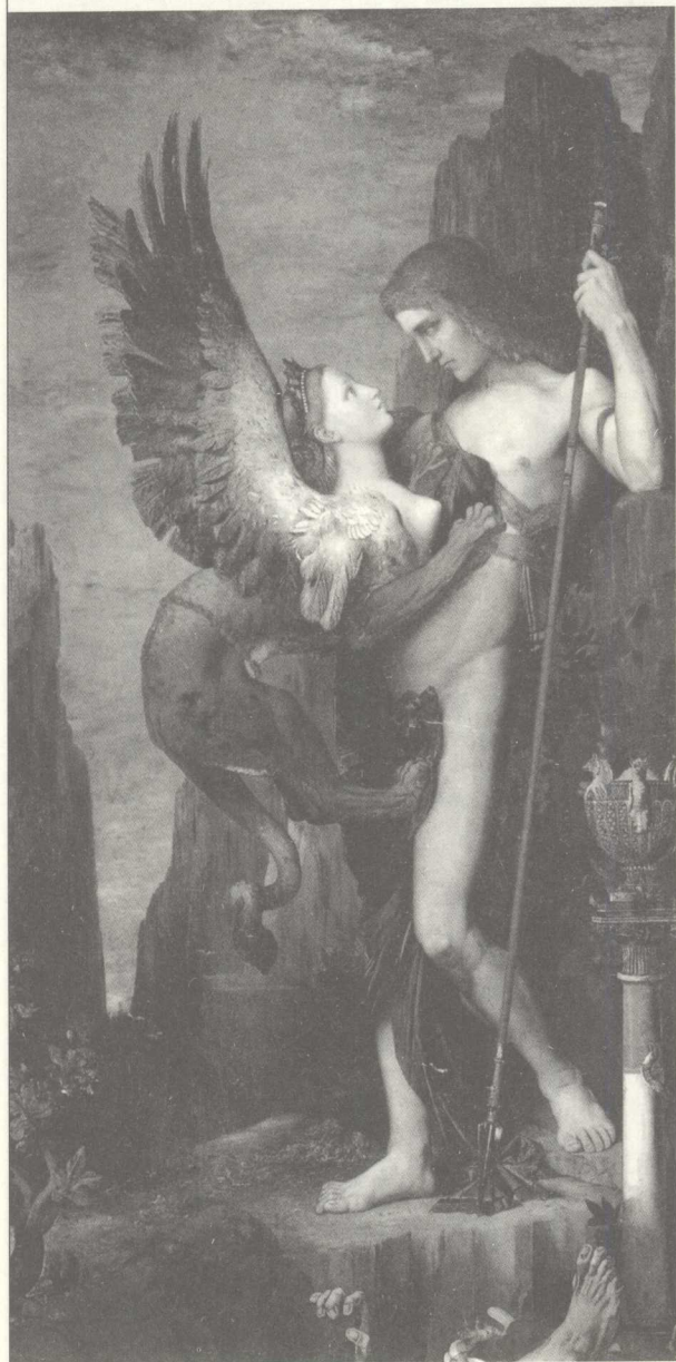
俄狄浦斯和斯芬克斯