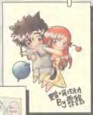
1区 212 同人 By: 贪玩 (以下为三则四格)

收到露拍的作品是在E-mail上，第一印象是很可爱的创意。这个……惠季和小黑合体，然后PIAPIA失宠了吗？哈哈。