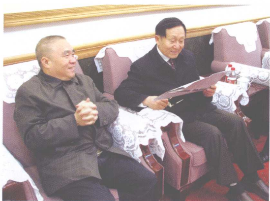
洪昭光教授(右)与广西区科协主席、中国工程院院士郑皆连亲切交谈。