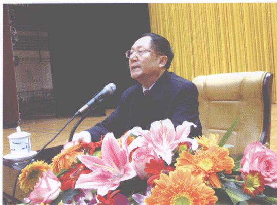
洪昭光教授应南方科技报社邀请,于2006年12月在广西人民会堂作健康报告。