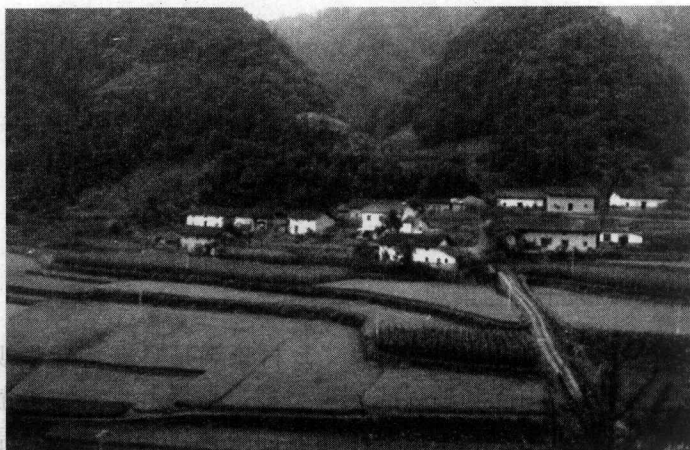
图 1-1 典型的中国乡村——人与土地的共生体（湖北宜昌）