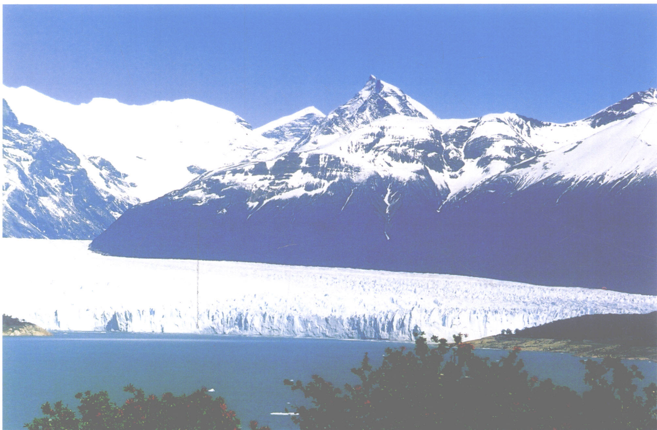
莫来诺大冰川之三（阿根廷）