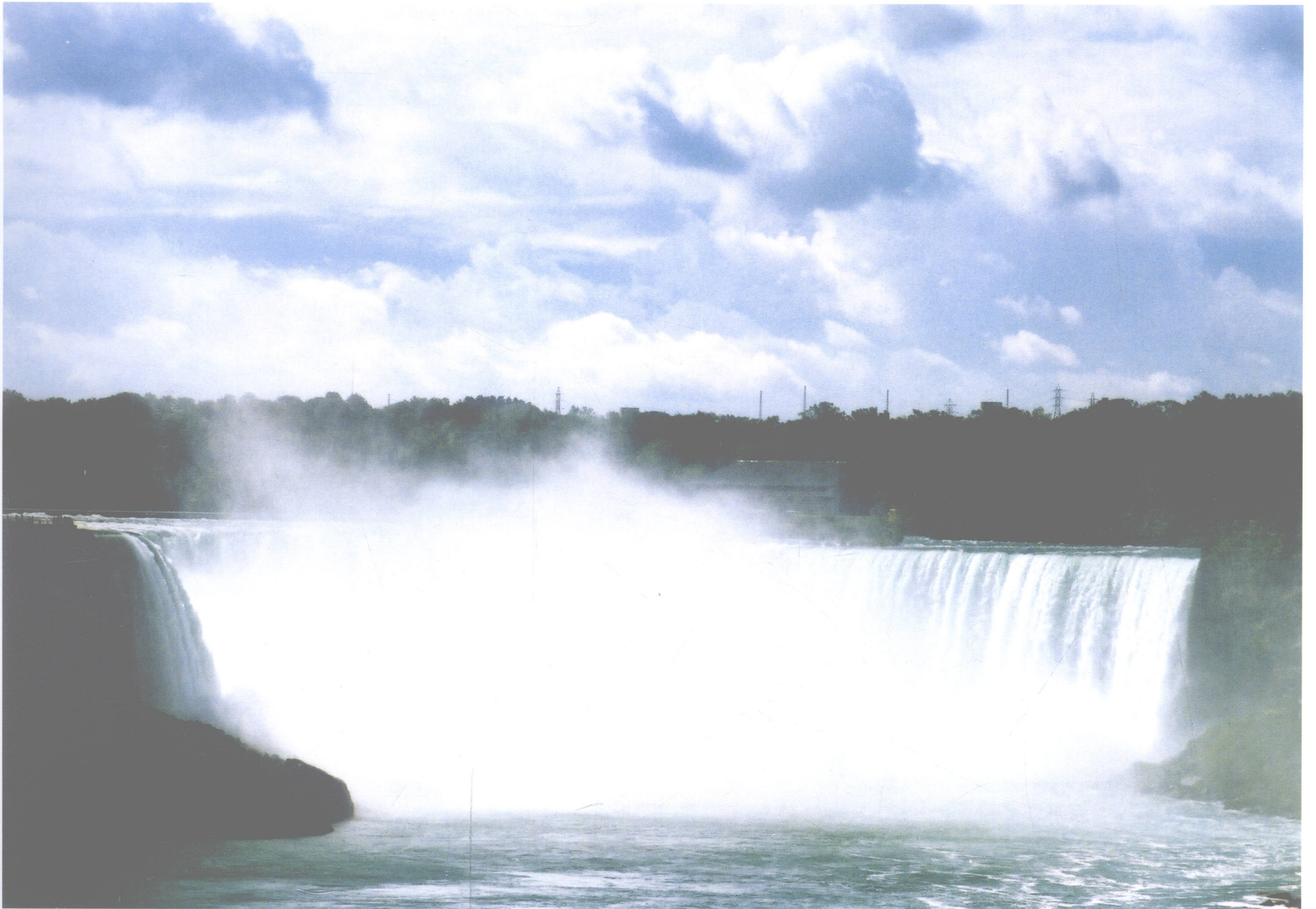
尼亚加拉瀑布一角——马蹄瀑布（加拿大）