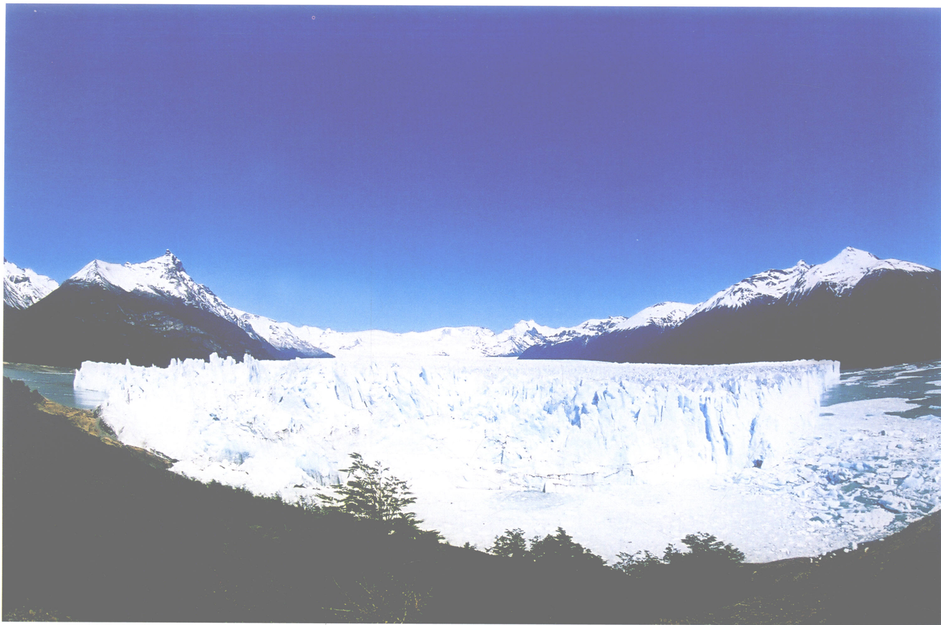
莫来诺大冰川之一（阿根廷）

安第斯山南部山谷地带的莫来诺大冰川，位于阿根廷卡拉法特国家公园，被誉为世界八大奇景之一。冰川正面约4千米宽，高约60多米。冰川长约34千米。据考证，该冰川形成于2万年前的冰河时期。