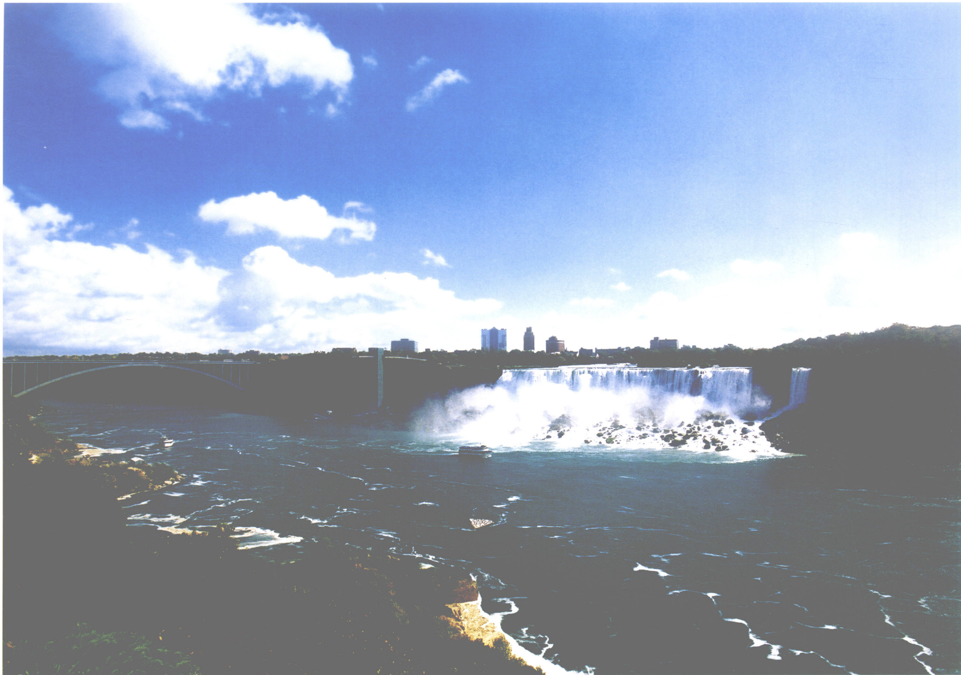
尼亚加拉河上连接加拿大和美国的桥 左侧为美国瀑布，右侧为新娘面纱瀑布