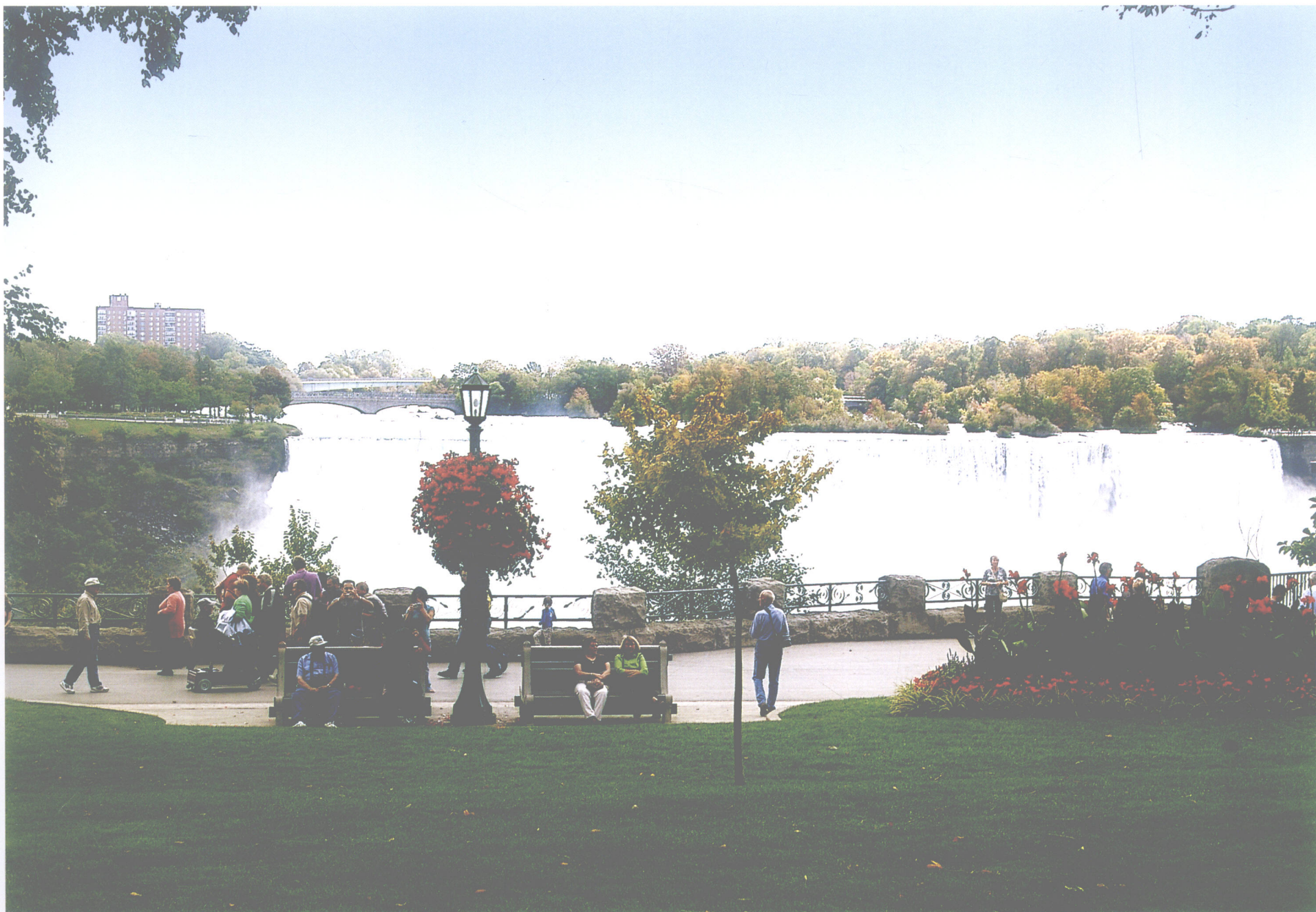
尼亚加拉瀑布一瞥