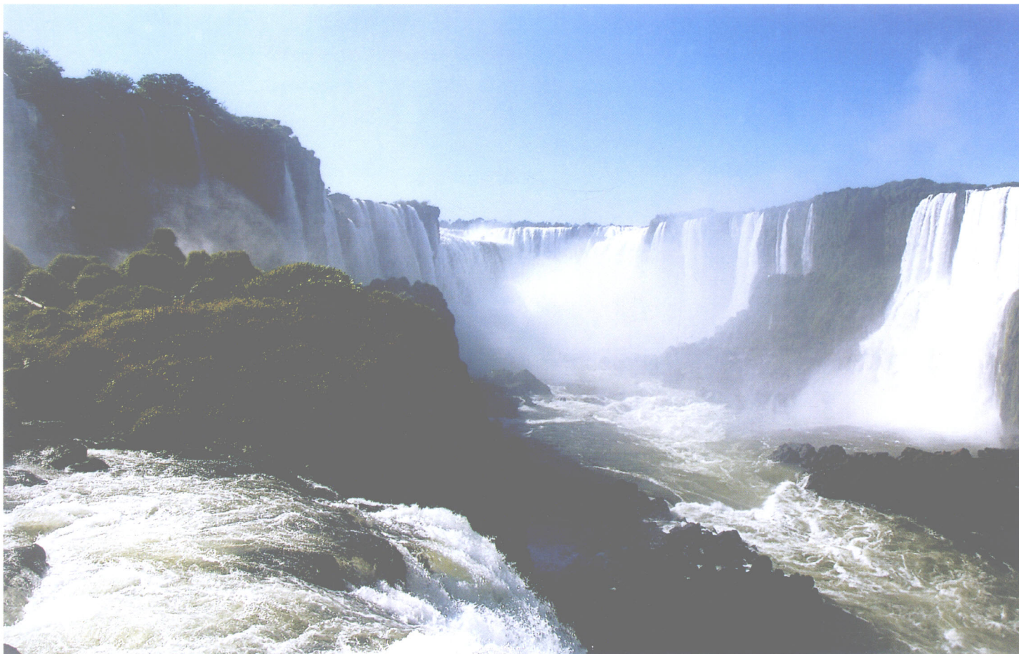
伊瓜苏瀑布之二（巴西）