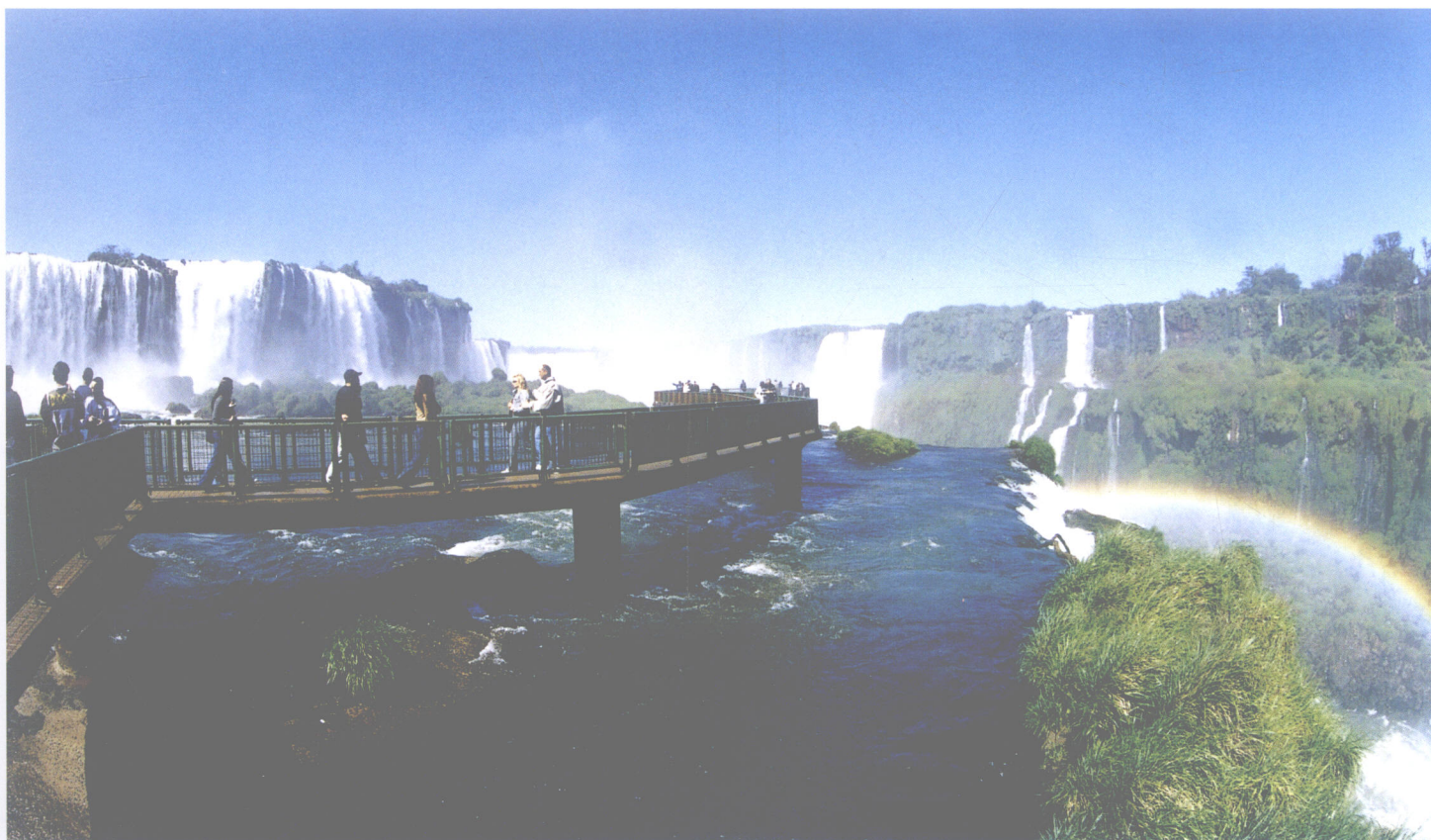
伊瓜苏瀑布之三（巴西）