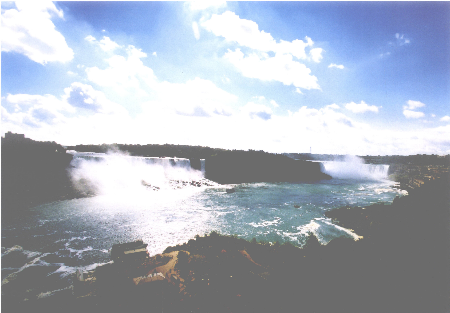
尼亚加拉瀑布全景（美国·加拿大）

尼亚加拉瀑布，位于美国与加拿大边界上的尼亚加拉河上，宽1240米，平均落差55米，是继非洲维多利亚瀑布和巴西伊瓜苏瀑布的世界第三大瀑布，瀑布分三股水流：第一、二股在美国陆地与高特岛之间，中间又被鲁那岛分流，靠美国陆地一侧叫美国瀑布，靠高特岛一侧的叫新娘面纱瀑布，第三股瀑布在高特岛与加拿大之间，水面呈弧形，状如马蹄，又称马蹄瀑布，也叫加拿大瀑布，宽约675米，落差56米。