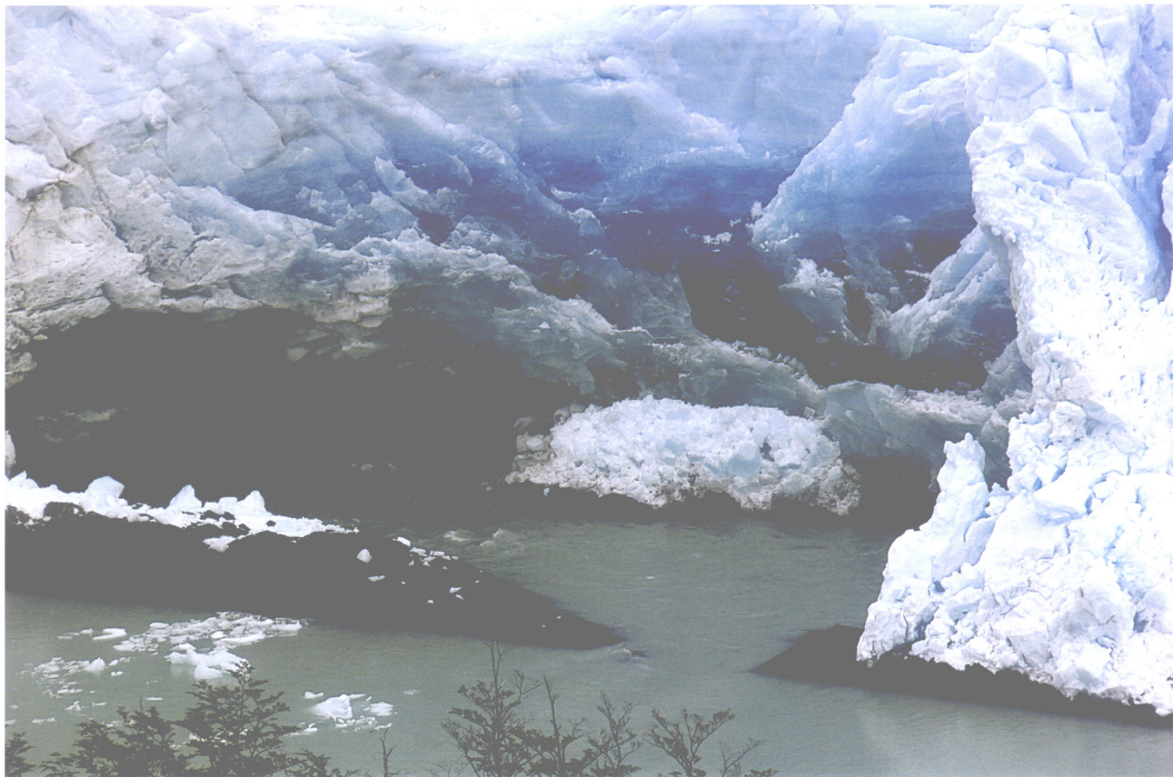
莫来诺大冰川之二（阿根廷）