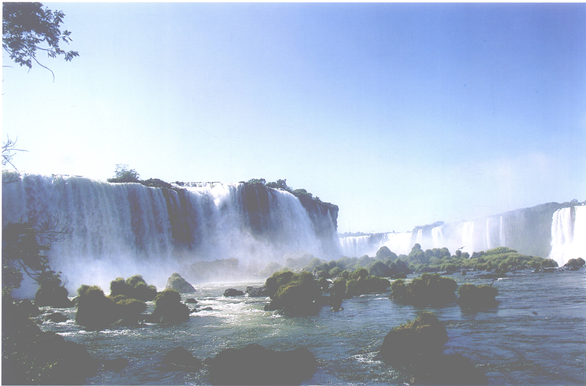
伊瓜苏瀑布之一（巴西）