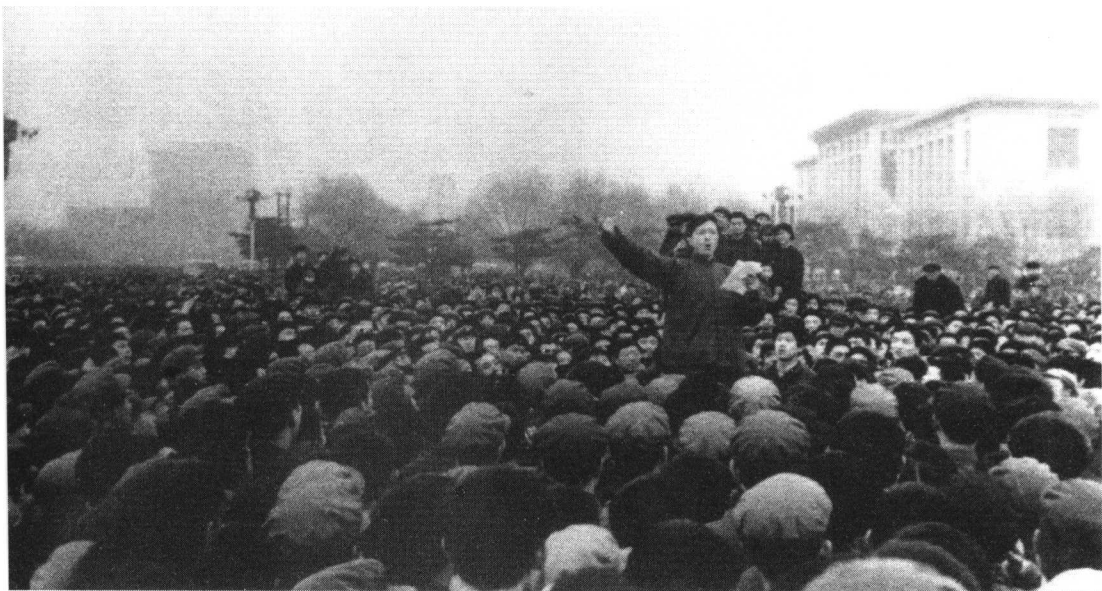
图为“四五”运动期间，有人在天安门广场发表演说，抨击时政。

从这天起到4月26日，王洪文、姚文元等先后给《人民日报》负责人打了24次电话，其内容是：一是把群众悼念周恩来总理的活动定性为反革命性质；二是诬陷邓小平；三是打击敢于同他们作斗争的群众；四是为他们篡党夺权制造舆论。〔2〕