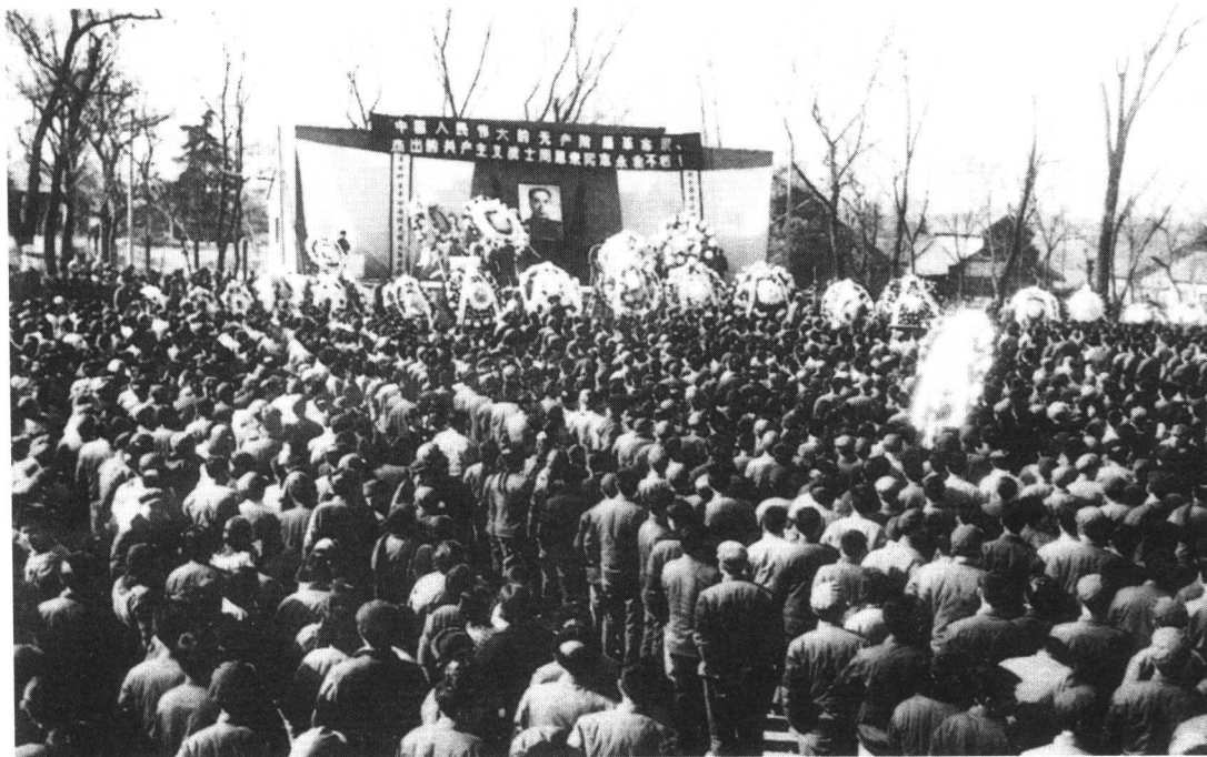
图为南京大学教师和学生在集会。

1976年“天安门事件”被定性为“反革命政治事件” 叶剑英决定“摊牌”，解决“四人帮”问题 “两个凡是”出台 邓小平复出始末