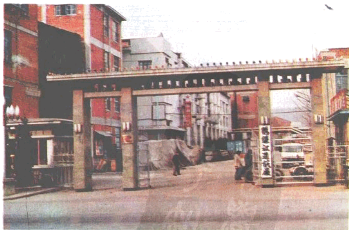
鸭绿江造纸厂厂正门