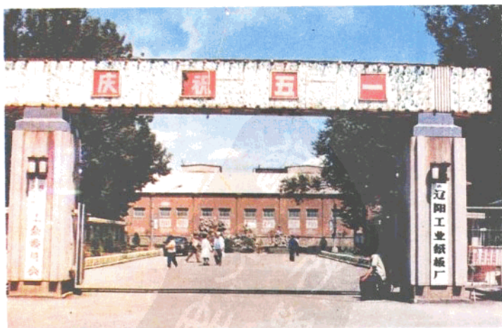
辽阳工业纸板厂厂正门