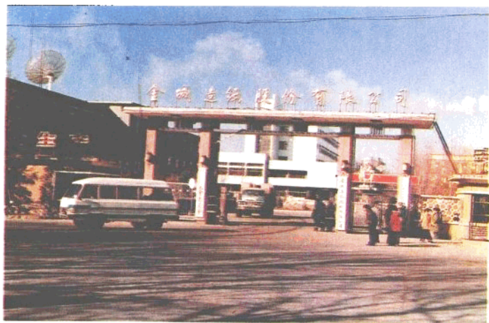
金城造纸股份有限公司正门