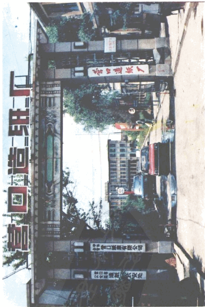
营口造纸厂厂正门