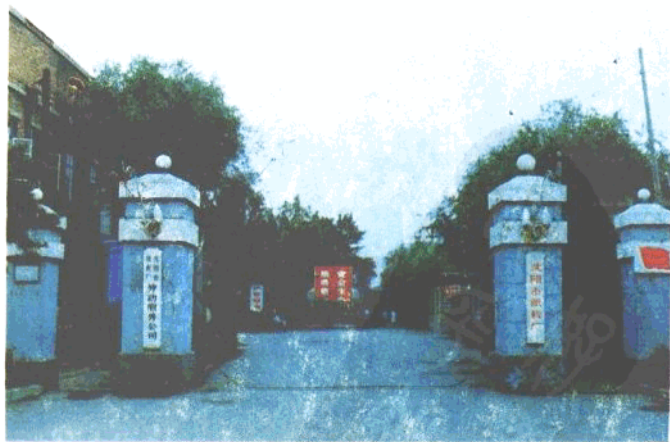
沈阳纸板厂厂正门