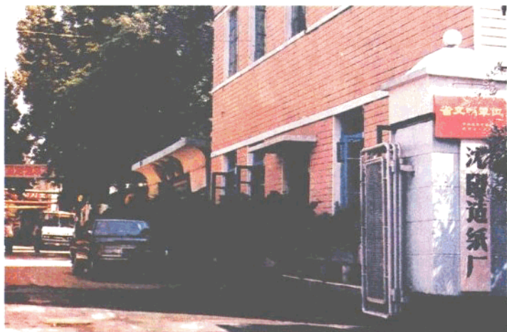
沈阳造纸厂厂正门