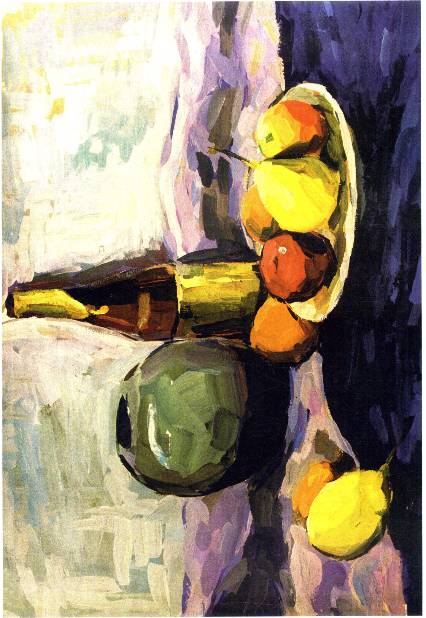
13 学生作品 1、该静物在用光上考虑不当，出现光源的矛盾，使整个画面始终处在一个矛盾的对立体中。2、在主体物体中颜色表现得不够亮丽，体积感不强，素描与色彩两者之间也没有很好的表现，特别是暗部在塑造和观察方法上还需多做努力；高光处也不可几笔草草，影响画面的整体亮度。