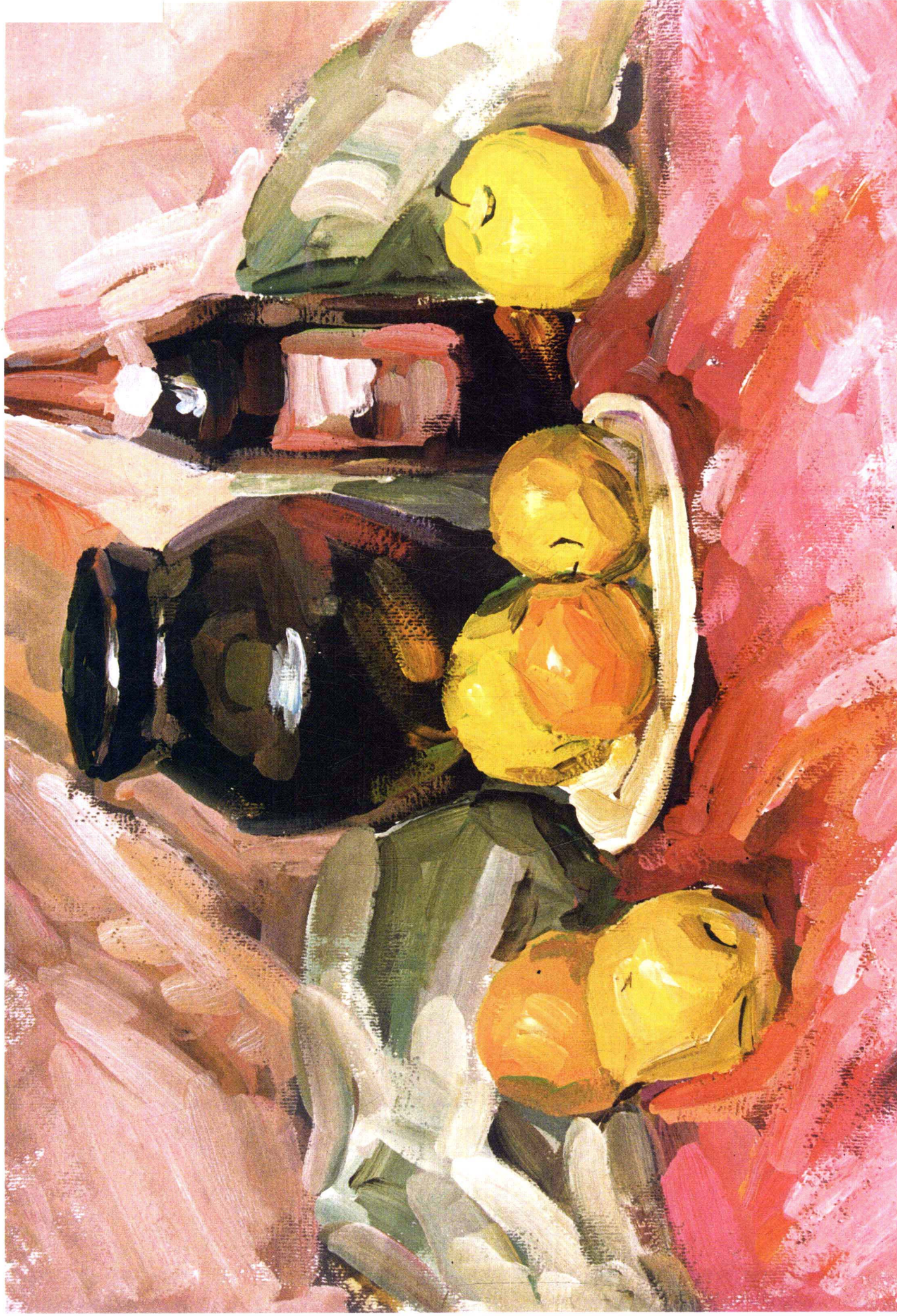
5 学生作品 该画画面有几个问题需要解决：1、罐子和酒瓶重色过渡到亮色不理想；2、水果在刻画上不够深入，缺少细节的变化，用色上也比较雷同，水果的形体也不够严谨，特别是前面的梨，不那么厚重，显得太轻。3、粉红色衬布的颜色在处理上不老练，光源、环境和固有色三者之间缺乏连接，单调而不丰富。