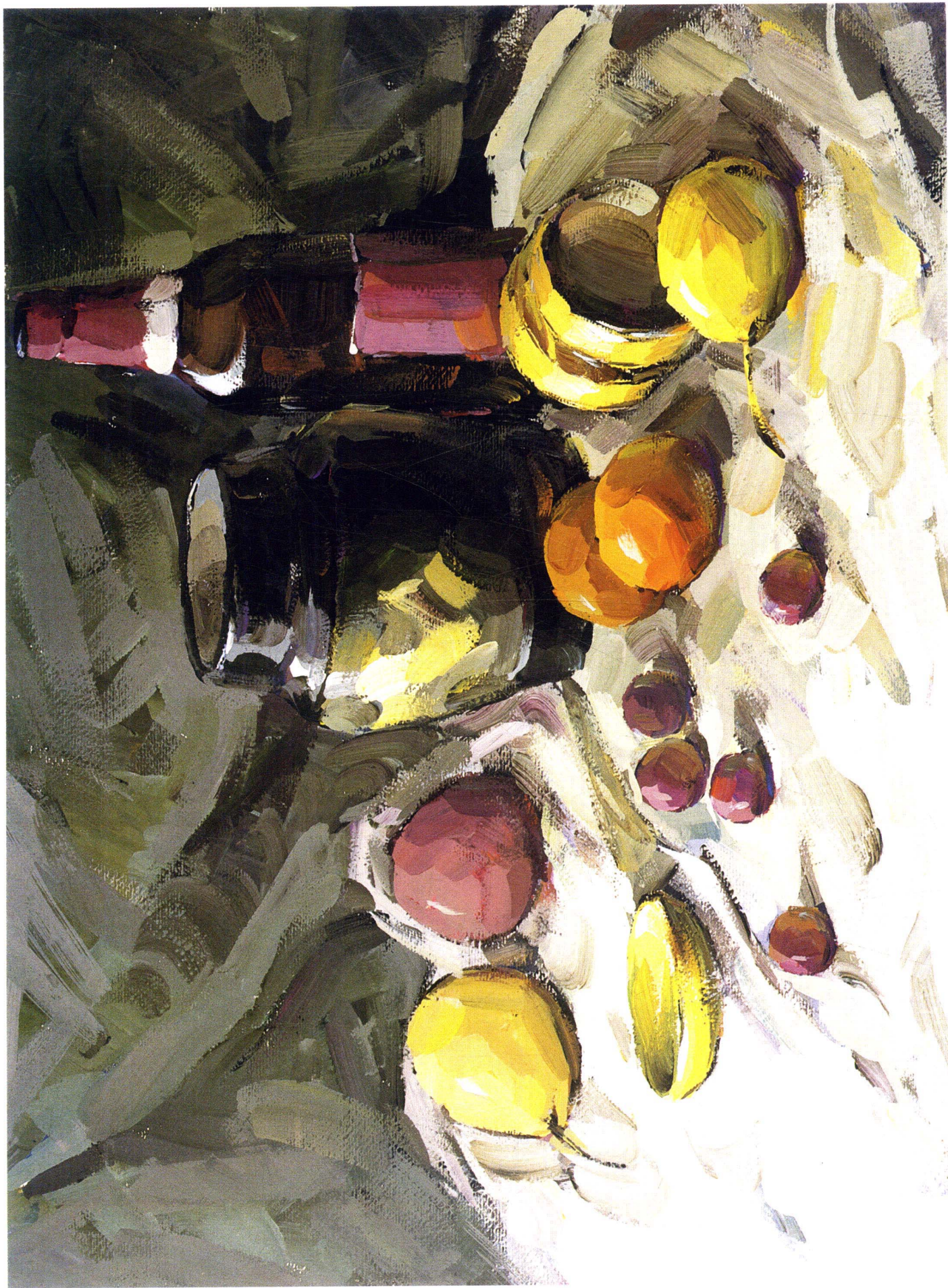
10 改优作品 改动：1、首先调整画面的主色调，明确三块衬布的色彩倾向；2、将不同的水果逐一表现出来，使它们色彩明确，体感强烈，冷暖到位，且有空间感；3、罐子做深入地刻画，同时将后面酒瓶一起画出，这样前后关系就比较协调映入画面，使画面和谐而不生硬。总之，这幅画主要强调的是画面的色调的统一，这往往是考生容易忽视的东西。再者，不论画什么，都要思考在先，不可乱加色，影响画面的整体感。