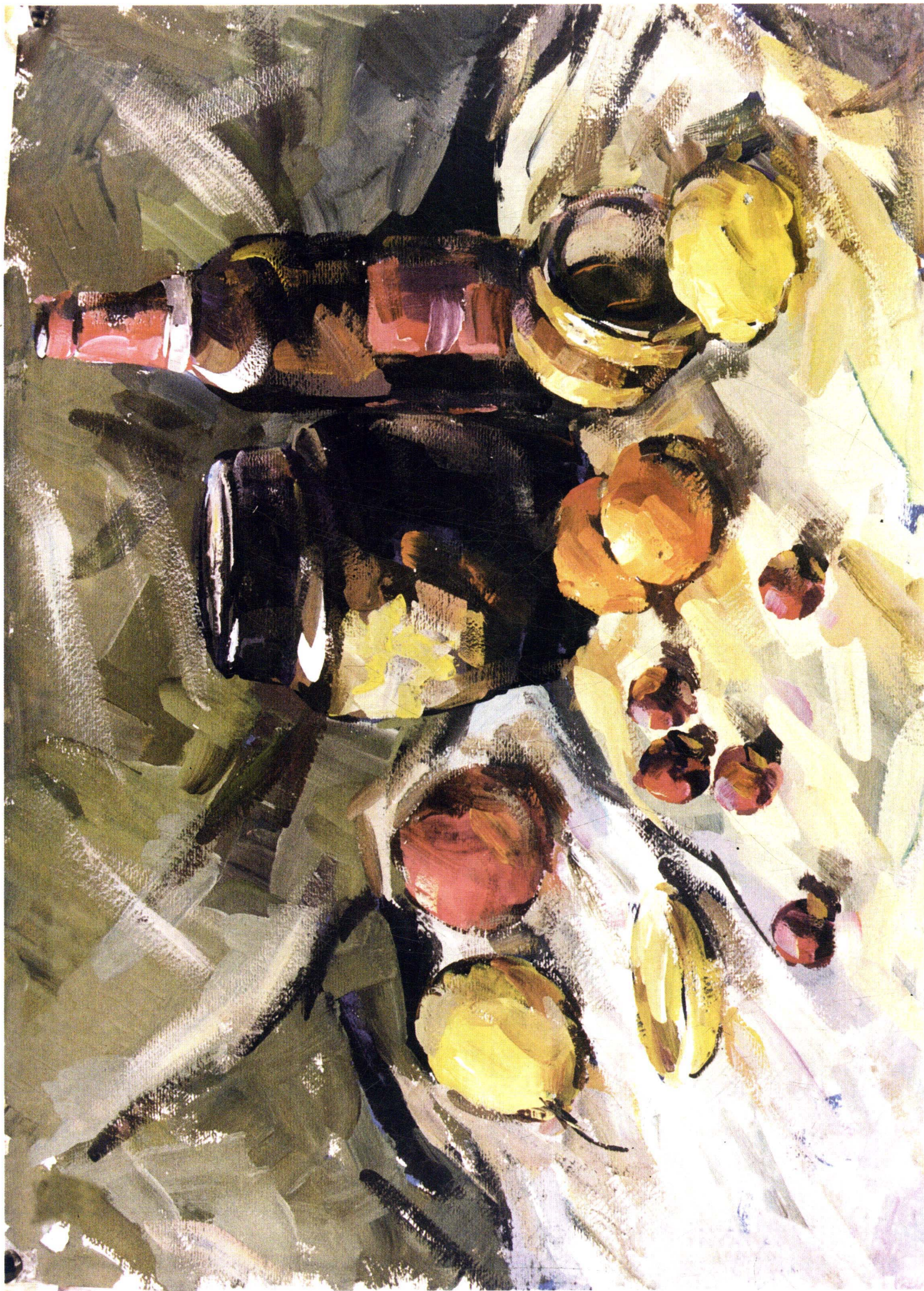
9 学生作品 这幅画主要是画得太乱，背景衬布干扫几笔的亮色，实属不假思索地信手涂画，造成背景衬布混乱。前面的白布、灰色衬布的色彩倾向不明确，核心主体物（如水果和罐子）都没有很好地加以深入地刻画。