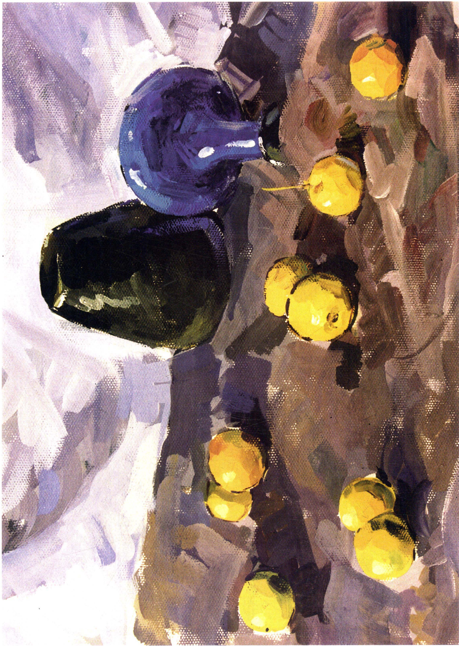
11 学生作品 我记得这幅画，在学生作画的过程中，曾经改过，如水果和两只罐子。1、可能学生学习色彩的时间不长，所以对灰色的处理还远不尽人意，使得灰

冷色表现得比较欠缺，没有将有彩和无彩系颜色巧妙地结合起来。2、水果在塑造上也还不够，暗部和投影的暖重色效果不佳。