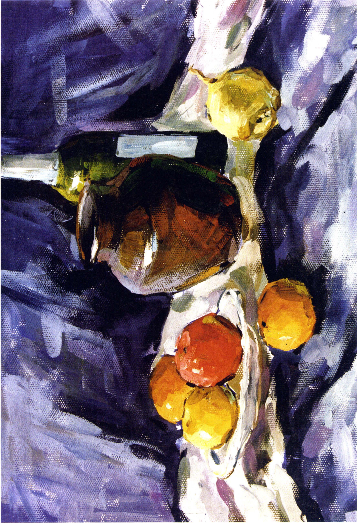
3 学生作品 这幅画总体看起来画得还可以，只是存在一些小问题，如：罐子冷色用量过大，后面瓶子受光面暖色过量，还有前面水果的塑造还有待于加强等等。