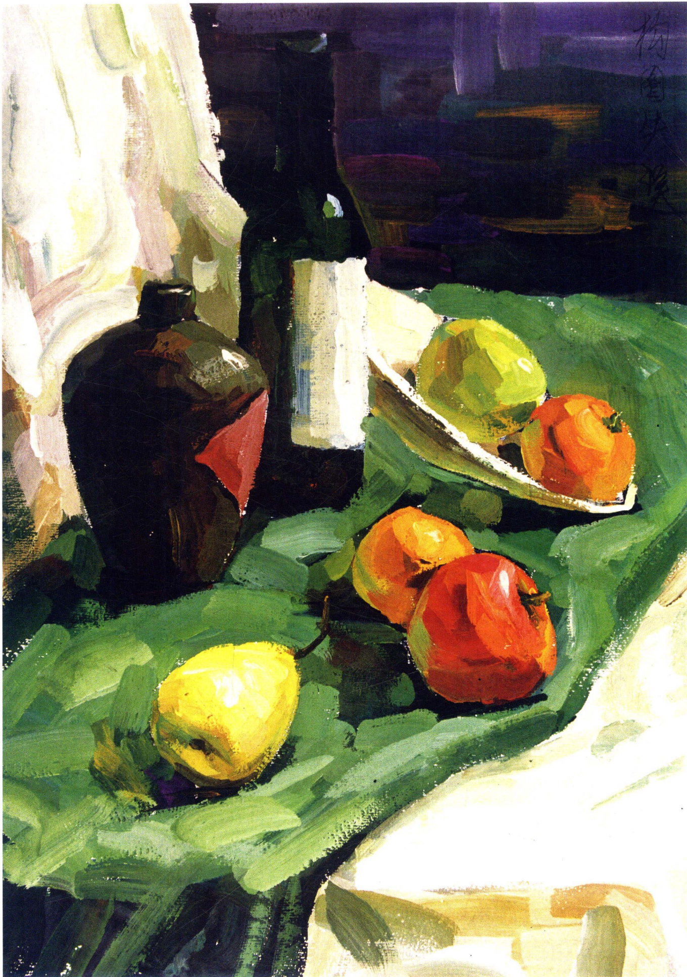
1 学生作品 此画有不俗的表现，不论从刻画，还是从整体的把握上，都基本达到了学习的要求。然而，背景笔触太明显，而且紫色太突出，空间感也欠考虑，中间的绿色衬布的光源色需要补充，且几个水果的细致刻画有待于表现。