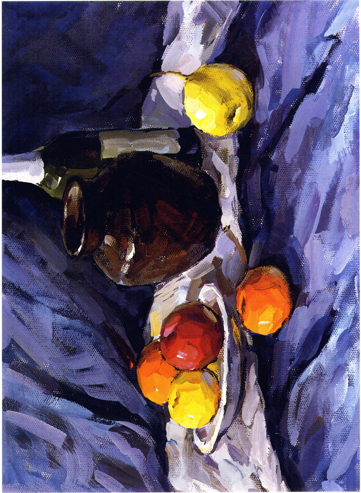
4 改优秀作品 改动：1、多保留，少改动；2、罐子上的冷色，加一些暖复色，使灰暖色十分自然地过渡到暗部；3、高光加点冷色，使其丰富而不感觉单调，瓶子上暖绿色调整成灰绿色，以明确光源色的色彩倾向；4、水果和盘子都作了相应处理，以突出主体物。