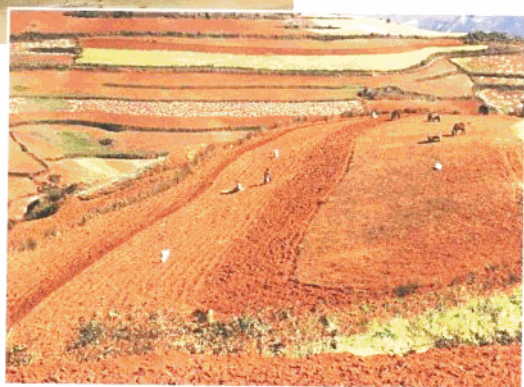
干旱的滇北 红土地