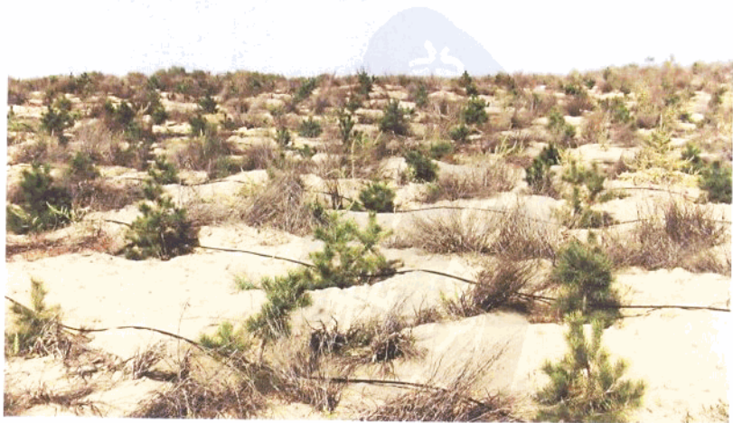
治理中的沙化地区