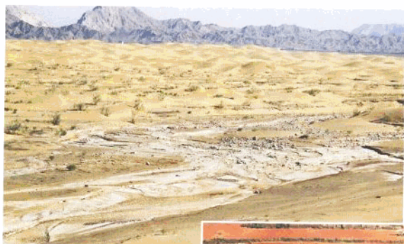
内蒙古乌海部分 地区荒漠化现状