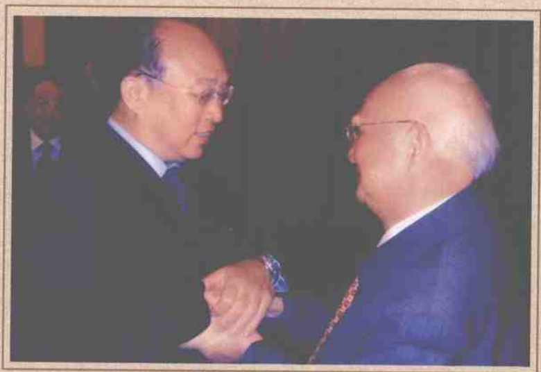
□ 全国社会保障基金理事会项怀诚理事长接见邓子基资深教授