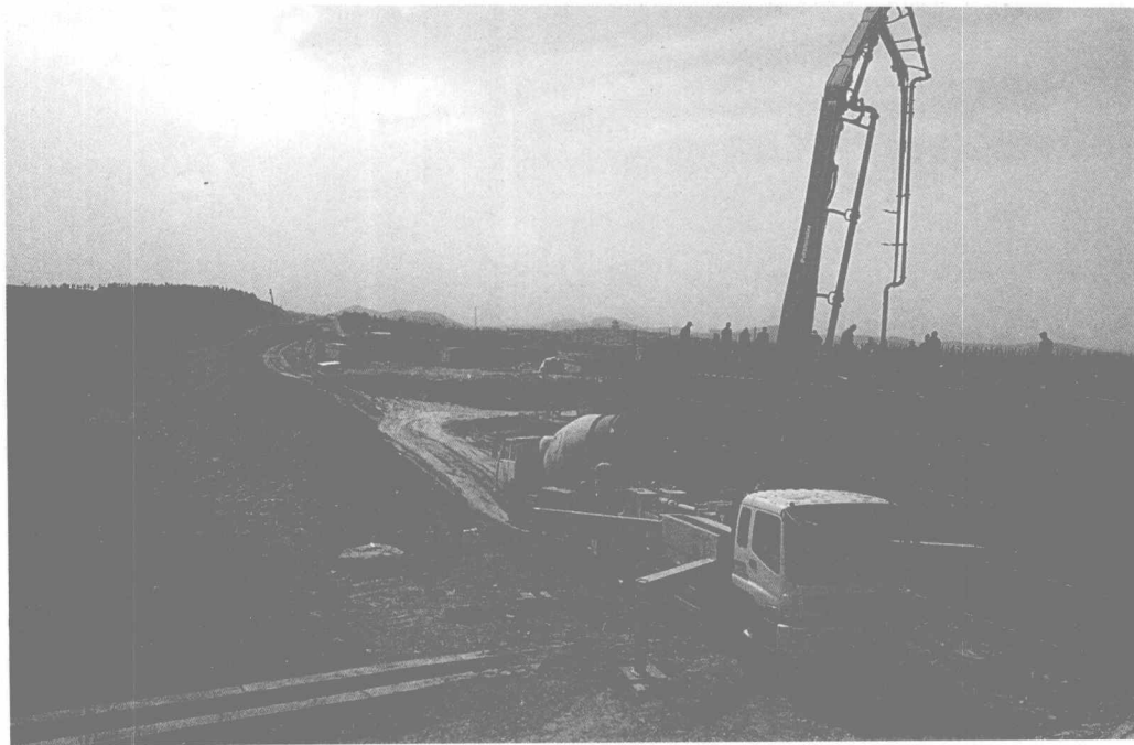
横跨齐长城的高速公路高架桥正在建设中