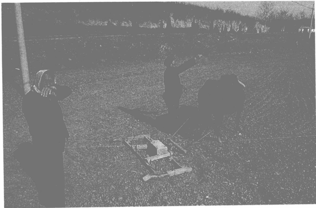
齐长城起点处种地的农民

的空地种上了小麦、棉花，直到十几年前，村民们才被禁止到这里乱采乱挖。记者看到，横截面呈梯形、上宽约三米的长城上，新扶的田垄仿佛刻在长城躯体上的道道伤痕。石碑向北约5公里就是黄河了，这里的田地都依赖黄河灌溉。沿着残缺的长城向西，一段石块垒成的沟渠连接着一个石块砌成的蓄水池，仿佛一只巨大的枷锁，紧紧地锁住长城的咽喉，当地农民就是从这个蓄水池中取水灌溉。长城变成了灌溉的沟渠，两千多年前的古长城就这样以让人痛心的形式被古为今用了。