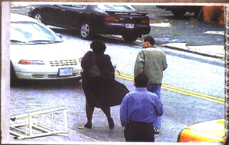
《美国侨报》报道，“法院派来打开脚铐的女士”。