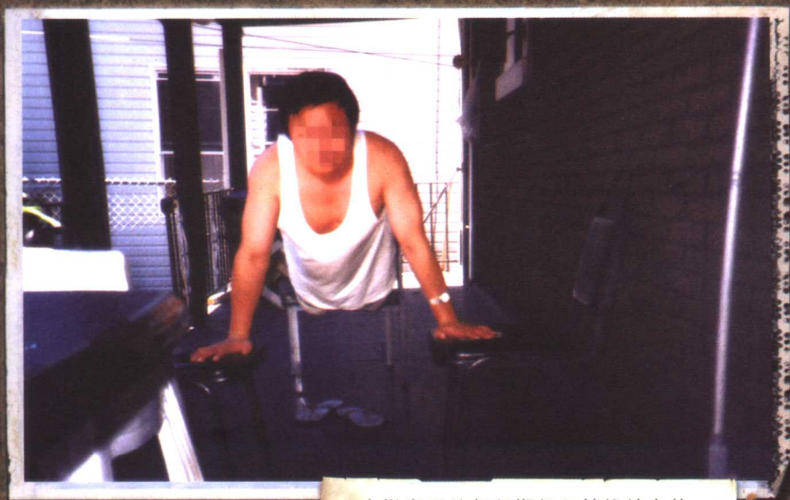
在撤案后的保释期仍坚持锻炼身体， 坚信自己会胜利。