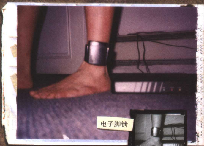
电子脚铐近景，被囚者只能在百余平米范围内活动。