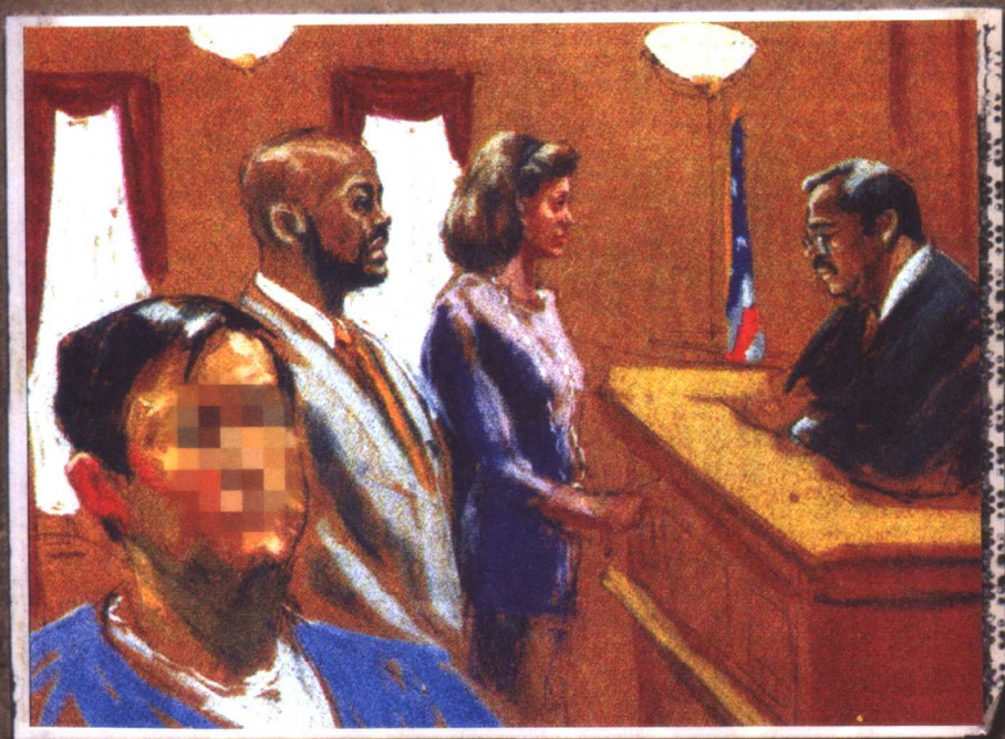
美联社的法庭素描图。