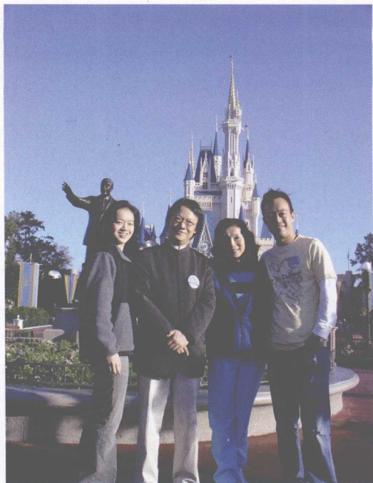
全家在美国迪斯尼乐园游玩。