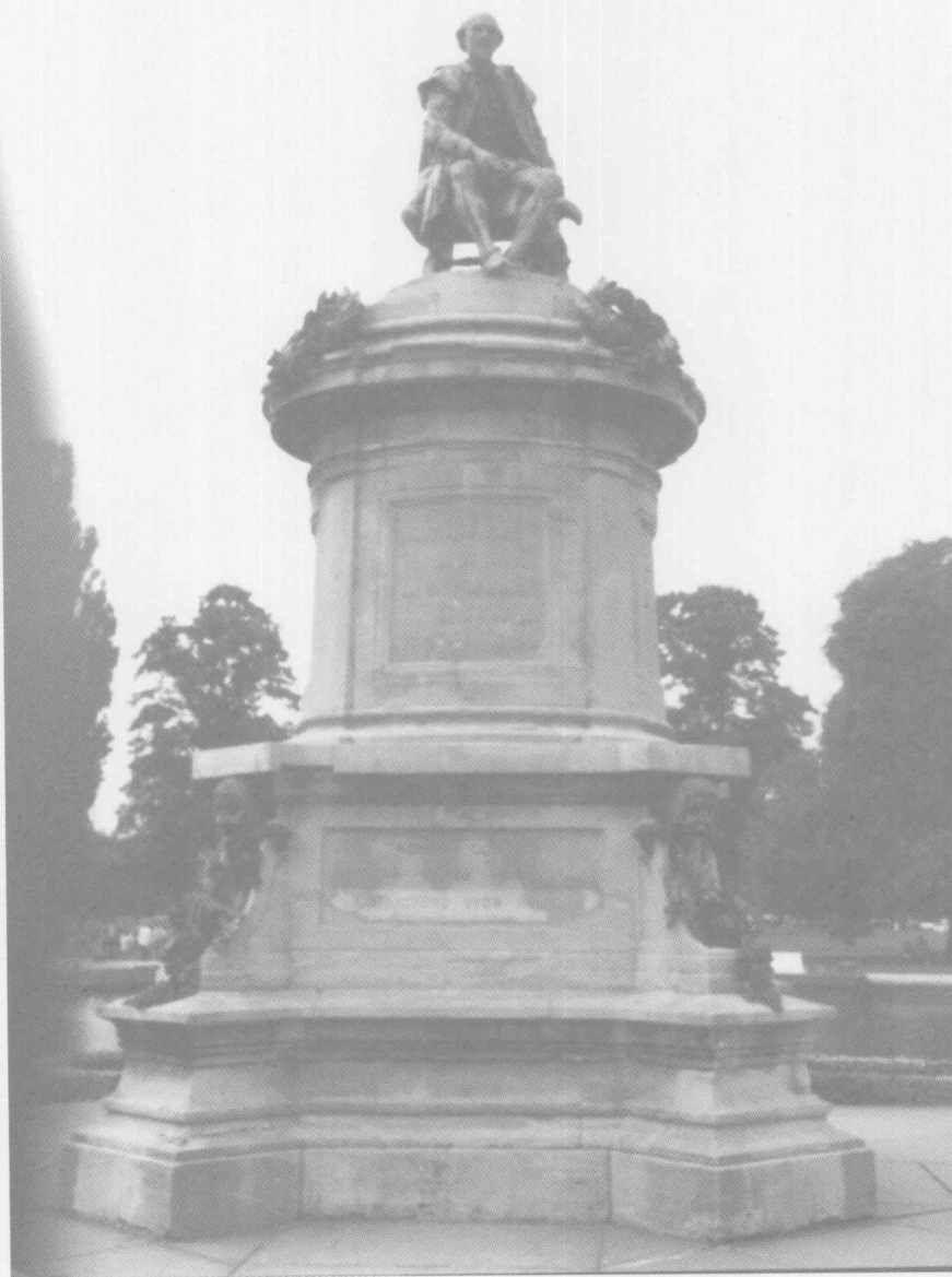
莎士比亚纪念像 (立于莎士比亚的故乡)