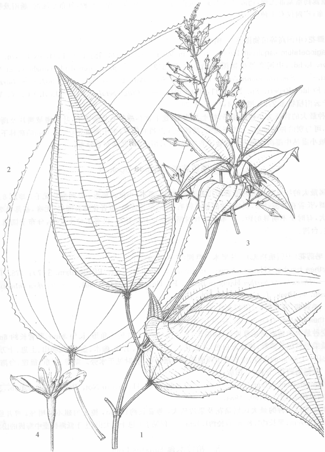
图版 3 1~2. 尖子木 Oxyspora paniculata (D. Don) DC. 1. 花枝; 2. 大叶轮廓。 3. 毛药花 Barthea barthei (Hance) Krass. var. barthei 果枝。 4. 宽翅毛药花 B. barthei (Hance) Krass. var. valdealata C. Hansen 花放大。(李锡畴绘)