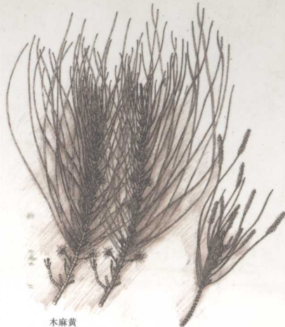
木麻黄 Casuarina equisetifolia