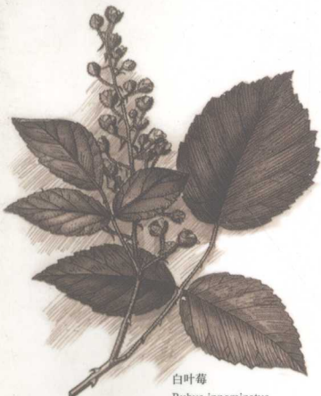
白叶莓 Rubus innominatus