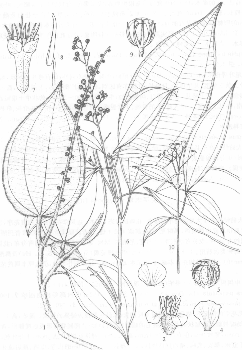
图版 2 1~5. 长穗花 Styrophyton caudatum (Diels) S. Y. Hu 1. 植株上部; 2. 花放大; 3~4. 花瓣放大; 5. 果放大。 6~9. 异形木 Allomorpha balansae Cogn. 6. 植株上部; 7. 花放大; 8. 雄蕊放大; 9. 果放大。 10. 偏瓣花 Plagiopetalum esquirolii (Lévl.) Rehd. 果枝。 (吴锡麟绘)