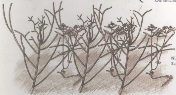
绿玉树 Euphorbia tirucalli