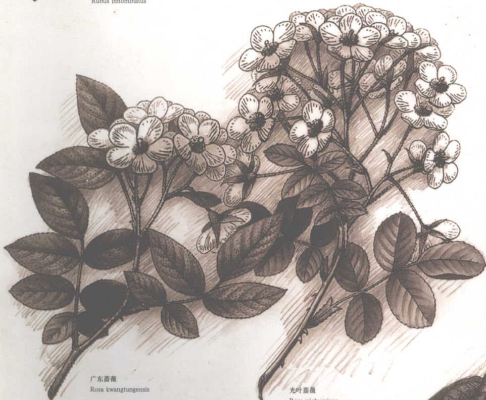
广东蔷薇 Rosa kwangtungensis