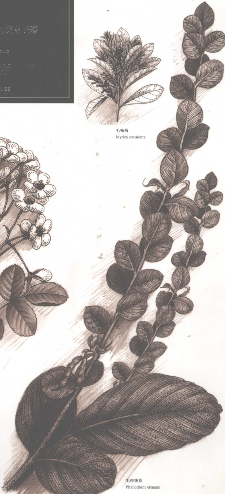
毛排钱草 Phyllodium elegans