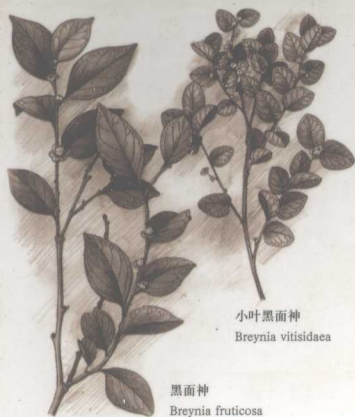
小叶黑面神 Breynia vitisidaea

GUANGXI SCIENCE AND TECHNOLOGY PUBLISHING HOUSE