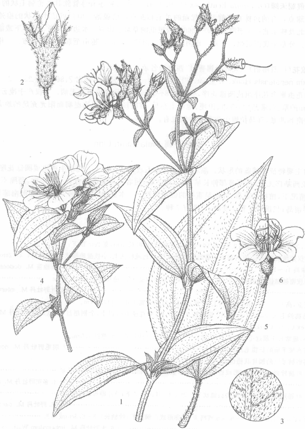
图版 1 1~3. 朝天罐 Osbeckia opipara C. Y. Wu et C. Chen 1. 植株上部; 2. 花蕾放大; 3. 叶背一部分放大示毛被。 4. 细叶野牡丹 Melastoma intermedium Dunn 植株上部。 5~6. 大野牡丹 M. imbricatum Wall. ex C. B. Clarke 5. 叶; 6. 花放大。(李锡畴绘)