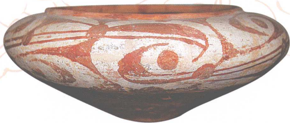
涡漩纹扁腹陶钵（新石器时代大汶口文化）