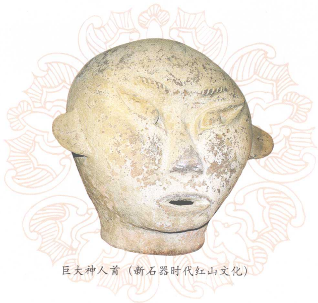
巨大神人首（新石器时代红山文化）