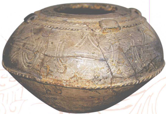
黑陶四系划花纹罐（新石器时代崧泽文化）

中国陶器发展史的上限年代至今还难以考据，但随着考古发掘工作的不断进行，一定会出现不同的新认识。