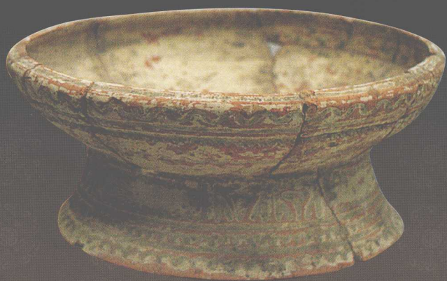
白衣红陶盃（新石器时代）