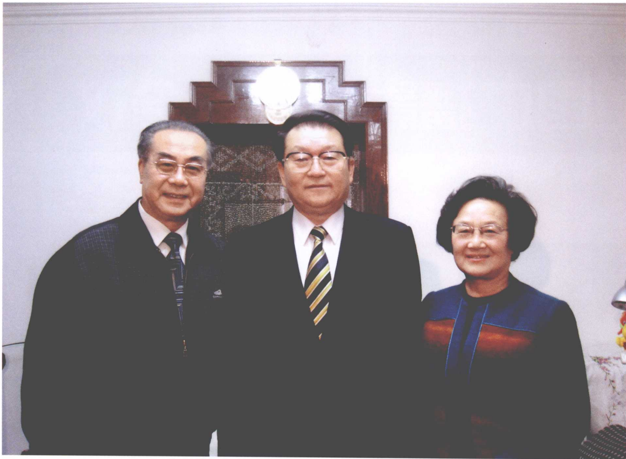
2007年2月8日，中共中央政治局常委李长春看望中央电台著名播音员方明。