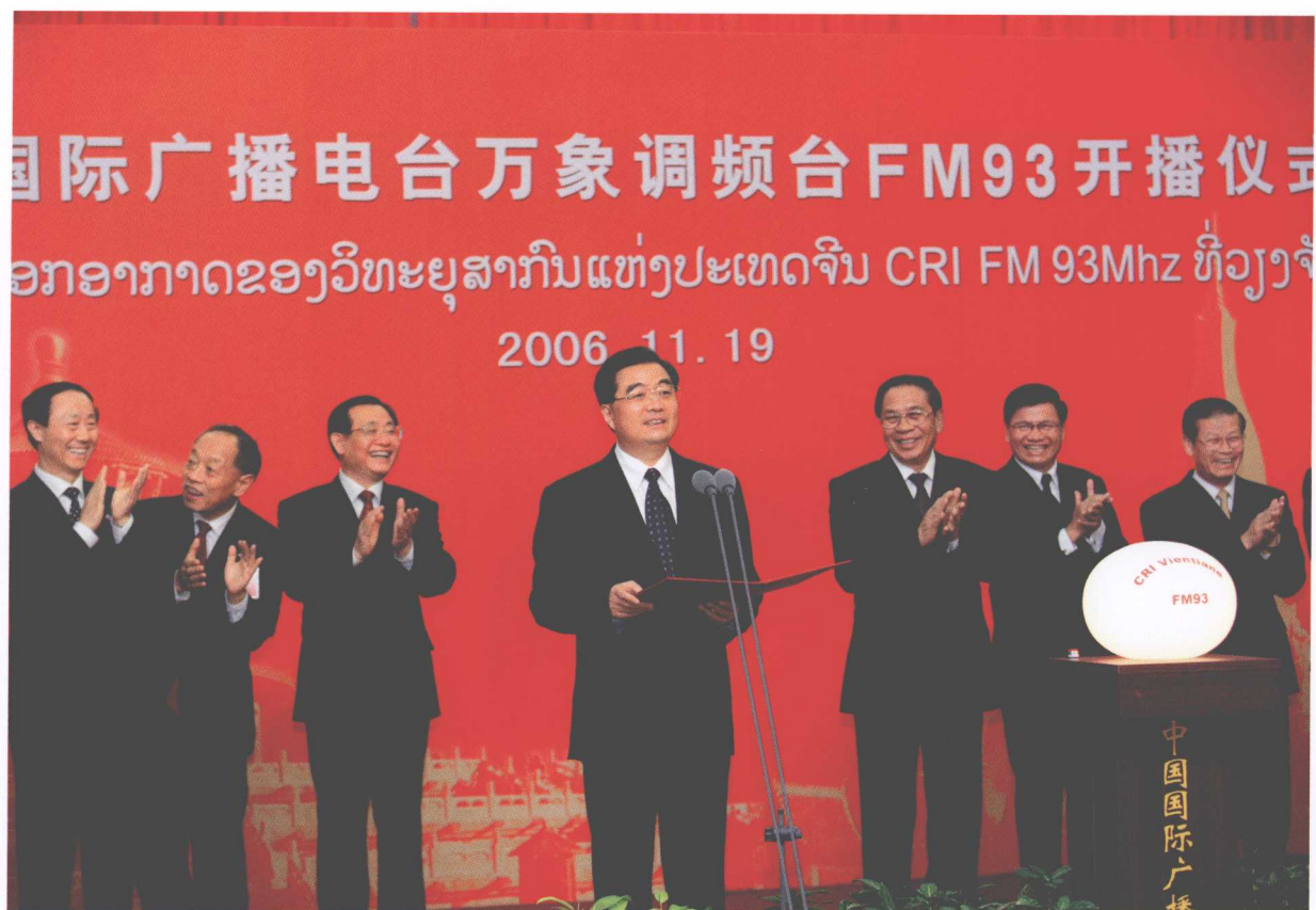
胡锦涛主席在国际台老挝万象调频台开播仪式上致词。