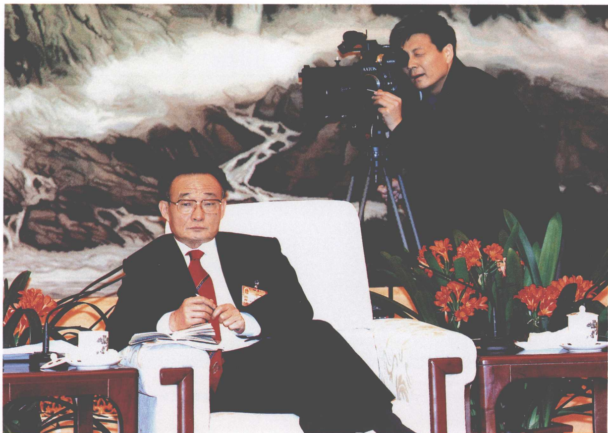
2006年3月4日，全国人大常委会委员长吴邦国在十届人大四次会议的代表团小组会上。中央电视台记者采访。