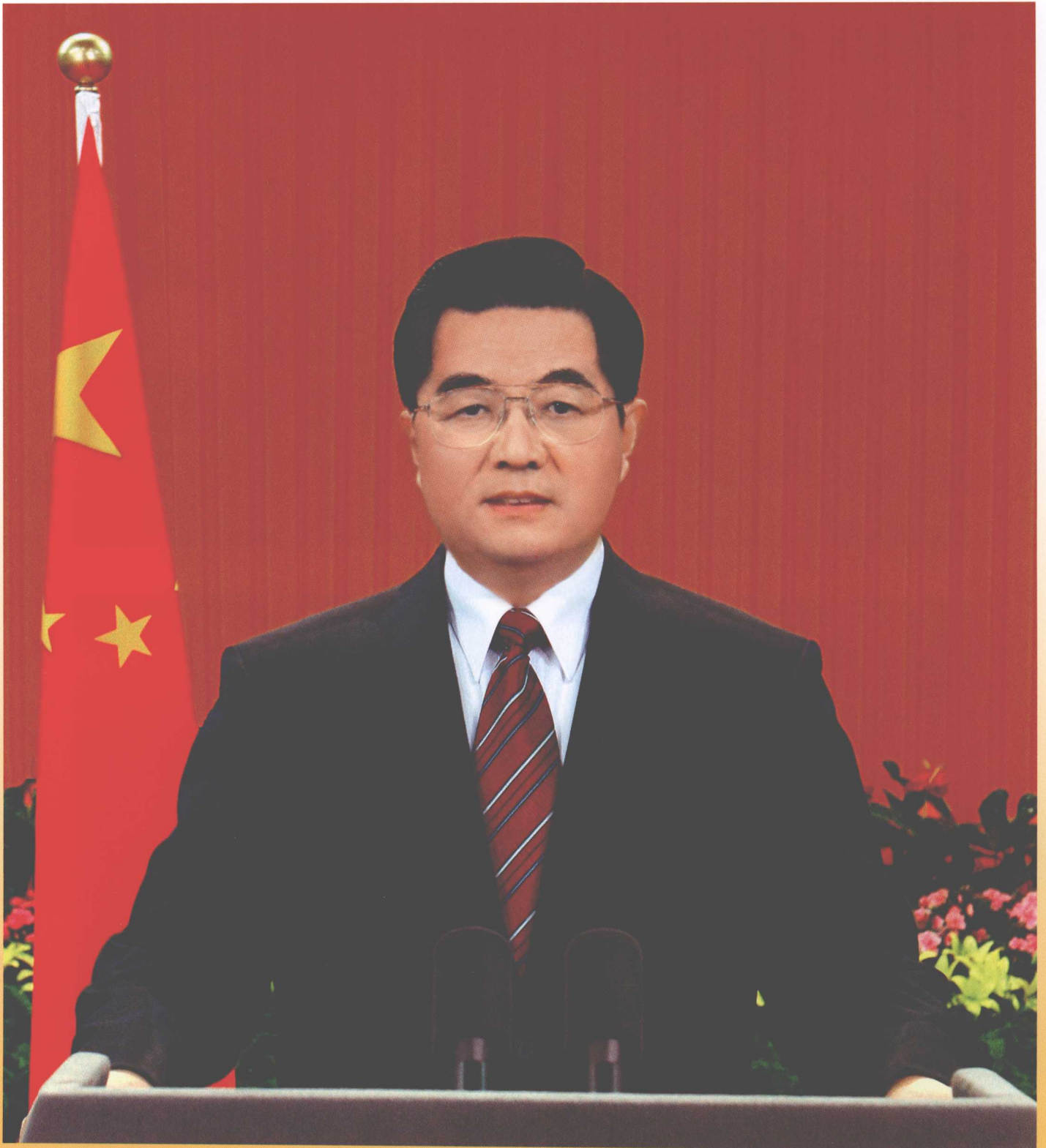
2007年新年前夕，国家主席胡锦涛通过中央电视台、中央人民广播电台和中国国际广播电台，发表题为《共同谱写和平、发展、合作的新篇章》的新年贺词。