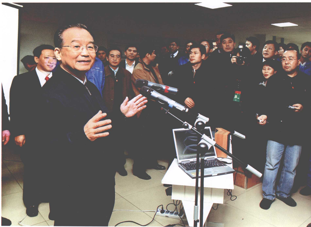
2007年2月4日，温家宝总理考察长春职业技术学院时发表讲话。中央人民广播电台记者采访。