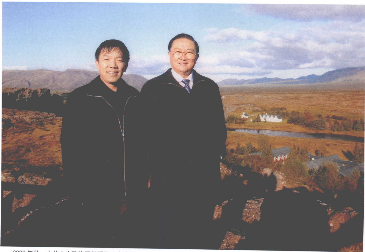
2006年秋，中共中央政治局常委罗干出访欧洲时，与中央电视台记者合影。