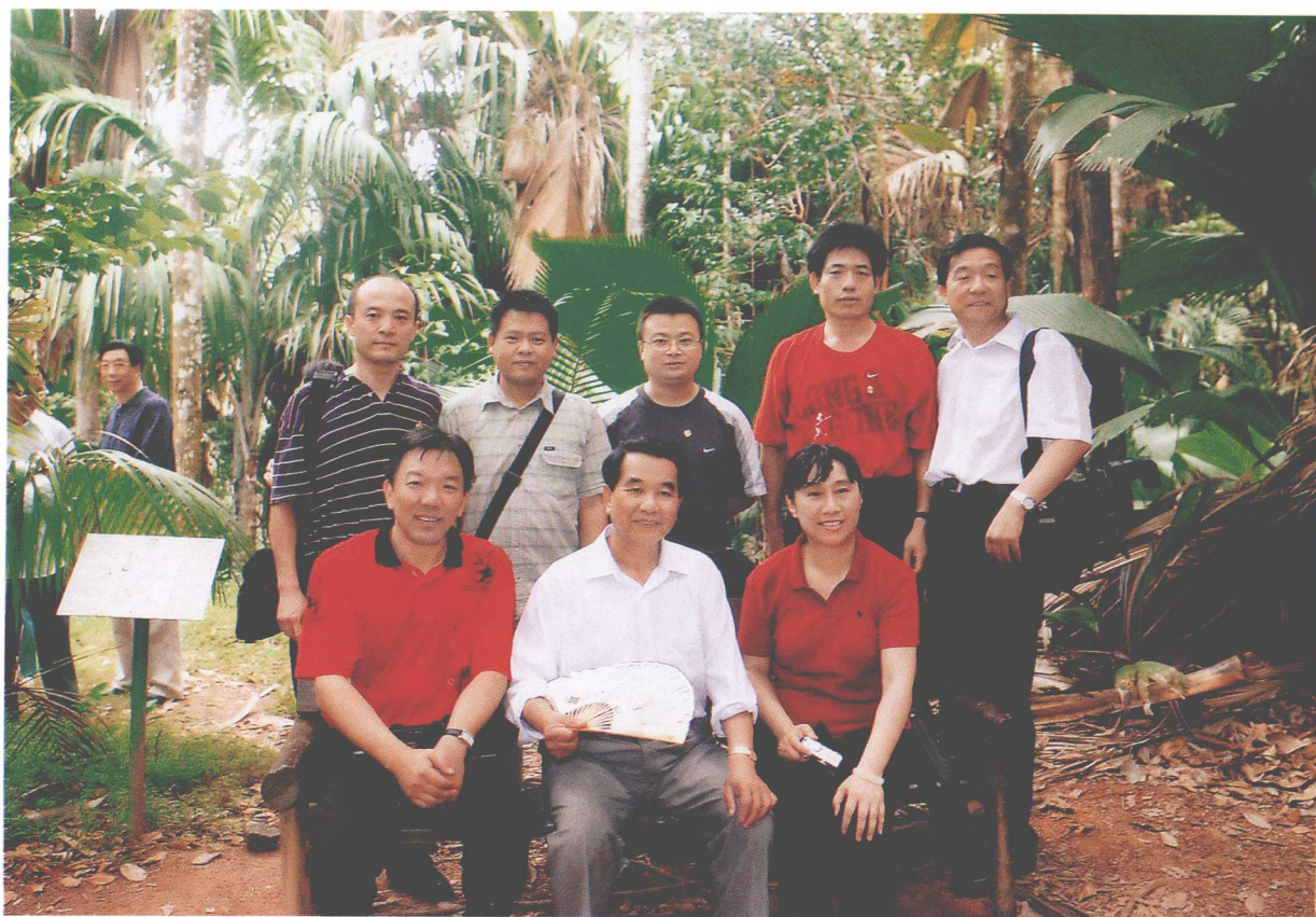
2006年6月，中共中央政治局常委、中央纪委书记吴官正出访非洲，与新闻记者们合影。