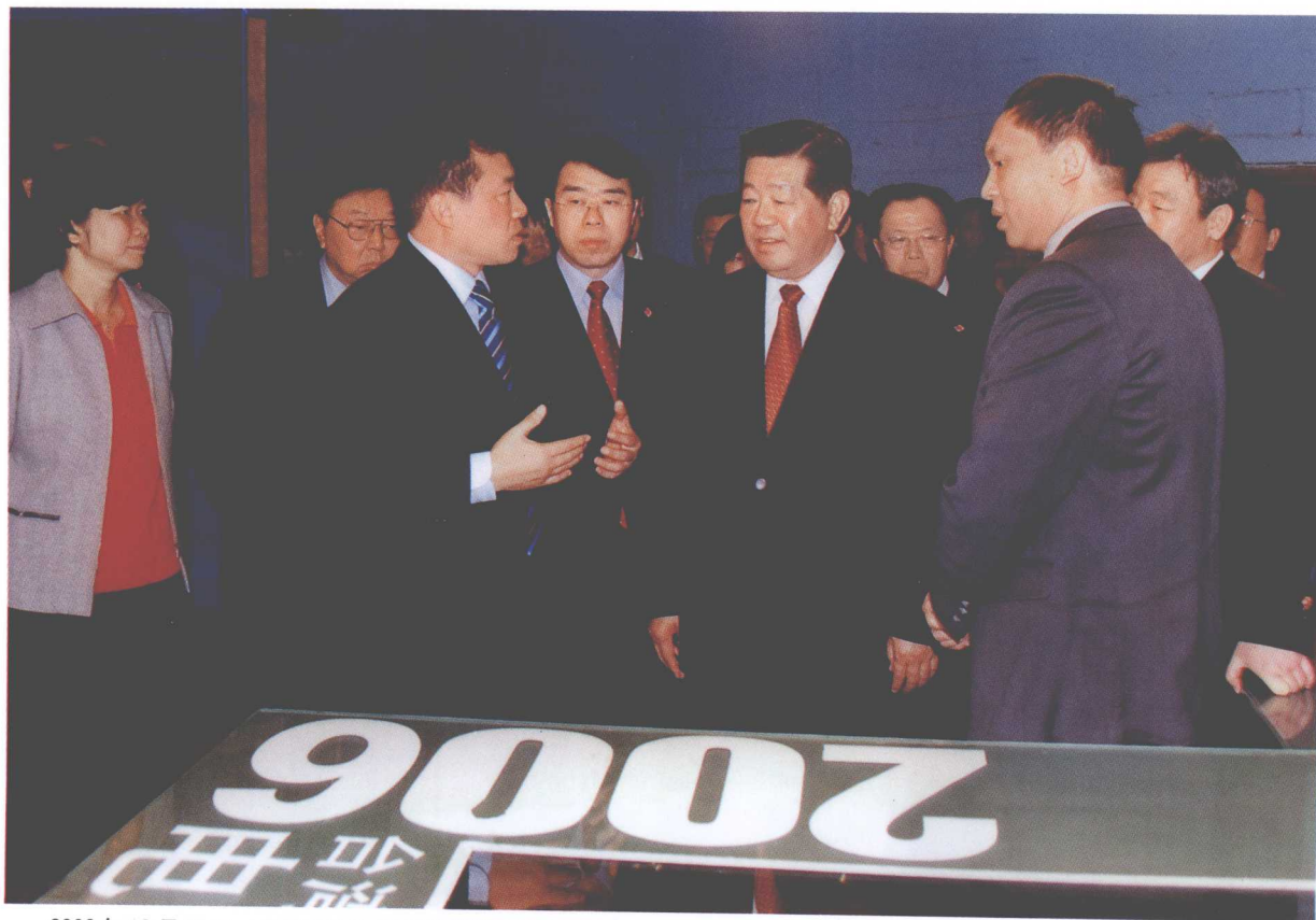
2006年12月24日，全国政协主席贾庆林视察厦门广播电视集团。