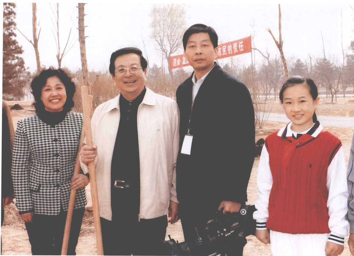
2006年4月1日，国家副主席曾庆红参加北京市义务植树活动。中央电视台记者采访。