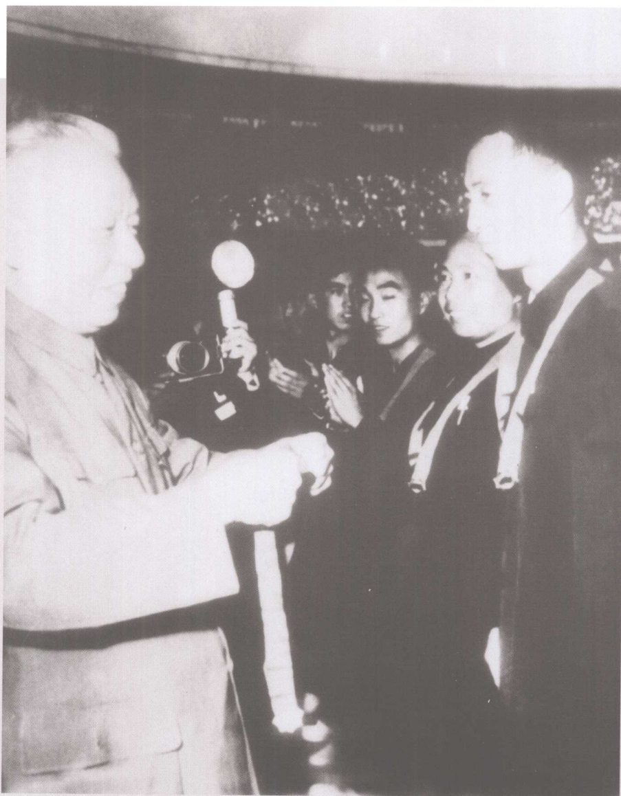
1965年，刘少奇主席在全国第二届运动会上为我校教师毛学信（右二）颁发中华人民共和国体育运动荣誉奖章。