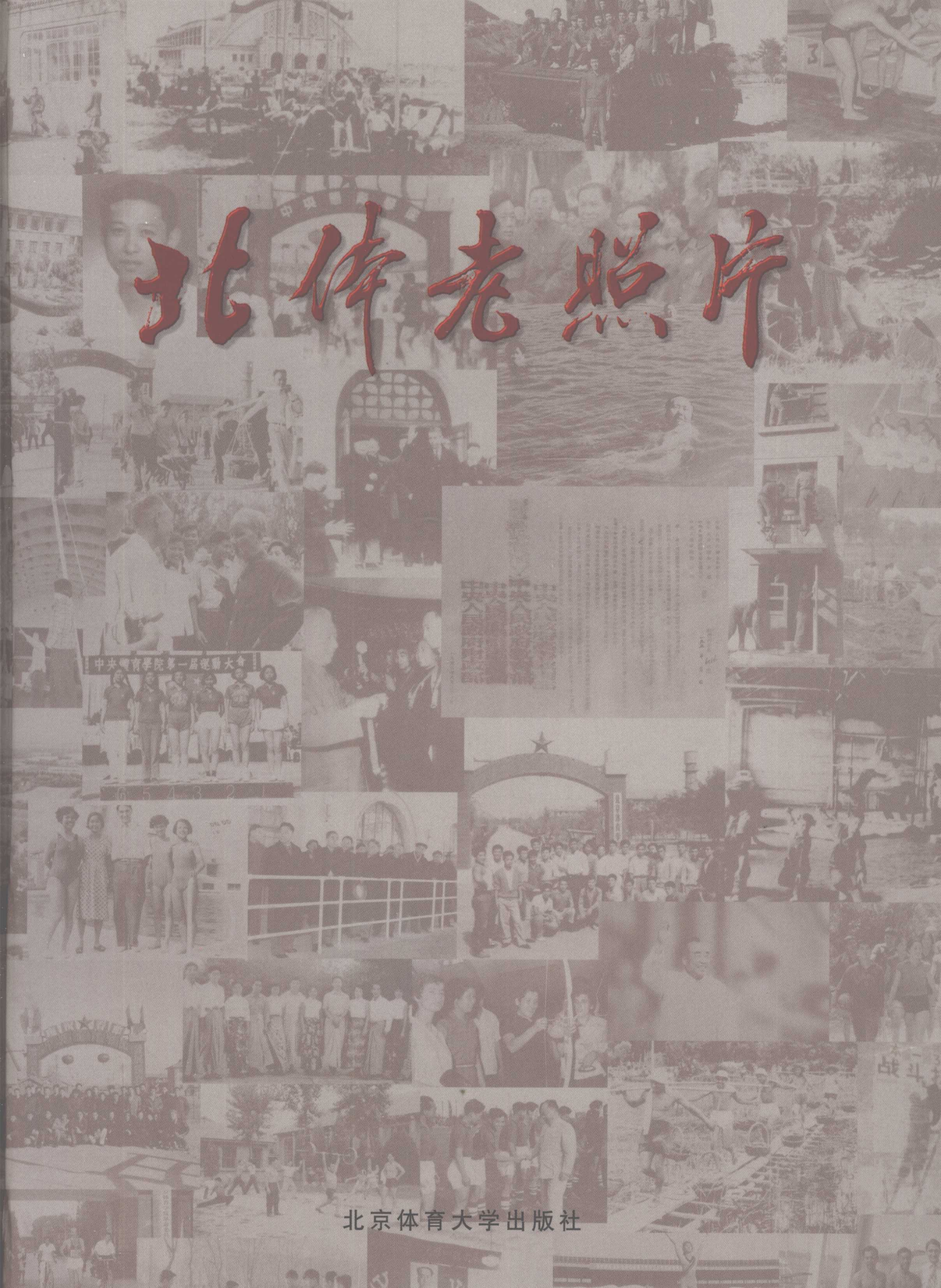
中央體育學院第一屆運動大會