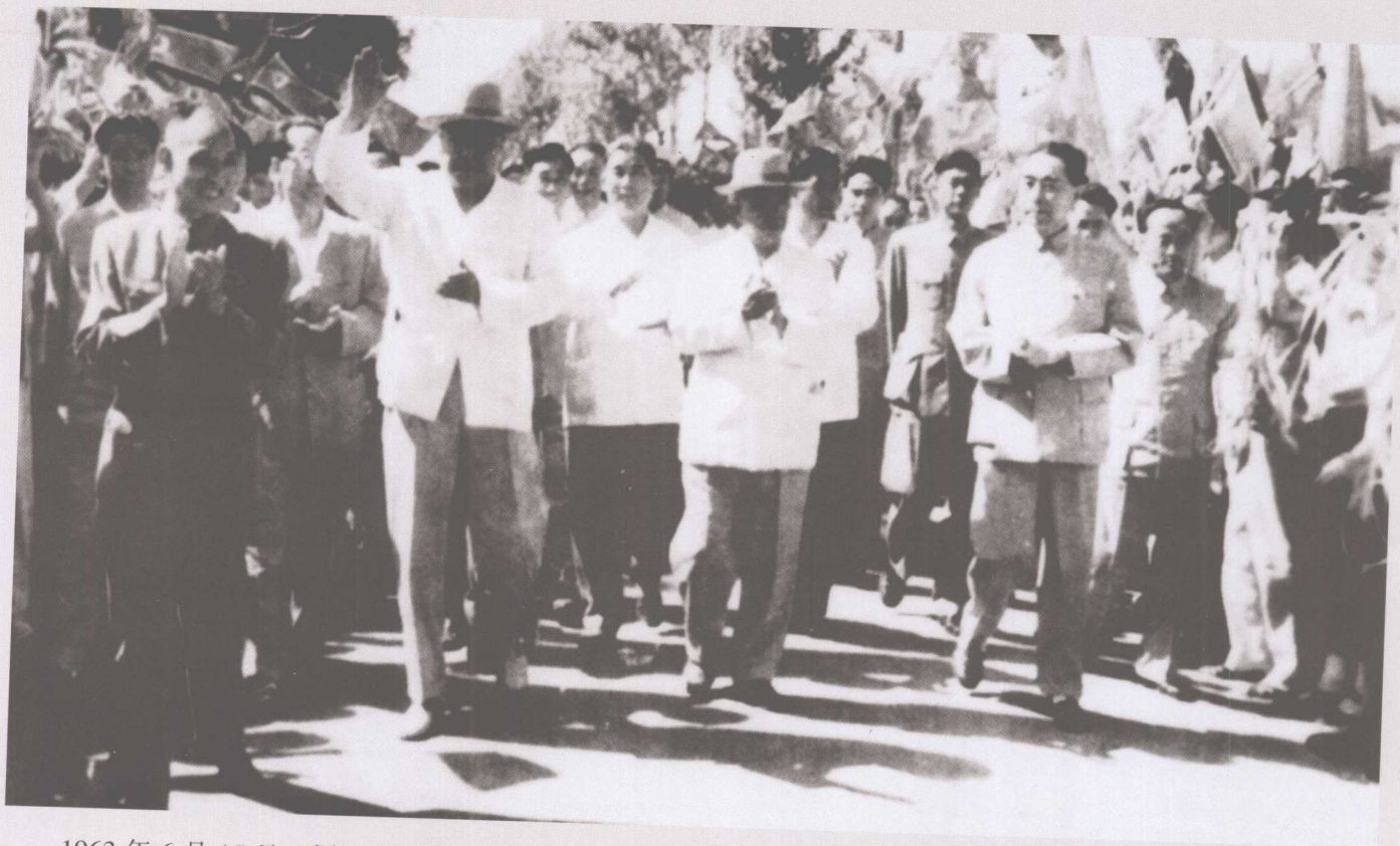
1963年6月15日，周恩來總理陪同朝鮮民主主義人民共和國最高人民會議常任委員會委員長崔庸健（左二）來我校參觀，鐘師統院長（左一）陪同參觀。