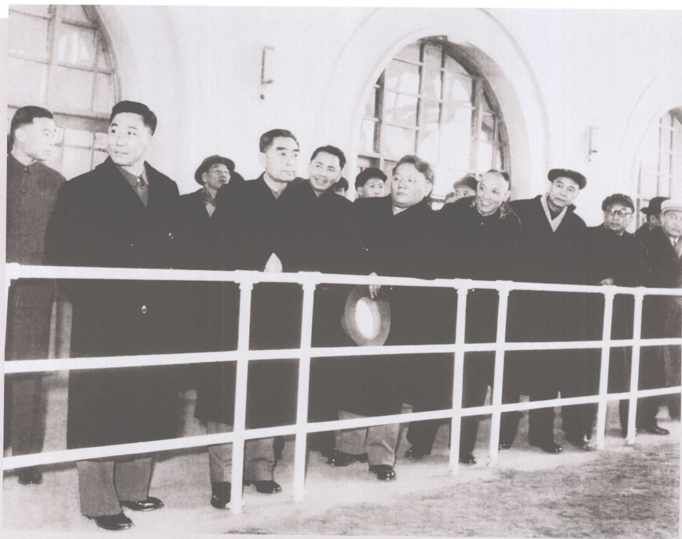
1962年12月27日，周恩来总理陪同蒙古人民共和国主席泽登巴尔（右五）来我校参观，国家体委副主任荣高棠（左二）、钟师统院长（右四）陪同参观。