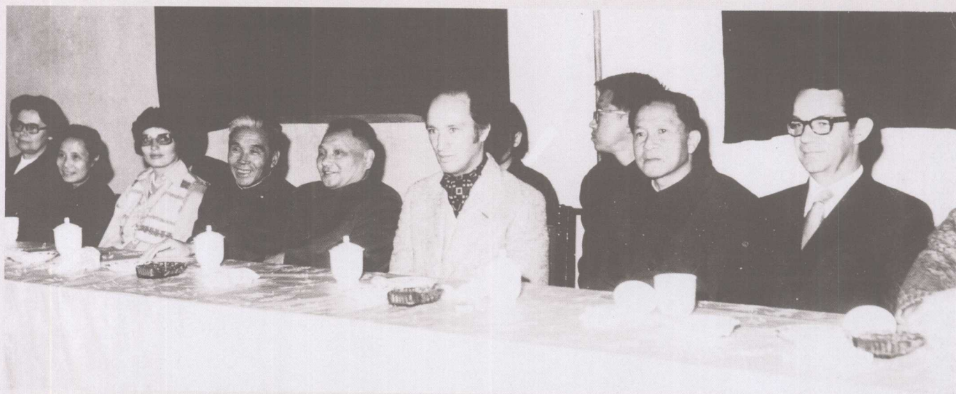
1973年，邓小平同志陪同加拿大总理特鲁多（前排右三），兴致盎然地观看我校学生的体育表演，副院长赵斌（前排右二）、副书记李东敏（前排右五）陪同参观。