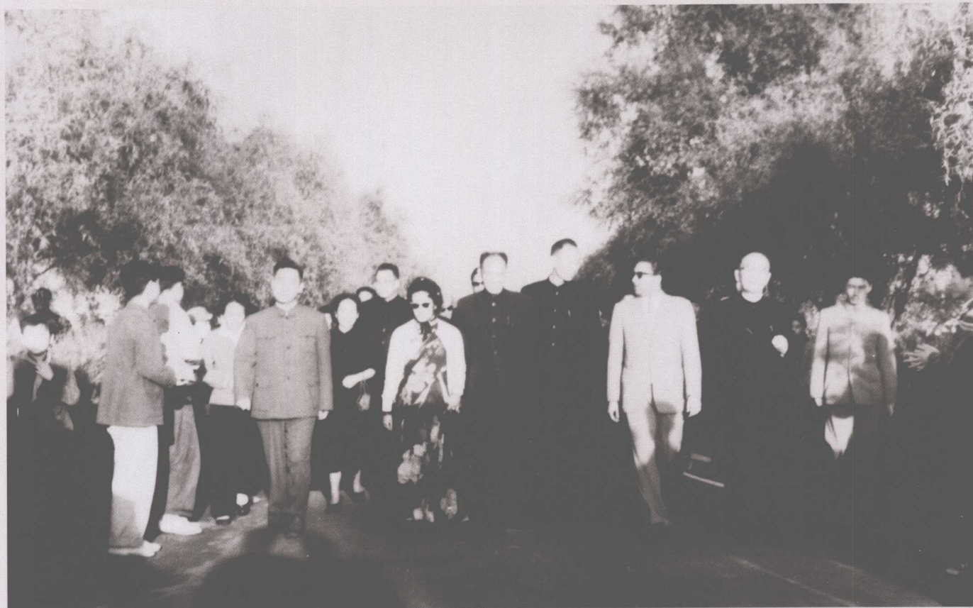
1961年10月4日，全国人大副委员长郭沫若（前排右一），陪同尼泊尔国王马亨德拉（前排右二）及王后（前排右五）来我校参观，国家体委副主任荣高棠（前排右六），钟师统院长（前排右四）陪同参观。