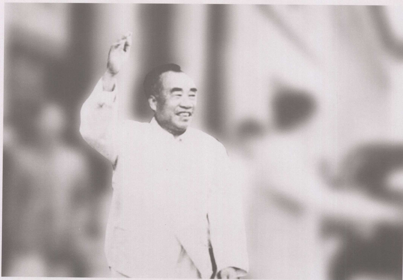
1955年10月17日，朱德副主席到我校视察，并作出指示：体育学院是个特殊性质的学院，必须提高学生的质量，尤其是身体条件要求要严。