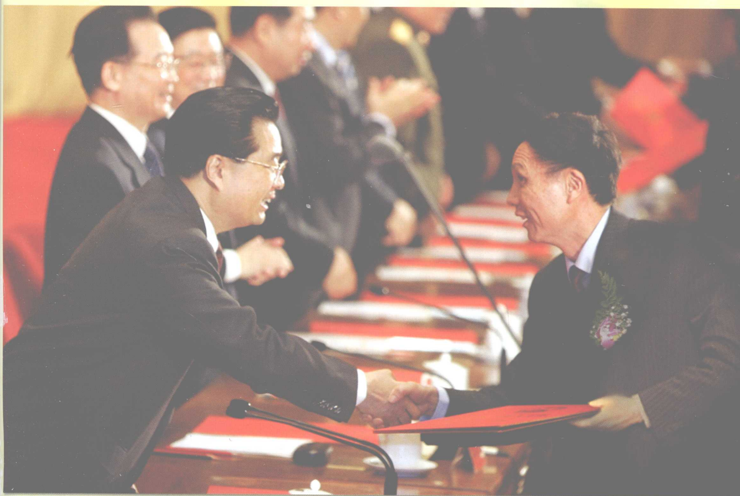
2005年3月28日，在北京人民大会堂举行的2004年度国家科技奖励大会上，胡锦涛总书记给中南大学校长黄伯云院士颁发国家技术发明一等奖荣誉证书。