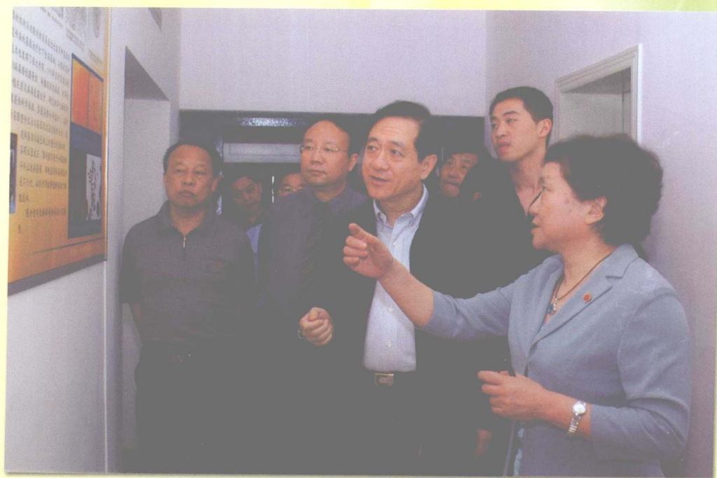
2005年5月10日，全国人大常委会副委员长、九三学社中央主席韩启德视察学校人类干细胞国家工程研究中心。