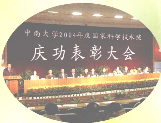
2005年3月31日，学校召开2004年度国家科学技术奖庆功表彰大会。