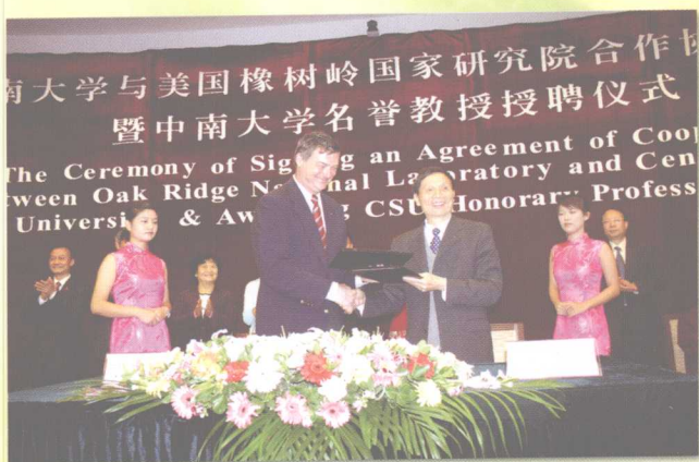
2005年11月7日，中南大学与美国橡树岭国家研究院合作协议书暨中南大学名誉教授授聘仪式在学校举行。