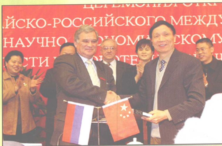
2005年1月11日，学校举行中俄（湖南）国际新材料工程技术产业化中心成立暨揭牌仪式。