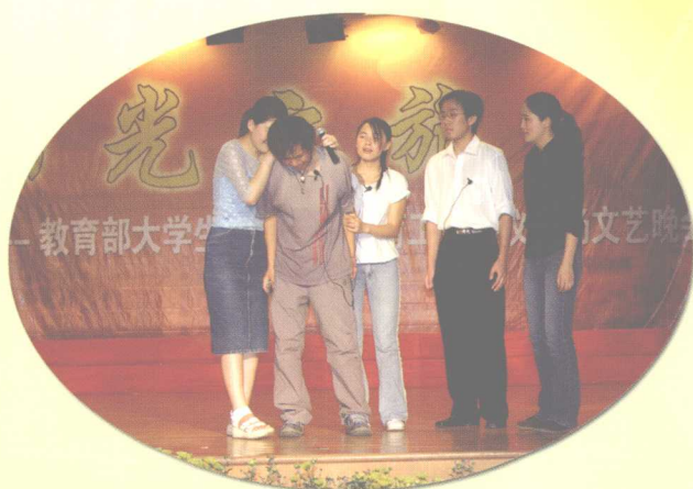
2005年4月27日，中南大学雷雨剧社荣获首届全国高校“优秀学生社团”奖。图为雷雨剧社演出的《生死拦截》剧照。