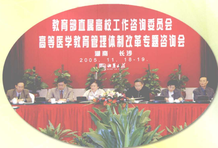
2005年11月18~19日，学校承办的教育部高等医学教育管理体制改革的专题咨询会在长沙召开。