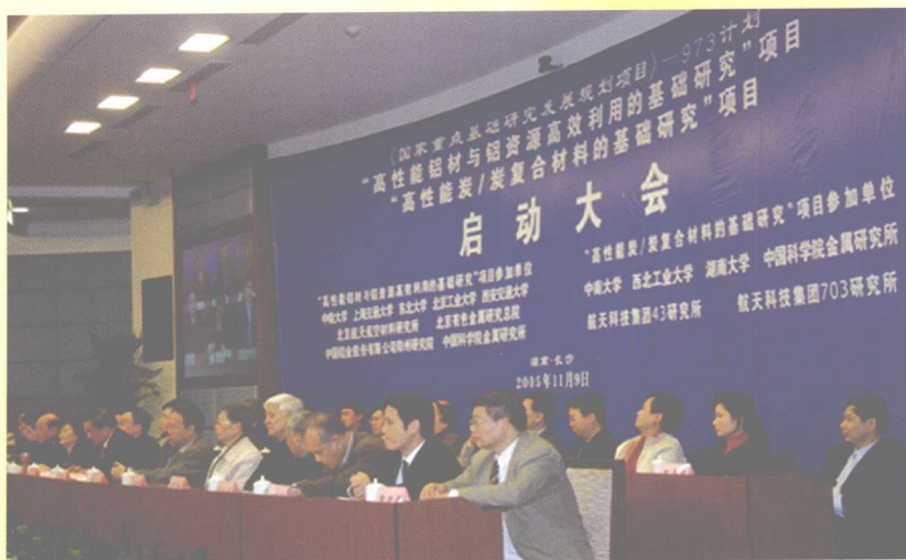
2005年11月9日，国家重点基础研究发展规划项目—973计划“高性能铝材与铝资源高效利用的基础研究”、“高性能炭/炭复合材料的基础研究”项目举行启动大会。