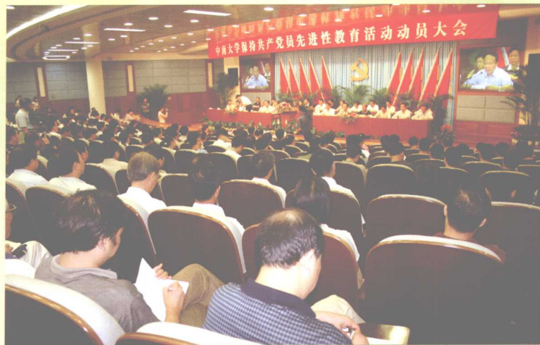
2005年7月11日，学校召开保持共产党员先进性教育活动动员大会。