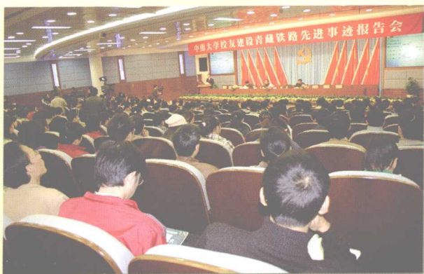
2005年11月23日，学校召开中南大学校友建设青藏铁路先进事迹报告会。