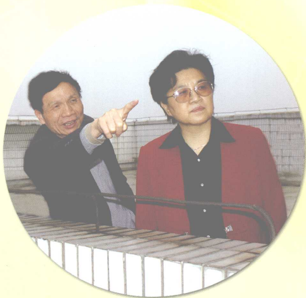
2005年3月10日，教育部党组成员、中央纪委驻教育部纪检组组长田淑兰考察中南大学。