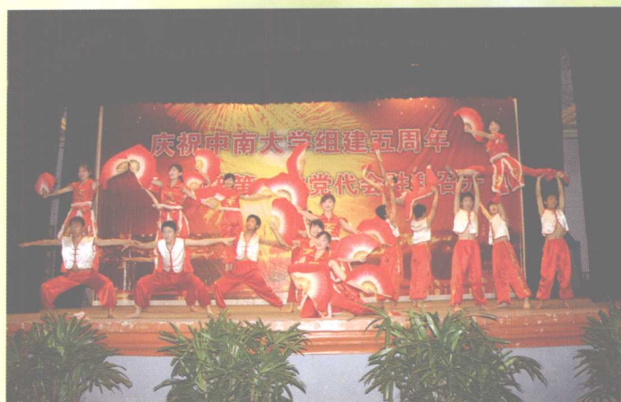
2005年4月27日，为庆祝中南大学组建五周年和迎接第一次党代会的胜利召开，学校主办“五一”文艺晚会。