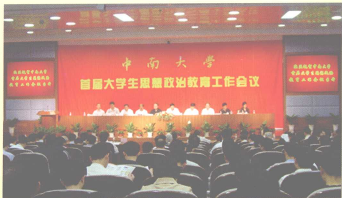
2005年4月28日，学校举办首届大学生思想政治教育工作会议。