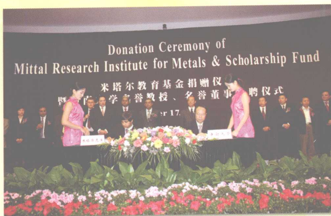
2005年10月17日，米塔尔教育基金捐赠仪式暨中南大学名誉教授、名誉董事授聘仪式在学校举行。