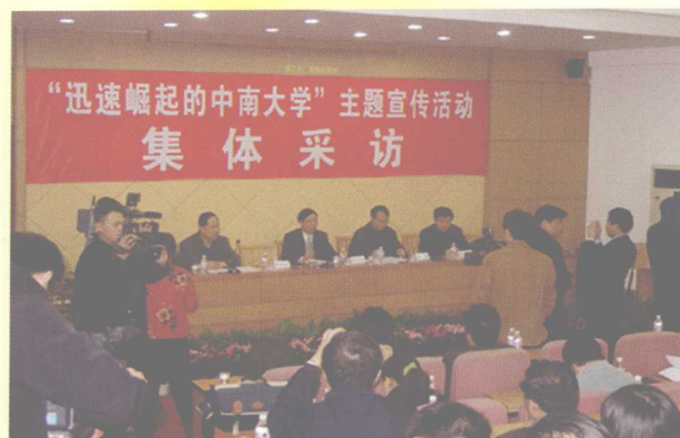
2005年3月16日，22家中央驻湘和省级新闻媒体的负责人、记者参加了在学校举行的“迅速崛起的中南大学”主题宣传集体采访活动。