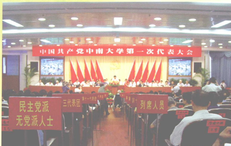
2005年5月28~29日，学校召开中国共产党中南大学第一次代表大会。