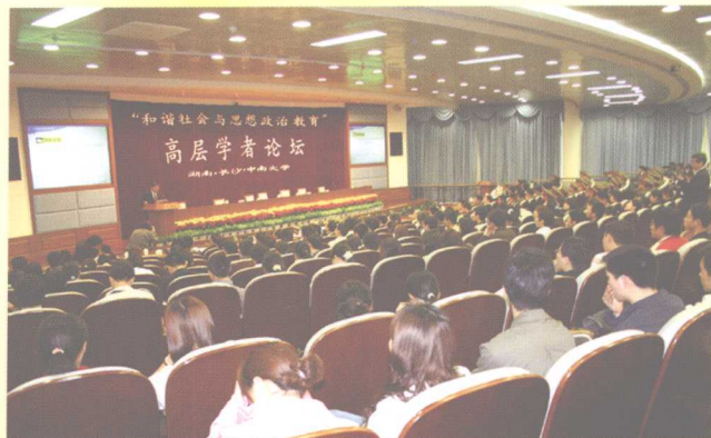
2005年3月25日，“和谐社会与思想政治教育”高层学者论坛在中南大学举行。