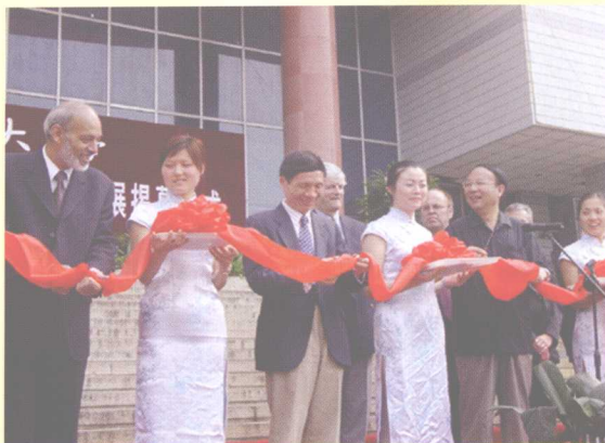
2005年5月11日，学校举行首届“优秀博士、硕士学位论文巡展”。