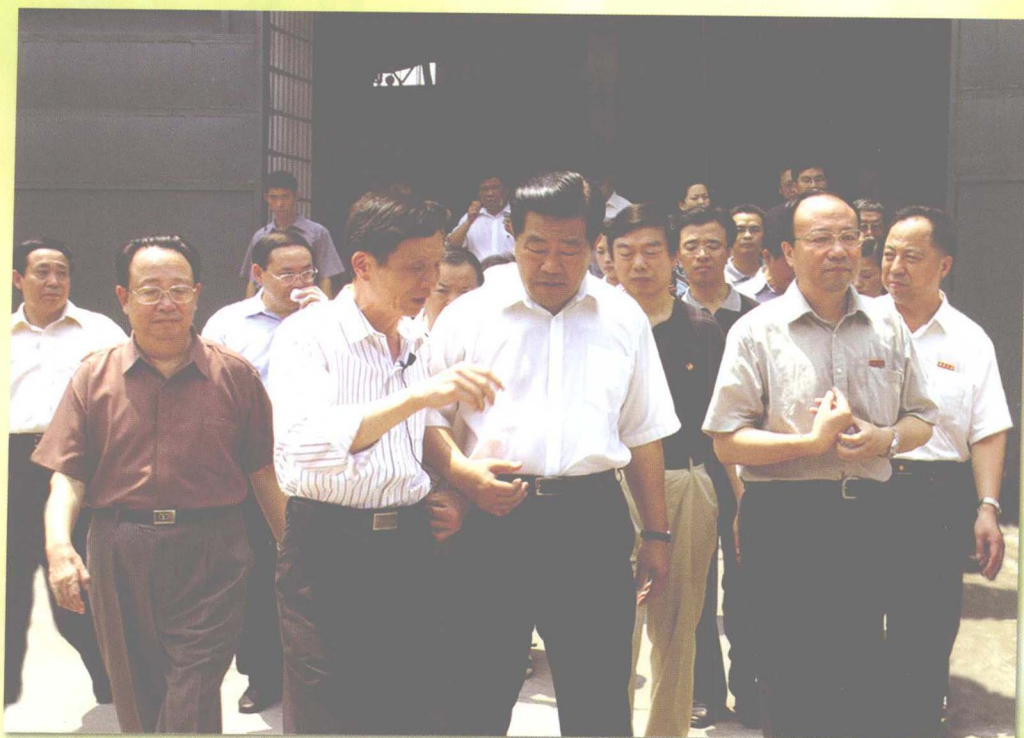
2005年7月16日，中共中央政治局常委、全国政协主席贾庆林在湖南省委书记杨正午、省长周伯华陪同下视察中南大学。