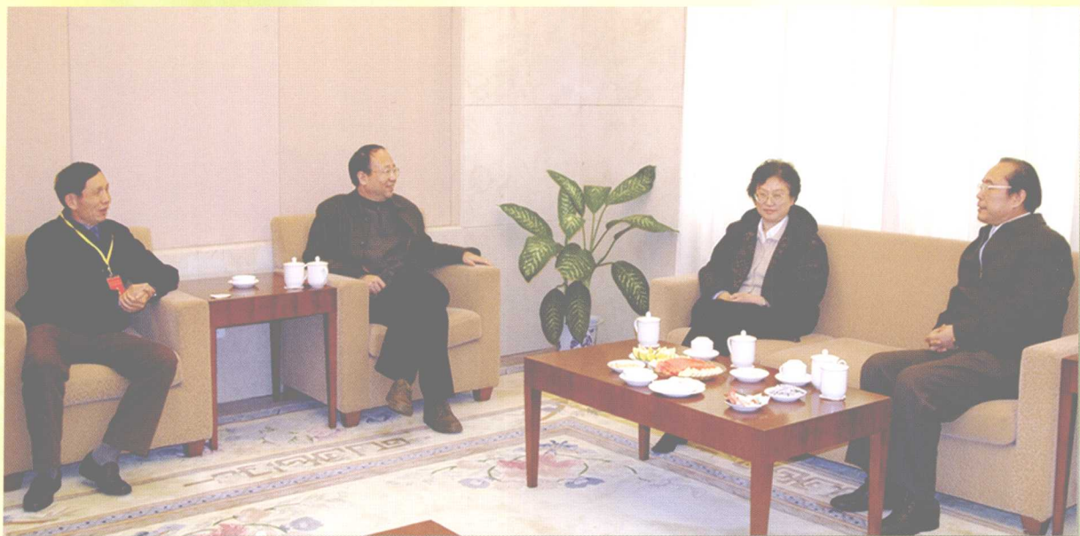
2005年11月18~19日，教育部副部长吴启迪、湖南省人民政府副省长许云昭出席学校承办的教育部高等医学教育管理体制改革专题咨询会。