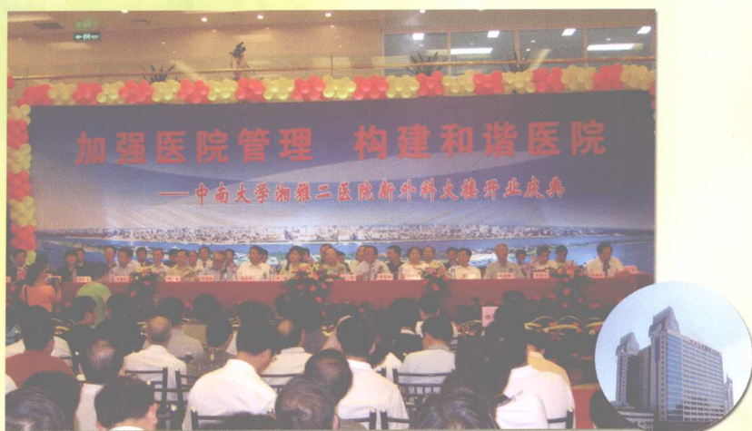
2005年8月2日，湘雅二医院举行新外科大楼开业庆典。