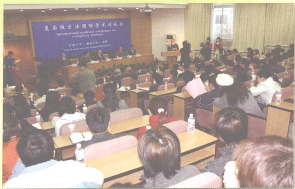
2005年3月26日，复杂性方法国际学术讨论会在中南大学召开。