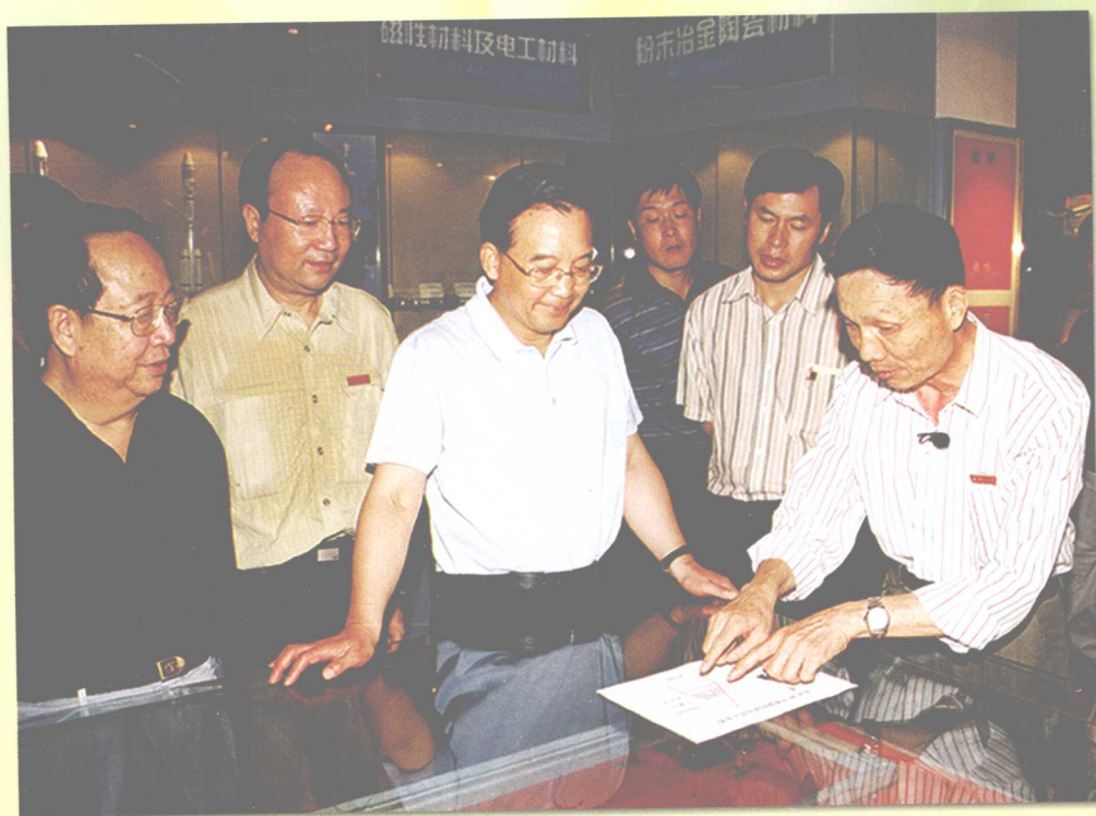
2005年8月13日，中共中央政治局常委、国务院总理温家宝在湖南省委书记杨正午陪同下视察中南大学。