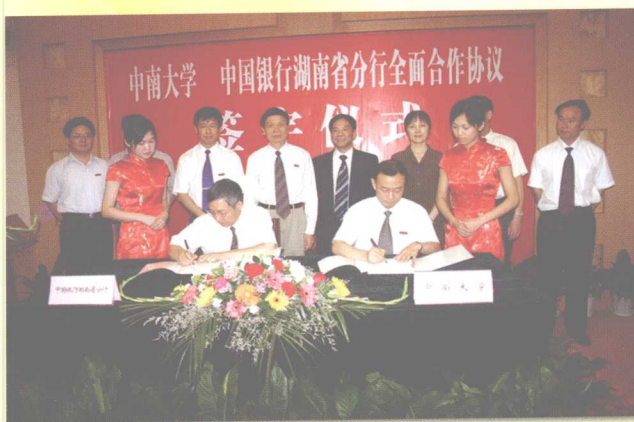
2005年6月22日，学校与中国银行湖南省分行签署全面合作协议。