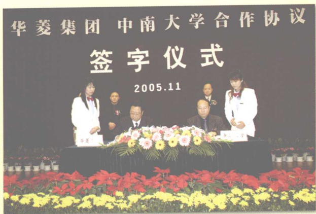
2005年11月30日，学校与华菱集团签订合作协议。