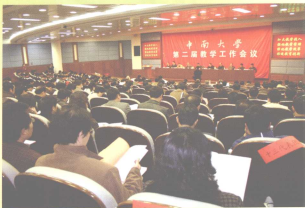
2005年3月25日，学校召开第二届教学工作会议。