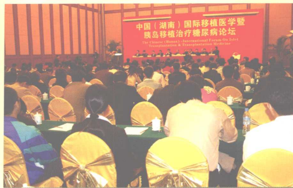
2005年10月22日~25日，由中华医学学会和中南大学湘雅三医院共同主办的中国（湖南）国际移植医学暨胰岛移植治疗糖尿病论坛在长沙举行。