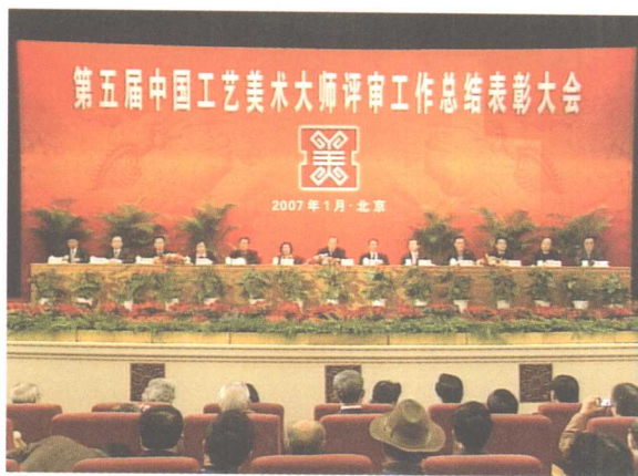
图2 第五届中国工艺美术大师评审工作总结表彰大会

第二，要精心保护，及时抢救。 目前，我国一些传统工艺美术品种和技艺面临失传，不少制作工艺品的特殊原材料和珍稀资源也有枯竭的危险。有关方面要采取积极措施，加大保护的力度。要深入民间和少数民族地区加强调研，下大力气收集和整理传统工艺美术资料，征集优秀作品，建立历史档案。要集中组织力量，抓紧抢救珍稀工艺美术品种和技艺，不能让这些宝贵的历史遗产在我们这一代手里消失掉。