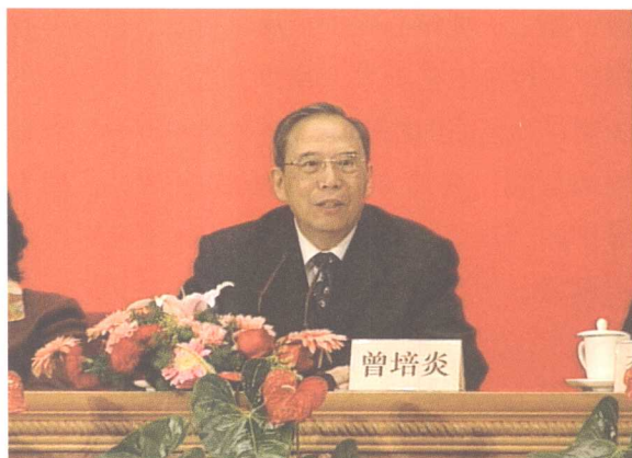
图1 曾培炎副总理在“第五届中国工艺美术大师评审工作总结表彰大会”上讲话

我国传统工艺美术植根于民间、植根于群众、植根于乡村，资源消耗和环境污染少，文化和技术含量高，吸收的劳动力较多。大力发展传统工艺美术行业，有利于培育特色产业、发展先进文化，满足人民群众不断增长的物质文化需求；有利于发展多种所有制经济，促进城乡协调发展；有利于建设资源节约型、环境友好型社会。在新形势下，保护和发