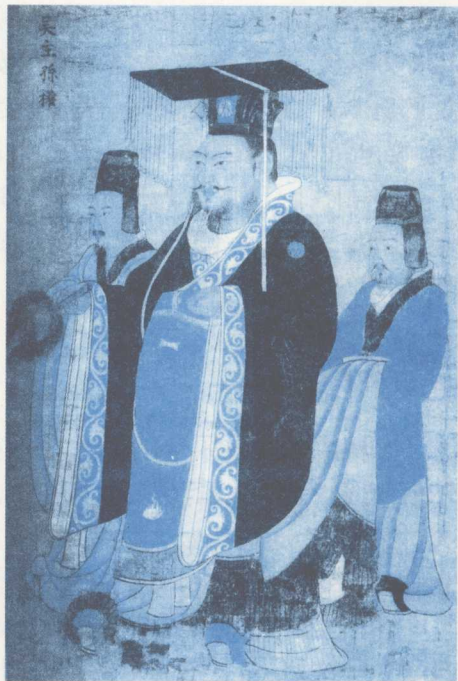
吴国一代明主孙权。可惜他开创的基业被他的不肖子孙孙皓败亡。

当伐吴的一切都准备就绪时，上天似乎照顾晋朝，又给了它难得的机遇。吴国在孙皓荒淫残暴的统治下，已民怨沸腾，危机四伏。恰巧在274年，吴军主帅陆抗病死，孙吴荆州前线失去了惟一能与羊祜抗衡的军事家。