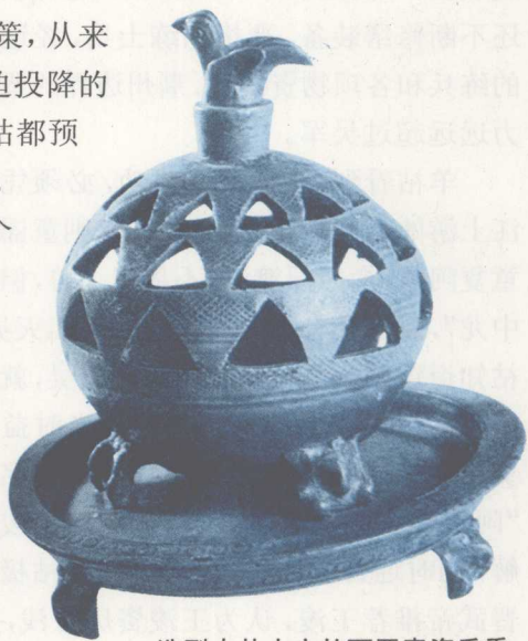
造型古朴大方的西晋青瓷香熏

当时吴军这边负责镇守荆州的是大将军陆抗。对于羊祜的这些做法，陆抗心中很清楚，知道羊祜在收买人心，以德服人，心中十分敬佩，所以陆抗经常告诫将士们说：“羊祜对我们以诚相待，如果我们以恶相还，仗没有开始打，我们在气势上就先输了，所以我们只要守好边界就行了，不要贪图小便宜去骚扰晋军。”