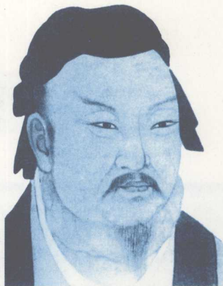
西晋著名军事家、政治家、学者杜预

太康元年(280)，当东吴守军在抵抗其他晋军时，王浚率领的巴蜀水军趁虚而入，轻易攻取了建邺(即建康，江苏南京)。吴主孙皓手忙脚乱，无奈把自己绑了，抬着棺材到王浚军前投降，吴国灭亡。东汉末以来90多年的割据混战局面就此结束。