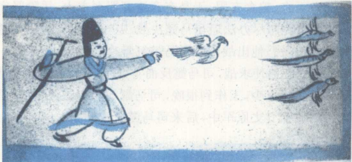
放猎，魏晋时期的墓画像砖。

首《潜龙诗》，以抒发心中的愤慨。诗的大意是：可怜的黄龙呀，被困在了井中，不能到大海里自由自在地翻腾，竟然连泥鳅小鱼也敢来欺负你，在你面前逞能。可怜的黄龙呀，我目前的处境与你何其相似！