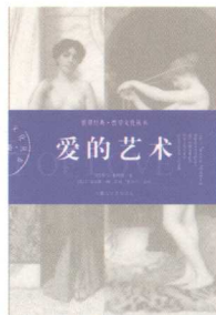
爱的艺术 THE ART OF LOVE