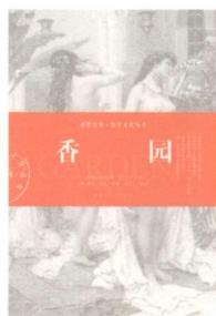
香园 THE PERFUMED GARDEN