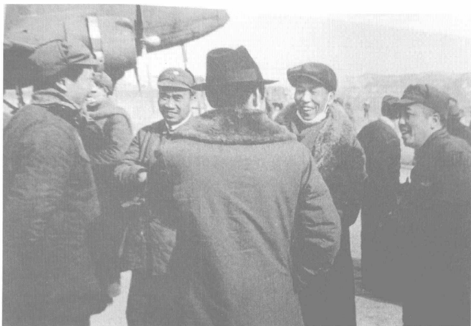
1946年1月，彭德怀陪同毛泽东、刘少奇、朱德等到延安机场迎接从重庆归来的周恩来。