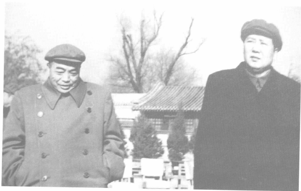
1954年,毛泽东与彭德怀在中南海怀仁堂后草坪。