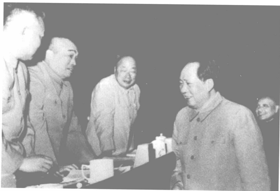
1958年5月5日至23日，中国共产党第八次全国代表大会第二次会议在北京举行。会上，毛泽东同彭德怀等交谈。