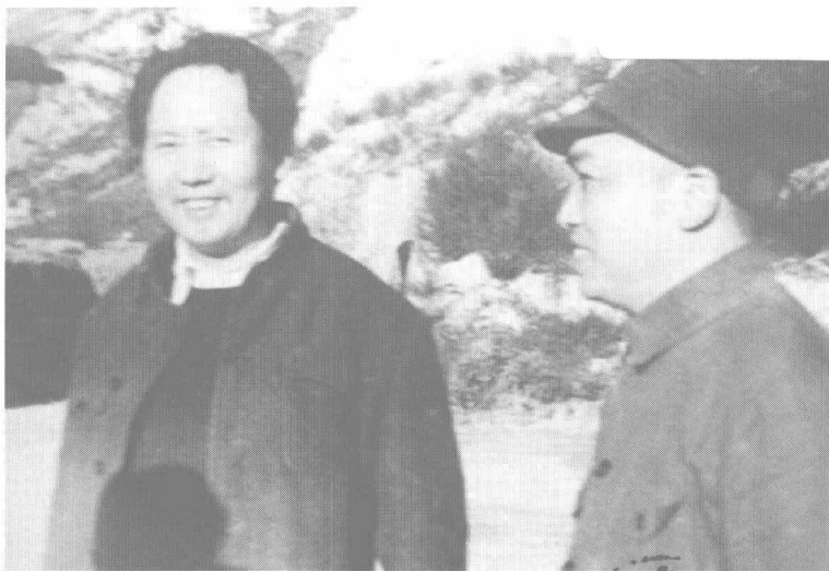
毛泽东与彭德怀在延安