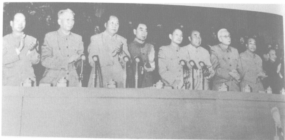
1956年9月27日，毛泽东等在党的第八次全国代表大会闭幕式上。左起：彭真、刘少奇、毛泽东、周恩来、陈云、朱德、林伯渠、彭德怀、邓小平。