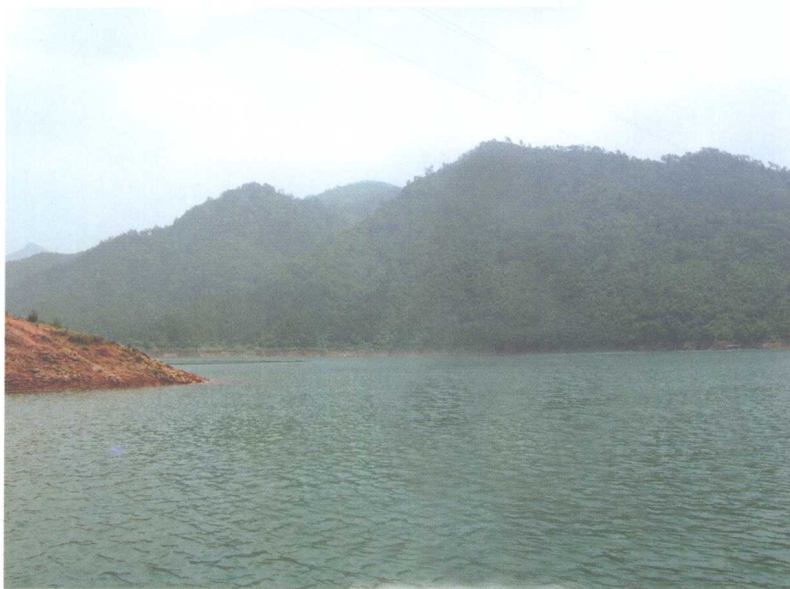
▲ 青山绿水 风生水起