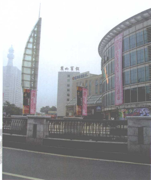
前有路冲 大刀化煞