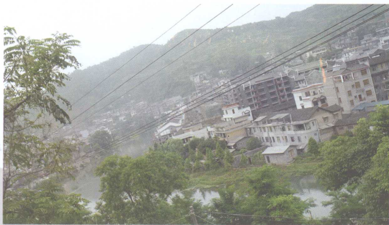
▼ 来龙去脉 弯环有情