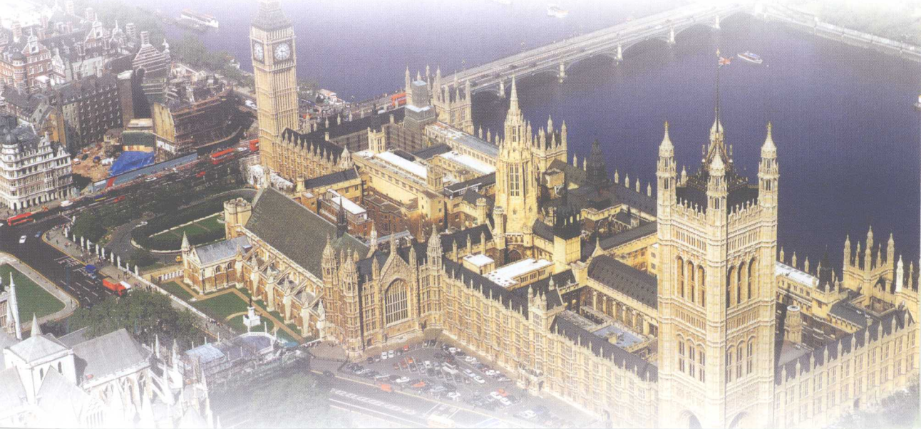
威斯敏斯特宫鸟瞰

伦敦塔桥是泰晤士河上最壮丽的一景。建于1894年的桥身由4座塔形建筑连接而得名，