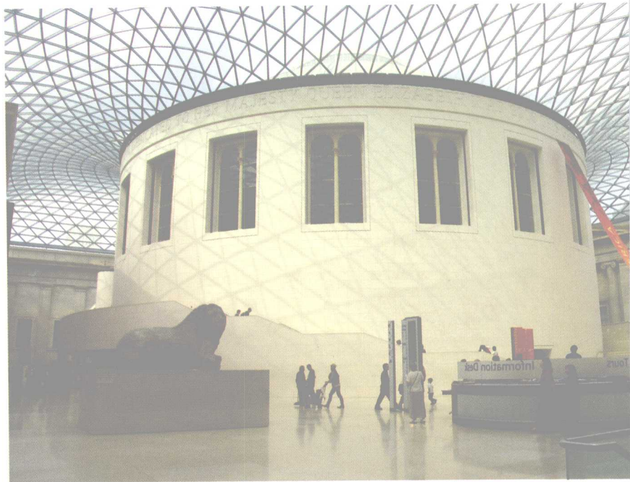
大英博物馆共享大厅（伦敦）