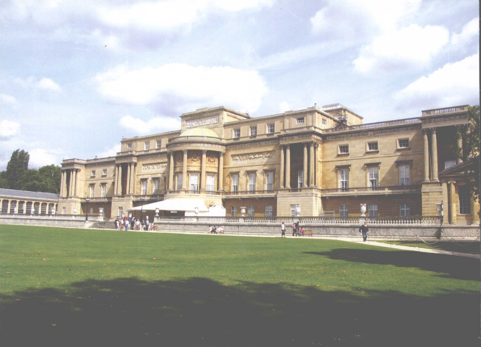
占地16公顷的白金汉宫御花园（伦敦）