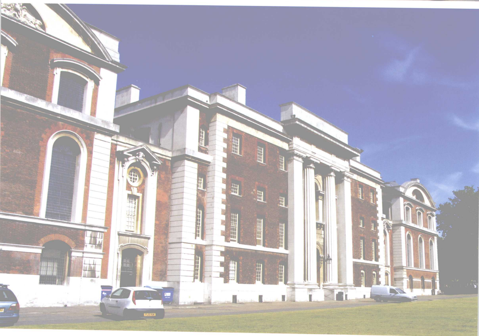
格林威治大学（伦敦）

格林威治大学的这栋建筑是英国新古典主义时期的建筑。新古典主义主要是要再现古希腊与古罗马建筑的庄重、宏伟的原始民主思想，所以新古典主义的核心思想是要再现古代文明简洁的几何构图，突出数的比例、和谐与构图的完整。该建筑原来是王宫，称为格林威治建筑群。