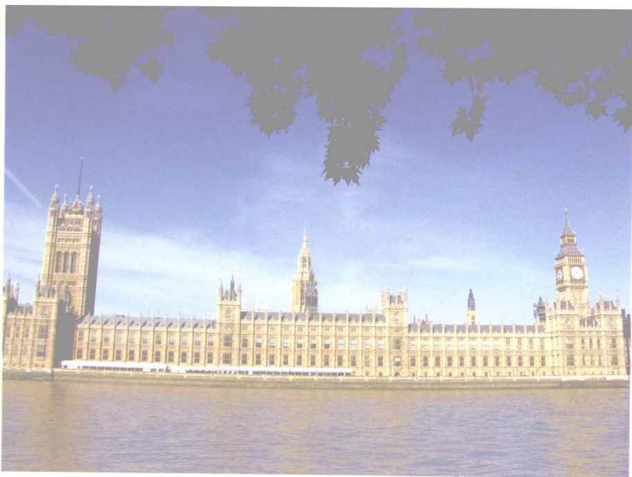
议会大厦、大笨钟（伦敦）

议会大厦包括多个部分，其所在地以前是英国君主在伦敦的一个古老王宫——威斯敏斯特王宫。1834年，王宫在大火中焚毁。大火之后，由当时著名的建筑师查尔斯·巴里设计了新的议会大厦，大厦的建造工作是在1840~1850年间进行的。大厦共占地8英亩，拥有11个庭院和1100间房间，以及2英里长的走廊通道。大厦是英国维多利亚时期的哥特式建筑，具有纯正的哥特建筑语汇，并将这些语汇完美地组合在英国垂直哥特式的立面构图之中。大厦外墙装饰丰富华丽，尖塔林立，加上所用的材料是暗黄色的砂岩，往往令人觉得这是非常古老的建筑。