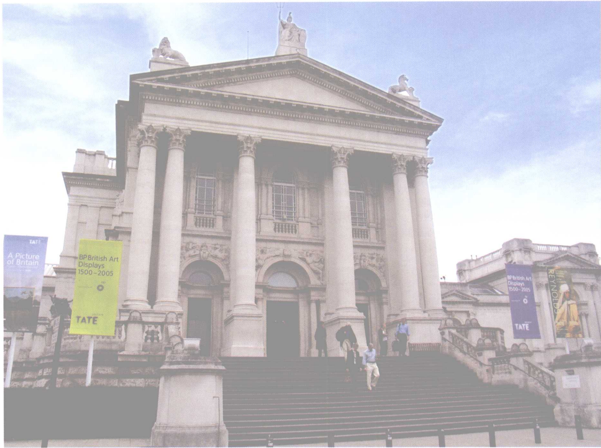
不列颠泰特画廊（伦敦）

不列颠泰特画廊是希腊复兴建筑，高高的台阶是一种空间序列的处理手法，将建筑建在高台阶以上，形成了建筑立面的宏伟气势，与帕提农神庙的处理手法十分相似。