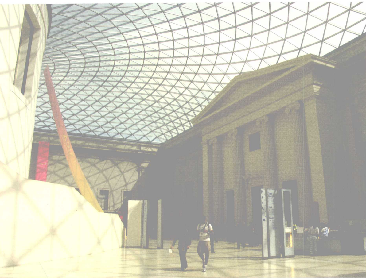
大英博物馆共享大厅（伦敦）

共享大厅使大英博物馆的公共空间不仅更宽敞、明亮，还具备了连接各个展览空间的功能，让整个参观的动态路线更为流畅。