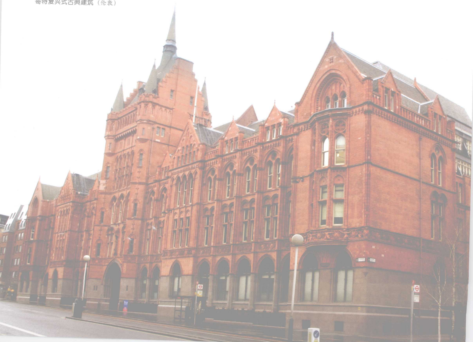
哥特复兴式古典建筑（伦敦）

该建筑也是罗马复兴建筑，产生于集仿主义时代的理念。虽说是1971年完工，但完全是一种对古代建筑的怀念。