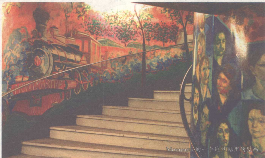
Monmartre的一个地铁站里的壁画