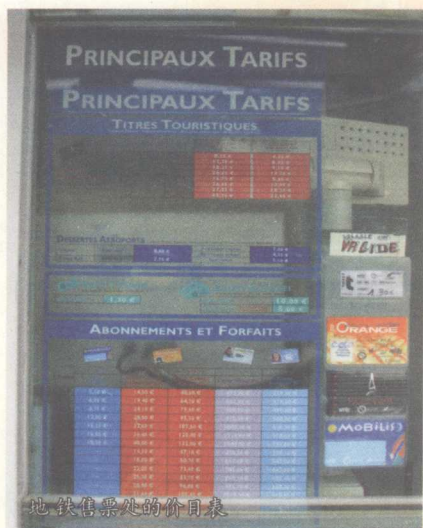
地铁售票处的价目表

巴黎地铁、RER和公共汽车都使用同一种车票，依距离远近和使用时间长短，票价不同。整个巴黎从中心向四周按不同的圈（Zone）划分，总共有8圈，大部分旅游景点都集中在1~2圈内，但迪斯尼乐园、凡尔赛