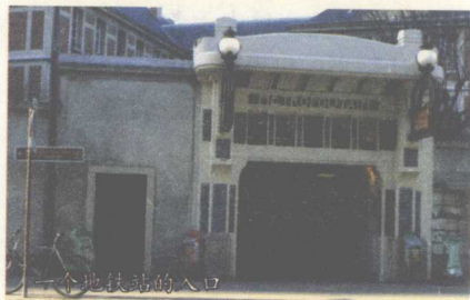
一个地铁站的入口

到了巴黎，你可能不坐公共汽车，也不打车，但是不太可能不坐地铁。地铁是这个城市的骄傲，每隔500米就有一个地铁站，几乎可以把你带到这个城市的每个角落。地铁的标志是一个黄颜色的巨大的“M”（法文Metro的第一个字母），或者是新艺术风格的红色标志“METRO”。