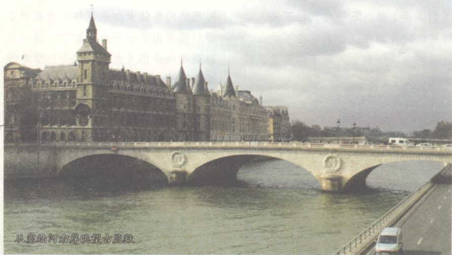
从塞纳河右岸眺望卢浮宫

巴黎全年平均温度12℃，1月平均气温3℃，7月19℃。但是冬天气温偶尔会降到零下，夏天有时会超过30℃，常有阵雨。春、秋是最美丽的季节，可以拍到非常漂亮的照片，享受舒适的天气和迷人风景，但时间很短。冬天颜色比较灰暗，圣诞持续到1月底，是全国商店大减价时间（另一个大减价的时间是6月20日到7月底），宾馆也稍便宜，不过我觉得冬天在巴黎的街上走还是有点冷。8月份巴黎人很多去南方和国外度假，城里有的店铺和餐馆关门，可能生活会不太方便，不过整个城市比平时安静，可以更好地领略“花都”。