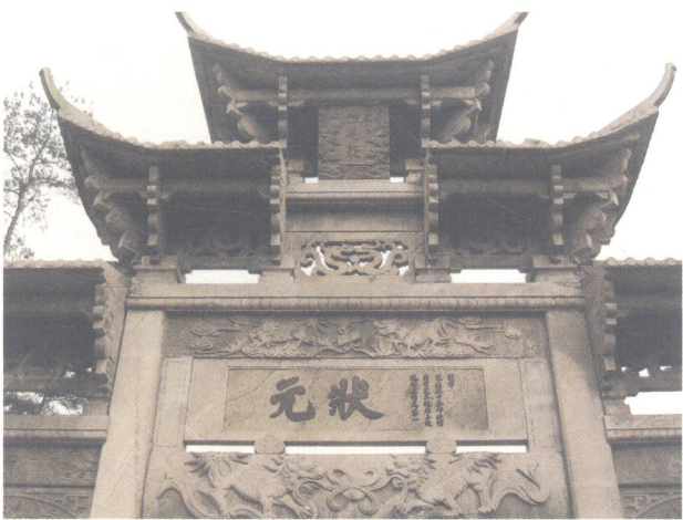
浙江省龙游县鸡鸣山状元牌楼局部

最下者方令读书。” ① 到了清末，每况愈下，以致太谷风气“视读书甚轻，视商业为甚重，才华秀美之子弟，率皆出门为商，而读者寥寥无几，甚且有既游庠序竟弃儒就商者。亦谓读书之士，多受饥寒，曷若为商之多得银钱，俾家道之丰裕也。” ② 竟至于出现应考的童生不足定额的现象。江西乐安县流坑村董氏，宋代出了二十六个进士，甚