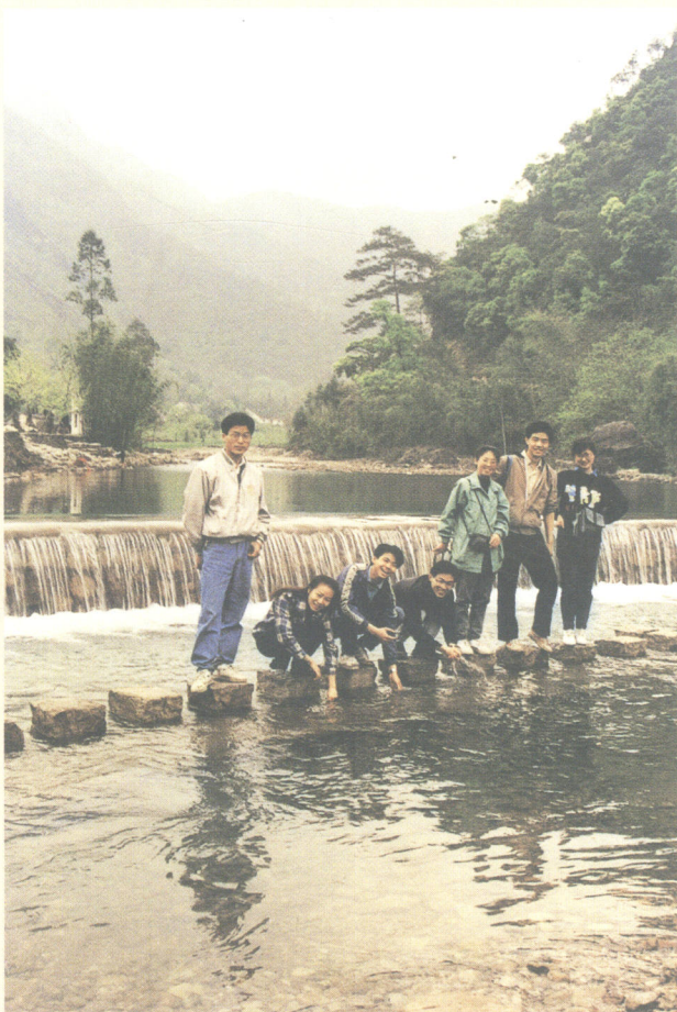
在楠溪江鹤阳村调研期间（1991年春浙江省永嘉县）

大样图上也有不用比例尺的。另外，由于制图时无法预知出版时的条件，在线条的粗细上也难以保持统一，所有这些都可能导致测绘图在印刷上有些不够完美。