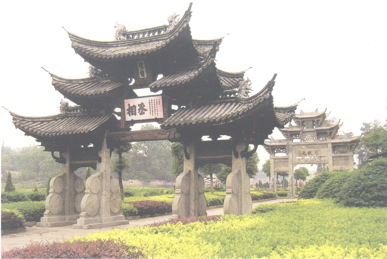
浙江省龙游县鸡鸣山丞相牌楼