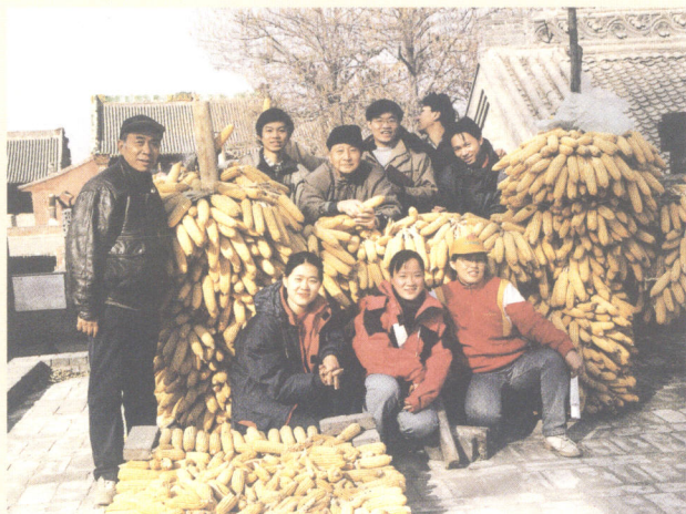
秋收时节在张壁村（山西省介休县）

食堂里吃饭，晚饭很早，学生们贪恋工作，回来的时候食堂已经没有什么吃的了，甚至还要央求炊事员重新打开门锁，用剩菜冷饭凑合。我们看在眼里，很心疼，但也无可奈何。