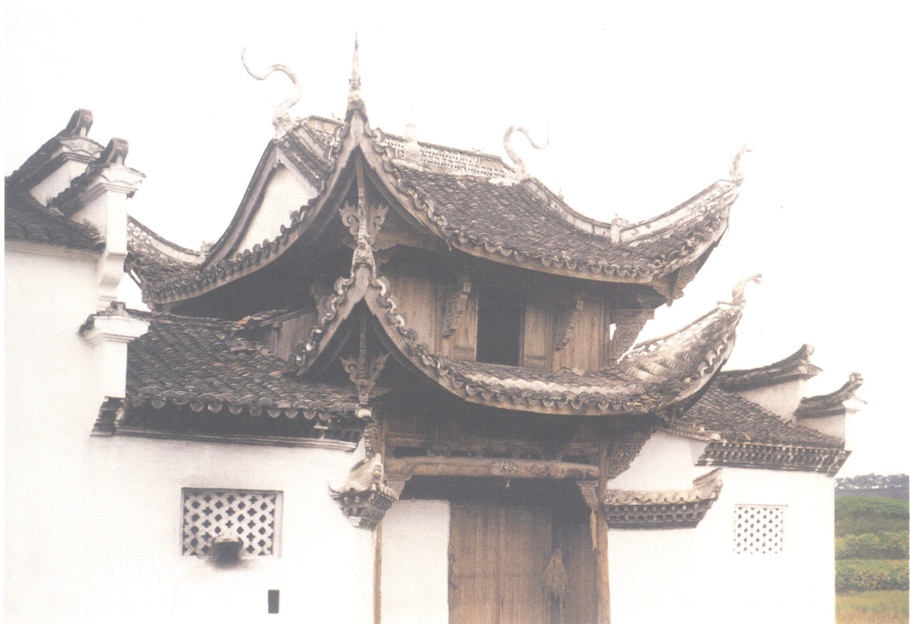
浙江省建德市上吴方村文昌阁门头

文教建筑多的地方，就是科举成绩比较突出的地方，所谓文风鼎盛之乡，领头的是苏南、浙北，后面有江西、福建，再次是皖南、广东、两湖。这些地区，一来是经济发达，经济既是科学成就的背后支柱，也是文教建筑得以普及的依靠；二来是宗族结构和制度稳固有力。科举虽然主要是朝廷的取士制度，而且明代以后，措施十分完备，同时科举也是平民百姓进仕的制度，为了扶掖和激励本族子弟读书以登上青云之路，宗族用公产兴学、助读、承担赴考的全部费用，高低中了个功名，就给予很高的荣誉和实际的奖励。是宗族接续和完成了科举制度，助它普及并产生巨大的影响。乡土社会中的文教建筑，绝大部分是宗族兴建的。凡宗族结构破坏的地方，科举成就便很差，文教建筑也就寥寥了。