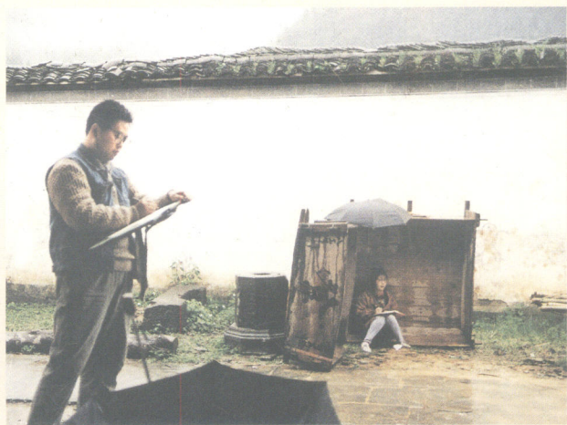
雨天躲在稻桶里画测稿（1994年春江西省婺源县）

也有几次在仲夏季节下乡，那时也会有困难。浙江省永嘉县的村子，有一些被溪流阻隔，平日要踏着钉步过去或者用竹筏过河。一次暴雨之后，山洪猛涨，急流汹涌，我们的学生们不肯耽误工作，就几个人手拉手，慢慢踏着溪底滚动的卵石蹚过水去。雪白的水花缠在他们的下腰，水珠扑满全身，真是惊心动魄。在暴雨下测绘也很不容易，画测稿就怕雨淋。遇