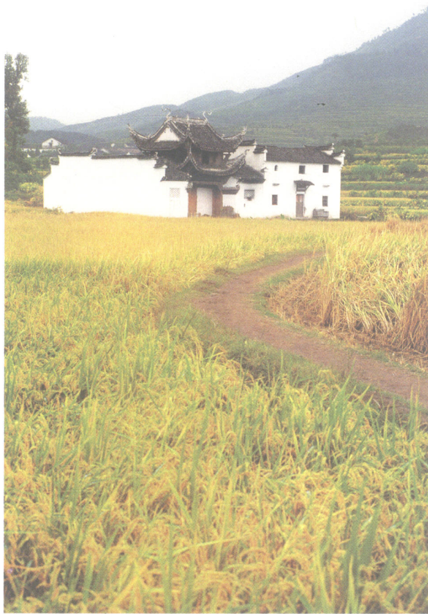
浙江省建德市上吴方村文昌阁

中国人热爱读书。无分南北，也无分城乡，稍稍整齐一点的人家，大门上最常见的一副对联是“忠厚传家久，诗书继世长”，堂屋里最常见的一副对联则是“数百年旧家无非积德，第一等好事还是读书”，条案中央常常供着一块朱漆描金的神牌，上面写的是“天地君亲师”，香火四季不断。撇开天地不论，现实世界上，“师”仅居“君”、“亲”之后，地位很高了，他是读书的引路人。