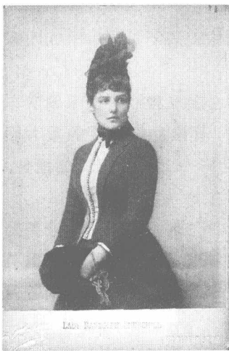
丘吉尔的母亲詹妮·杰罗姆

由于子女众多，家庭负担沉重，窘迫的经济状况使他养成了拘谨的性格。1849年，马尔巴罗公爵七世生下了第三个儿子伦道夫·丘吉尔。伦道夫聪明机敏，很受父亲宠爱，但按照英国法律，马尔巴罗公爵的爵位和领地是世袭的，只能由长子乔治·丘吉尔继承。伦道夫不能继承公爵，只能称为勋爵，这反而使他摆脱了不少贵族规矩的束缚。从牛津大学毕业之后，在一次舞会上，伦道夫认识了漂亮的美国姑娘詹妮，两人一见钟情，很快便决定结婚。