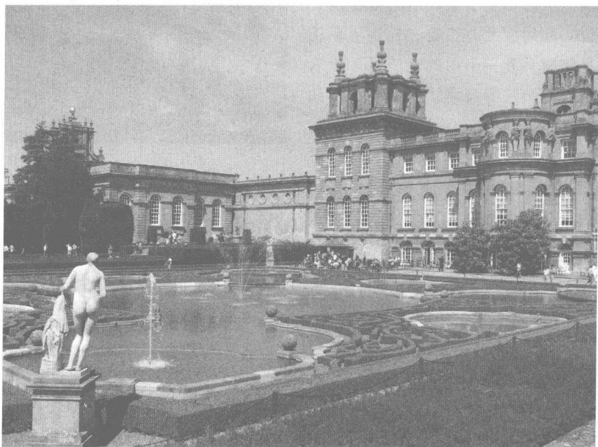
牛津郊外的丘吉尔庄园

历史的车轮滚滚向前，无法阻挡，资产阶级登上历史的舞台是必然的事情。1649年，保皇派战斗失败，资产阶级革命取得胜利，英王查理一世也被克伦威尔控制下的国会判处死刑。丘吉尔上尉身为失败一方的保皇派军官，无奈地回到家乡。作为失败方军官的惩罚，他被迫缴付446英镑8先令罚款。这在当时可以说是一笔巨款，温斯顿·丘吉尔因此倾家荡产，只好跟着妻子住进了德雷克庄园。然而，温斯顿·丘吉尔并没有灰心。他默默研究英国皇家历史，期待着君主制复辟的那一天。