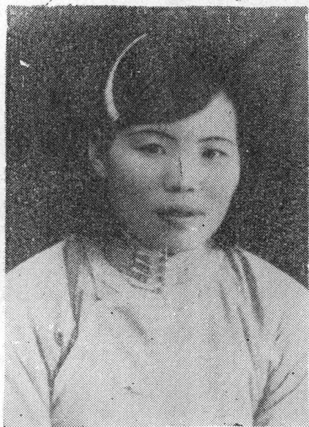
徐林侠烈士 (摄于1937年)