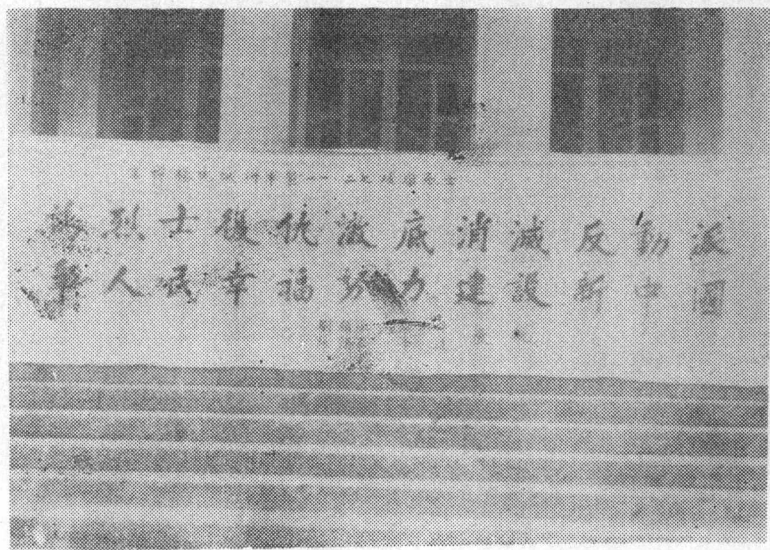
解放后领导同志的挽联