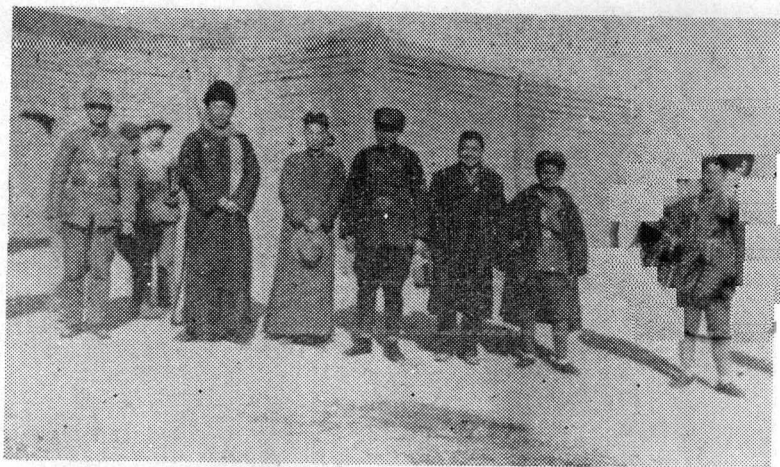
宋绮云受杨虎城将军的委托去咸阳对红十五军团进行慰问时的合影。右起第三人为宋绮云，第四人为徐海东将军。