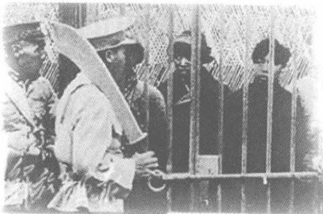
◆ 四一二反革命政变

四一二反革命政变前后，四川、江苏、浙江、安徽、福建、广西、广东等省也相继发生反共“清党”事件，共产党人和革命人士遭到血腥屠杀。张作霖也在北京公开镇压革命者，李大钊等20人惨遭杀害。7月15日，汪精卫在武汉召开国民党中央“分共”会议，决定同共产党决裂，彻底背叛孙中山制定的国共合作政策和反帝反封建纲领，并开始对共产党和革命群众实行大逮捕、大屠杀。至此，国共合作破裂，轰轰烈烈的大革命宣告失败。