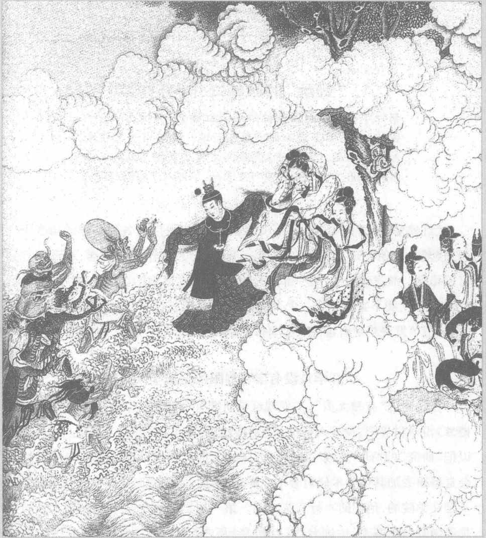
贾宝玉神游太虚境