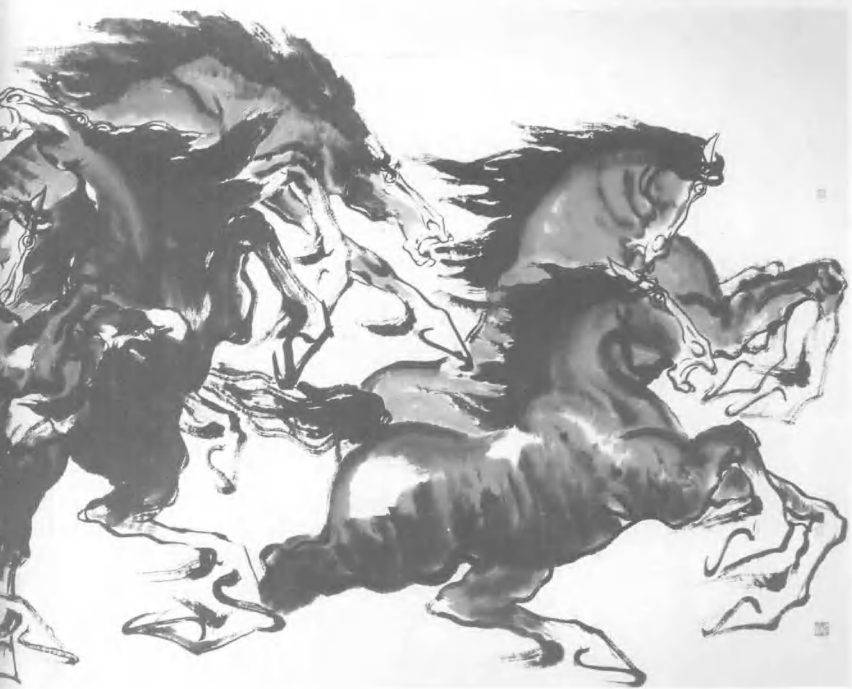
马到成功/362 cm x 145 cm