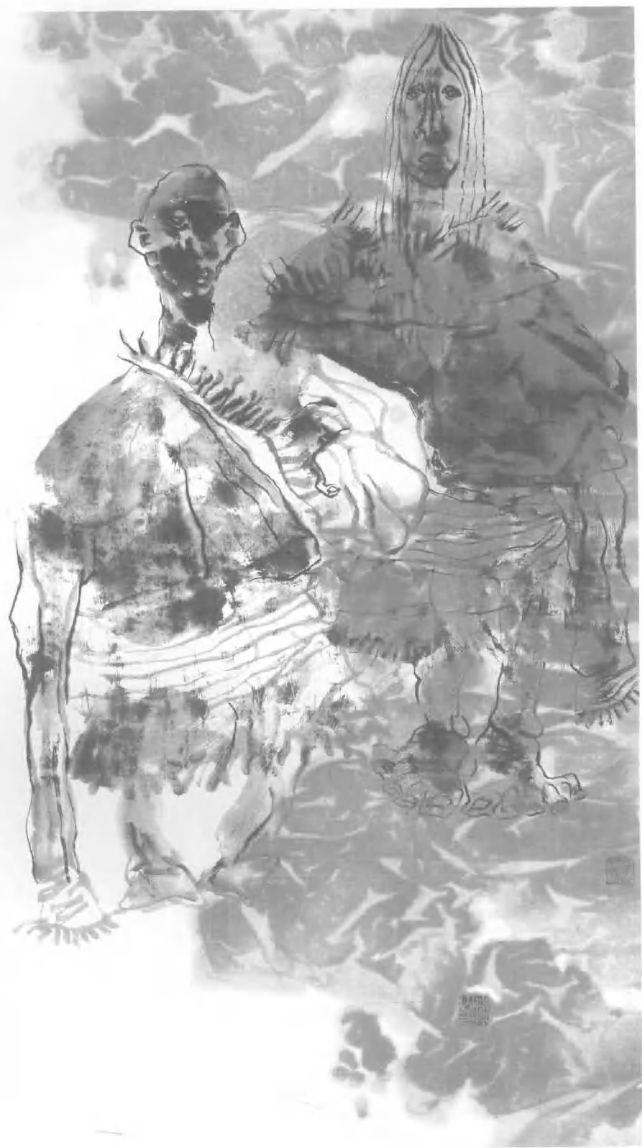
西藏组画/66 cm x 110 cm