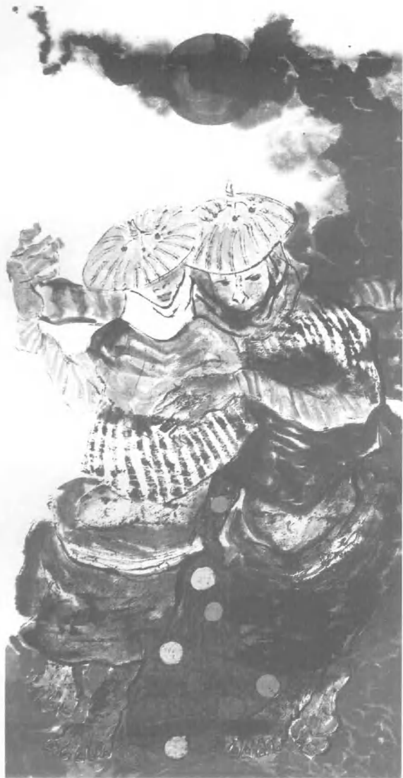
惠安女组图/66 cm x 128 cm