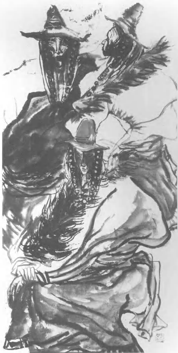
西藏组画/66 cm x 132 cm