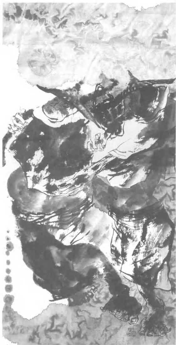
惠安女组图/66 cm x 128 cm