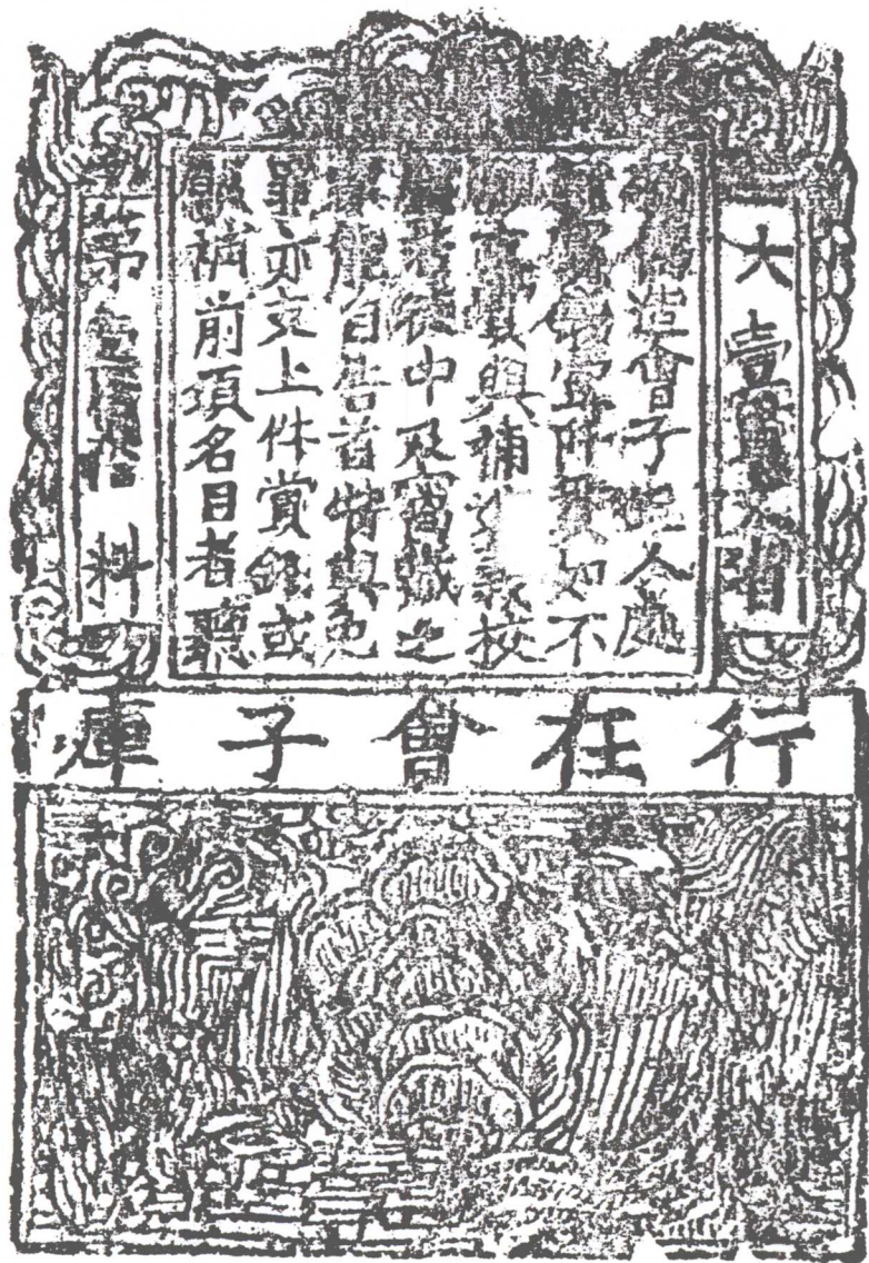
南宋行在會子庫版拓本 中国历史博物馆收藏