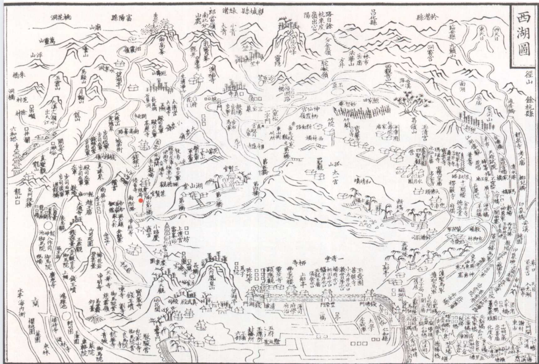
《咸淳临安志》西湖地图及其标识的会子纸局

行在杭州开业。次年，浙江兴业银行发行“当十铜元”的纸币，票面图案为“平湖秋月”。接着，同成立的官商合办浙江官钱局，亦名浙江官银号，于宣统元年（1909）也改名浙江银行，发行的5元纸币，正面左右图案分别为银行大楼和杭州城门——涌金门。