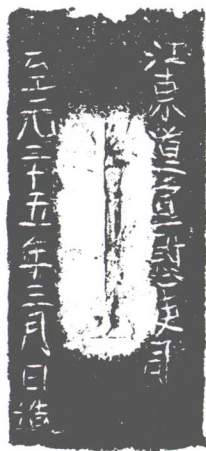
昏烂钞印（见《中国古钞图辑》）