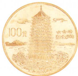
中国传统文化第(1)组金银纪念币——六合塔