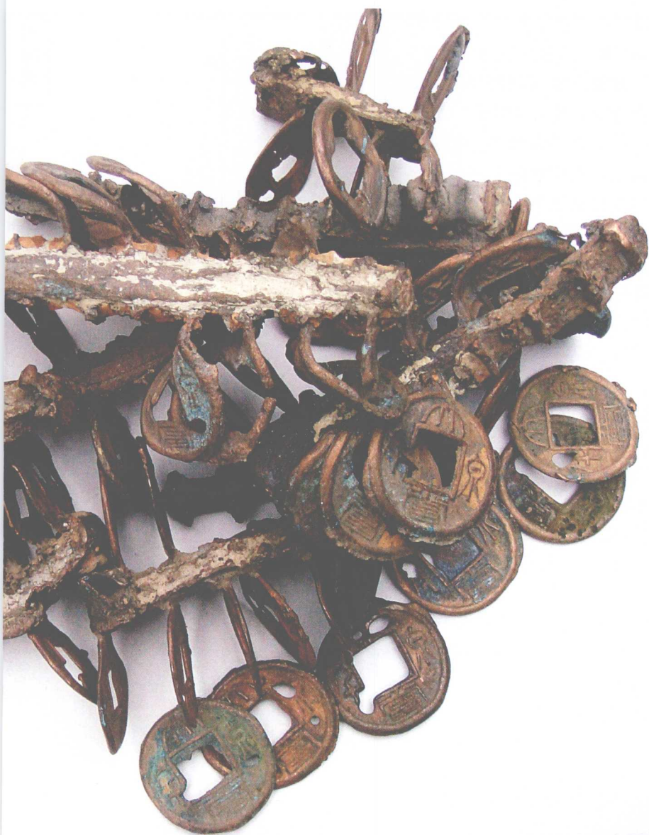
西湖出水的大泉五百、大泉当千钱树