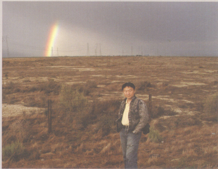
彩虹——艺术家在原野上 Rainbow