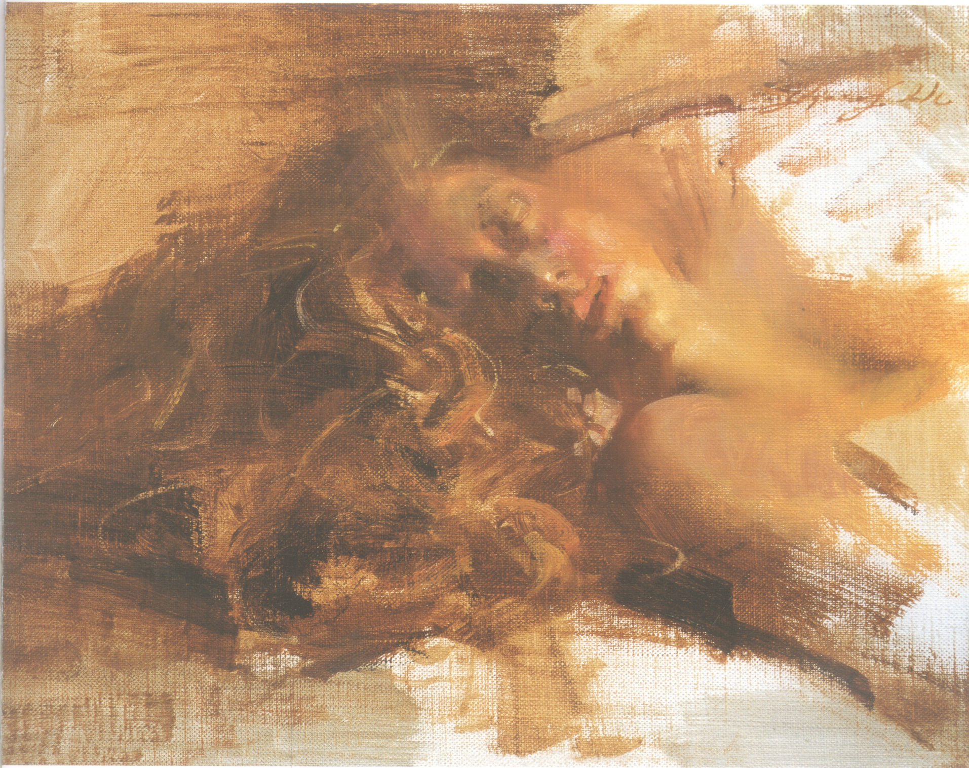
84. 爱珍 Adrian 40.64cm×30.48cm 16 " ×12 " 2006年 扉页: 皇冠 Crown 30.48cm×30.48cm 12 " ×12 " 2007年