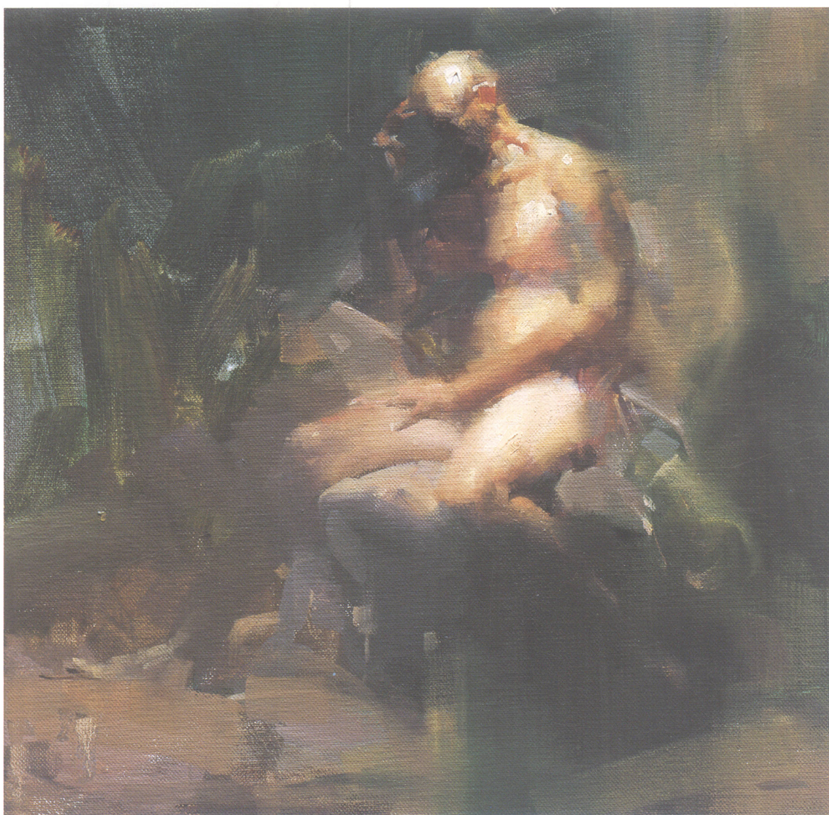
7. 思想者 Hinker 30.48cm×30.48cm 12 " × 12 " 2006年