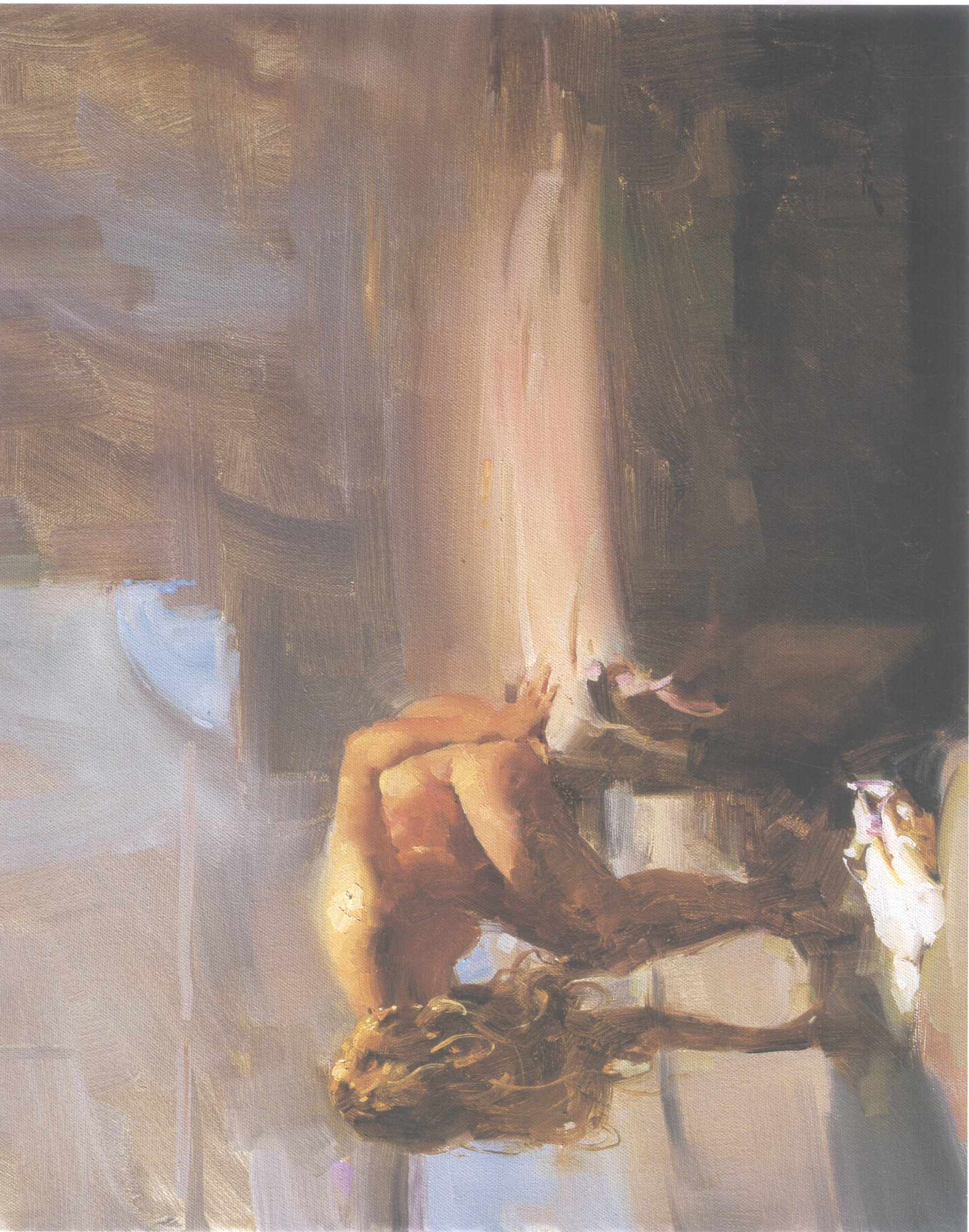
15. 拾起睡袍 Picking Up the Robe 40.64cm×50.8cm 16"×20" 2007年