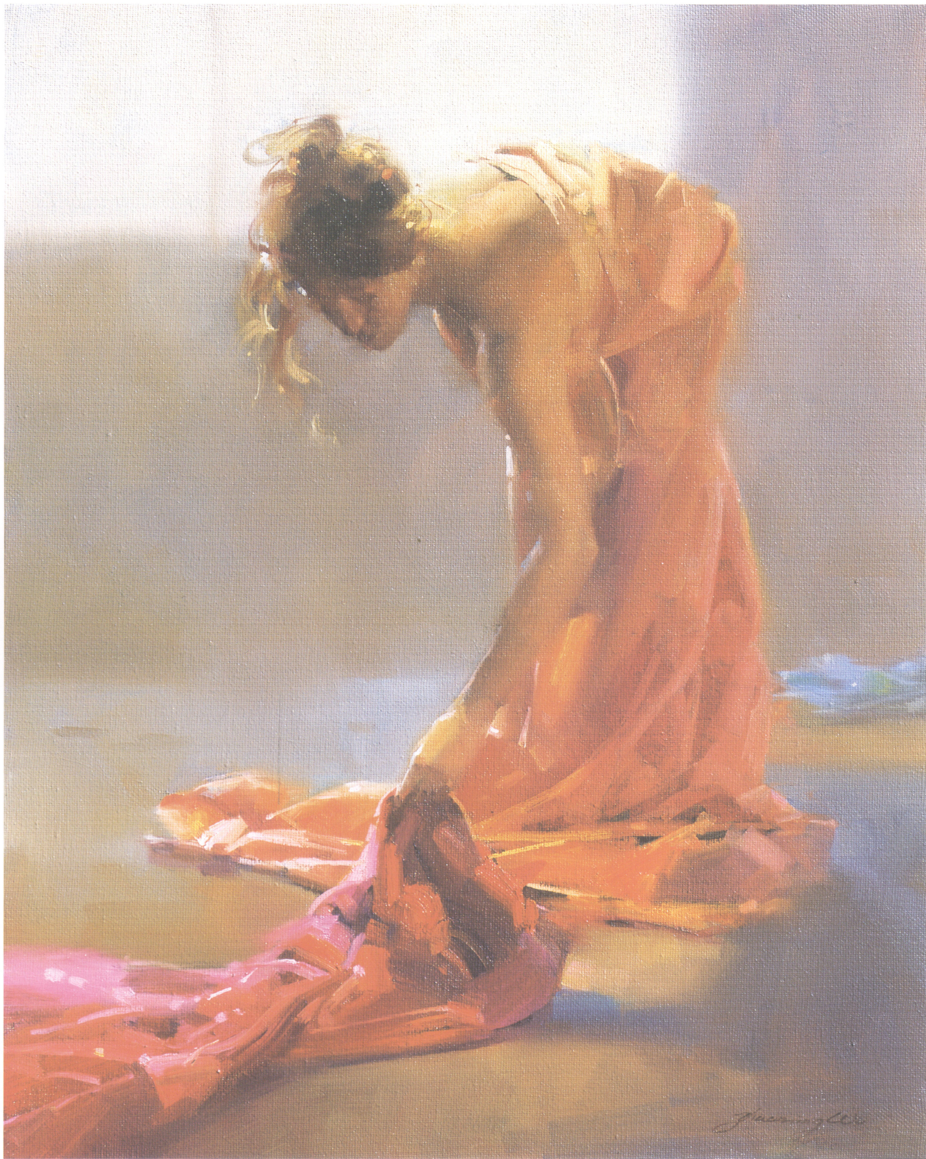
1. 红袍 Red Robe 50.8cm×40.64cm 20 " × 16 " 2007年