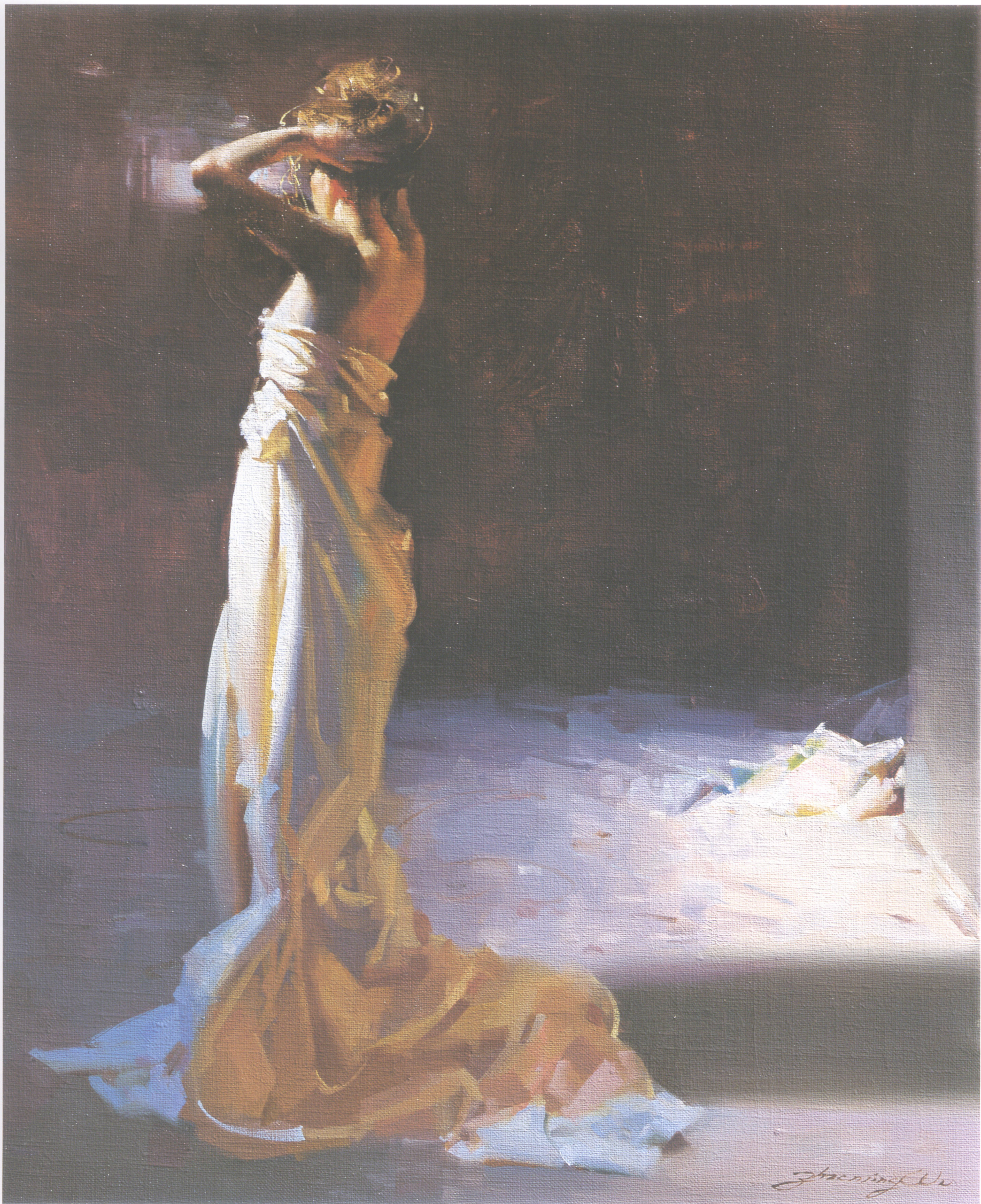
2. 蝴蝶夫人 Madam Butterfly 50.8cm×40.64cm 20"×16" 2007年