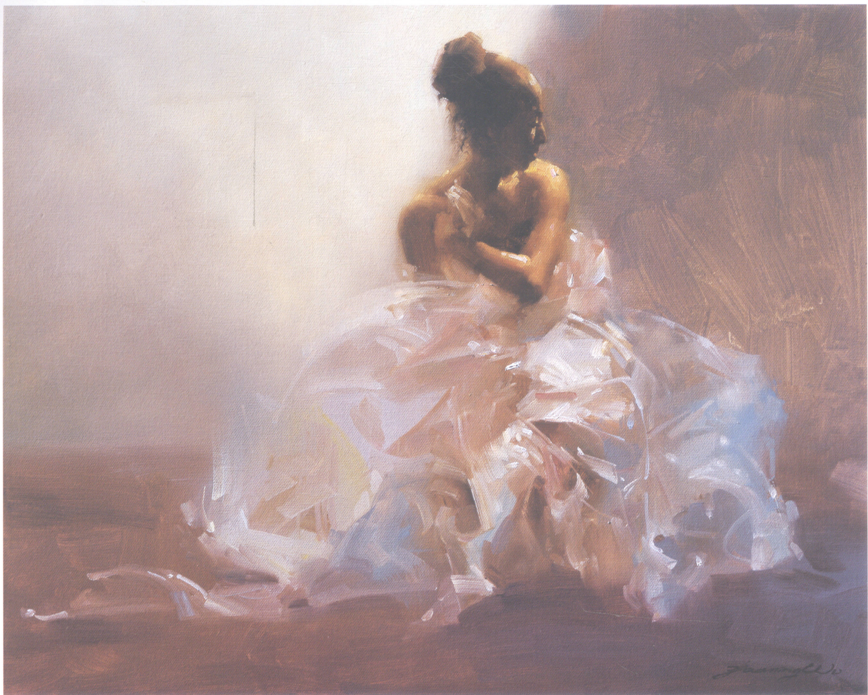
4. 透明的人体 Girl with Transparent 40.64cm×50.8cm 16"×20" 2007年