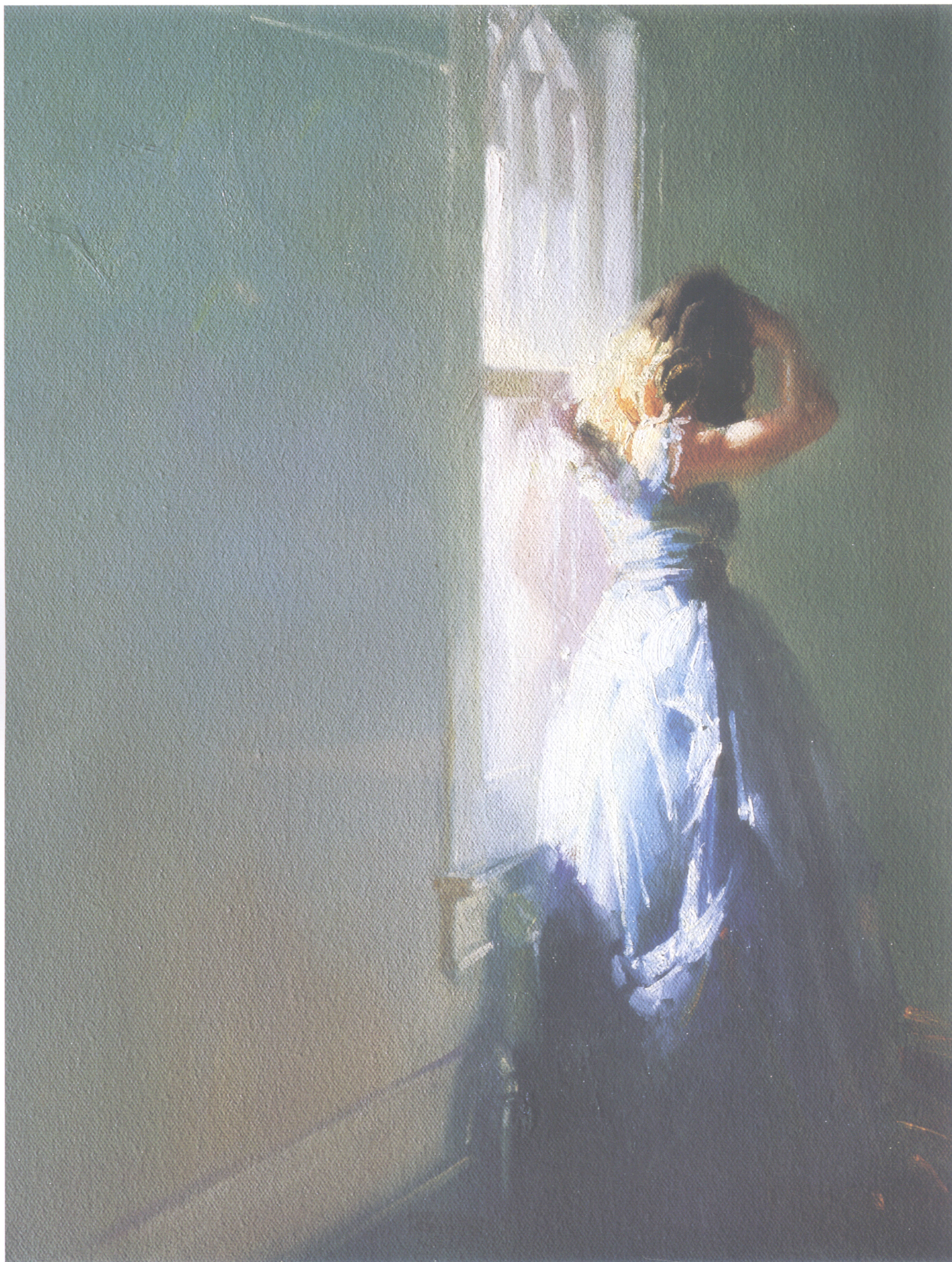
11. 简 Jen 40.64cm×30.48cm 16"×12" 2006年