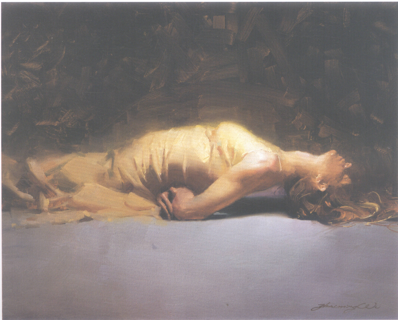
3. 拱 Arch 40.64cm×50.8cm 16"×20" 2007年