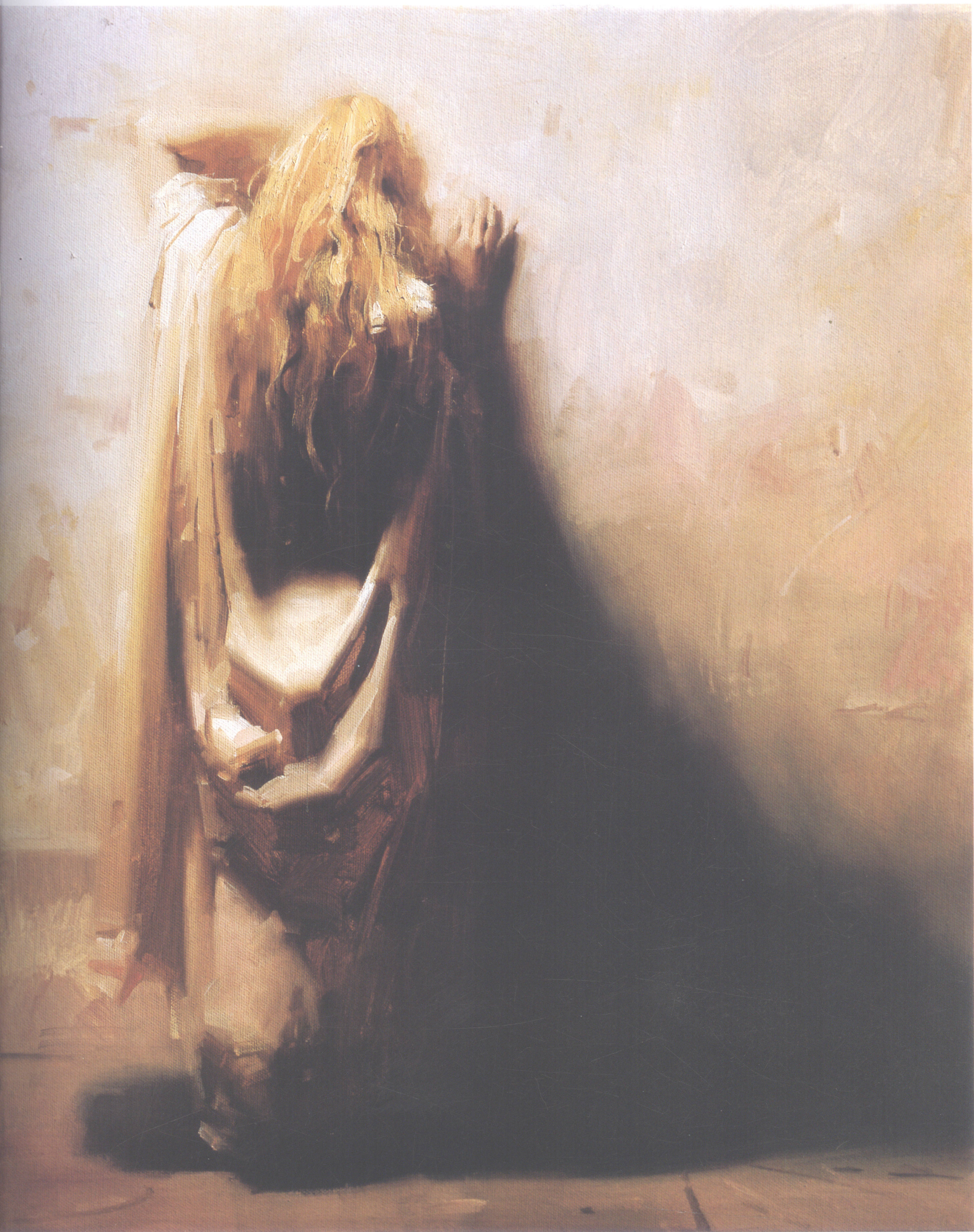
14. 耳语 Whisper 50.8cm×40.64cm 20"×16" 2006年