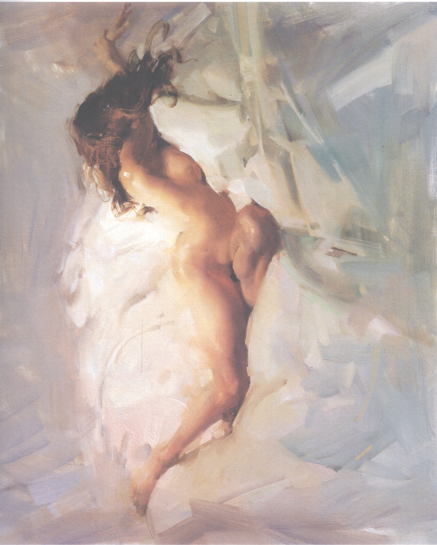
10. 云妮 Reena 55.88cm×71.12cm 22"×28" 2006年