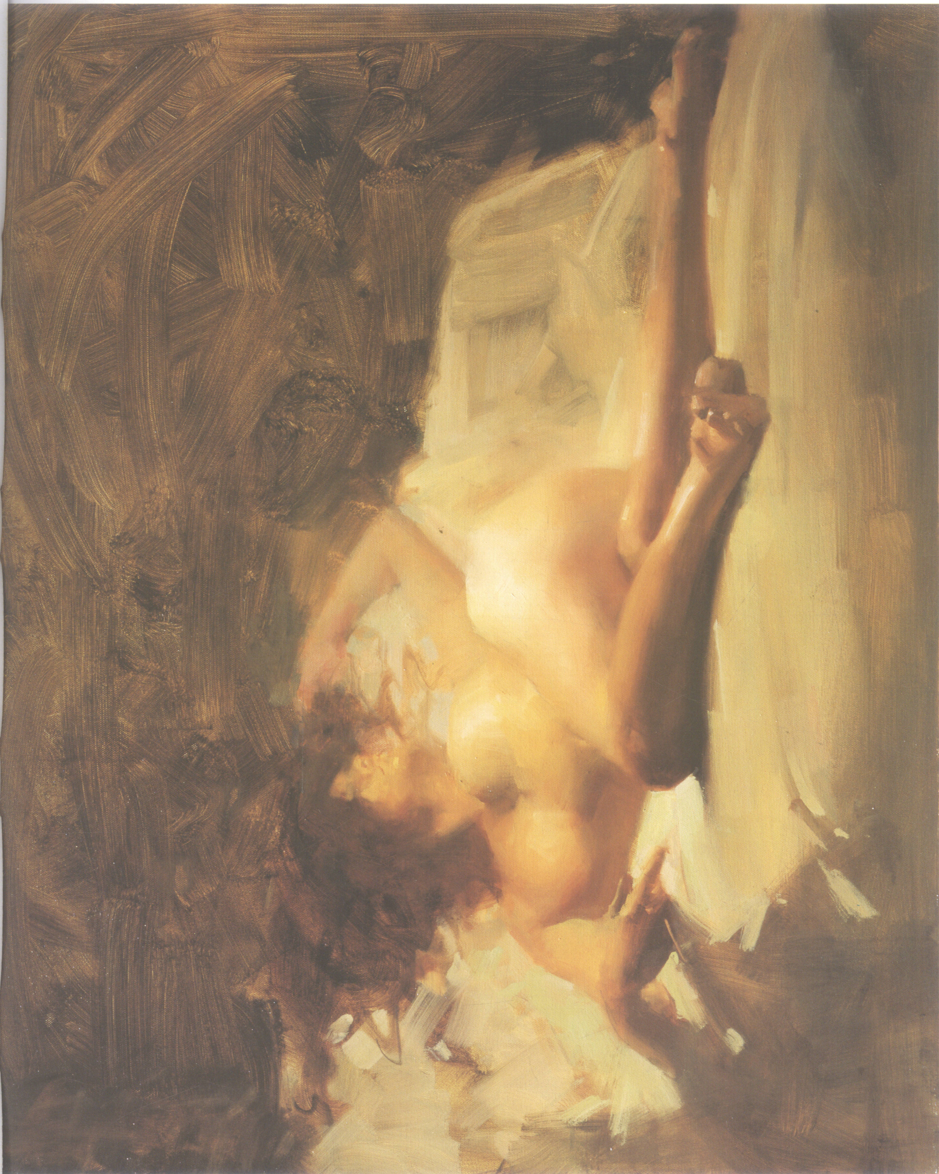
16. 宁静中的燃烧 Flaming Silence 60.96cm×76.2cm 24"×30" 2006年