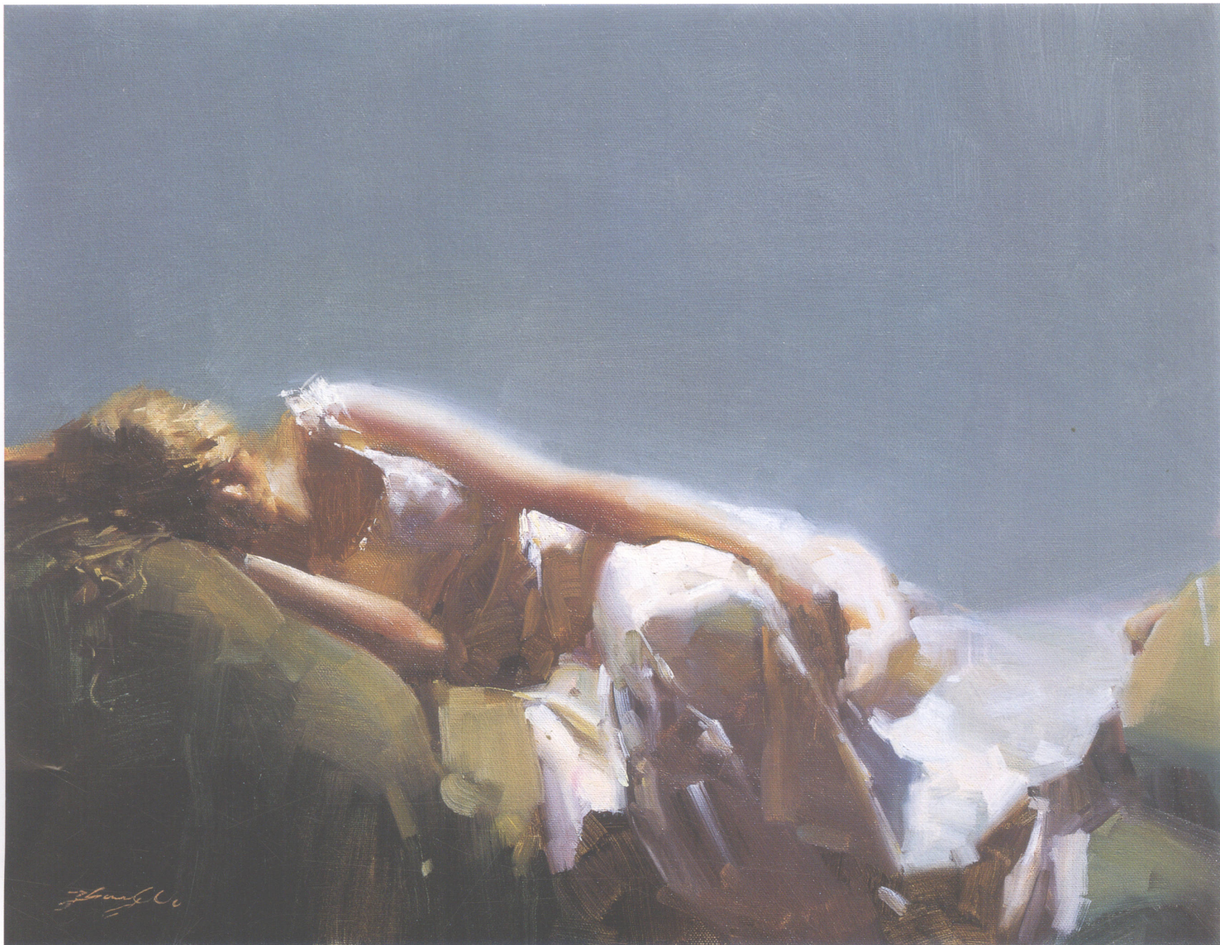
6. 慰 Comfort 40.64cm×50.8cm 16 " × 20 " 2006年