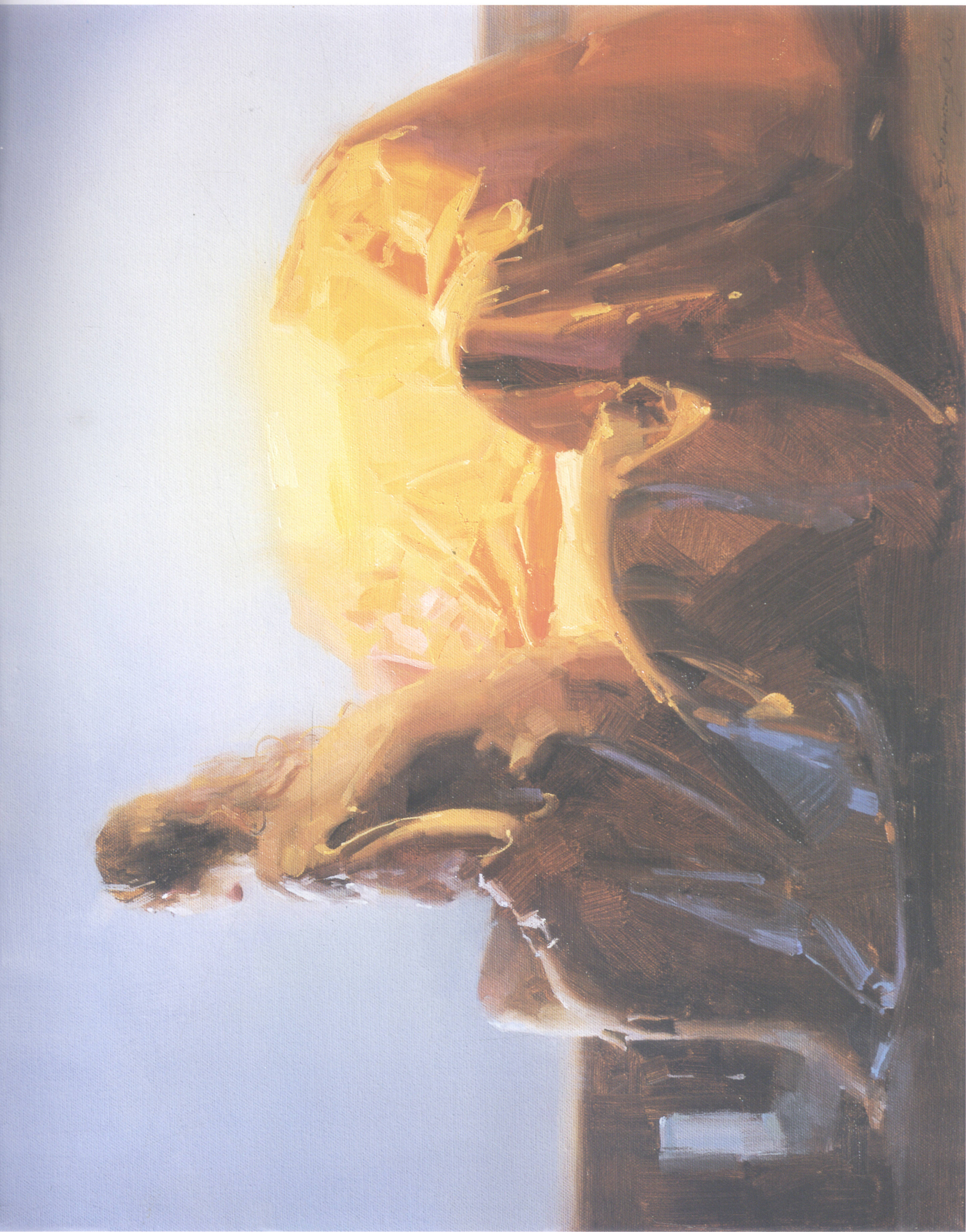
8. 椅 Chair 40.64cm×50.8cm 16"×20" 2007年