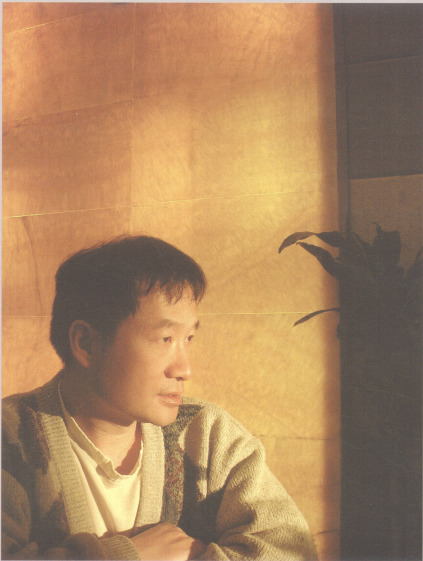
艺术家吴兆铭 Artist Zhaoming Wu