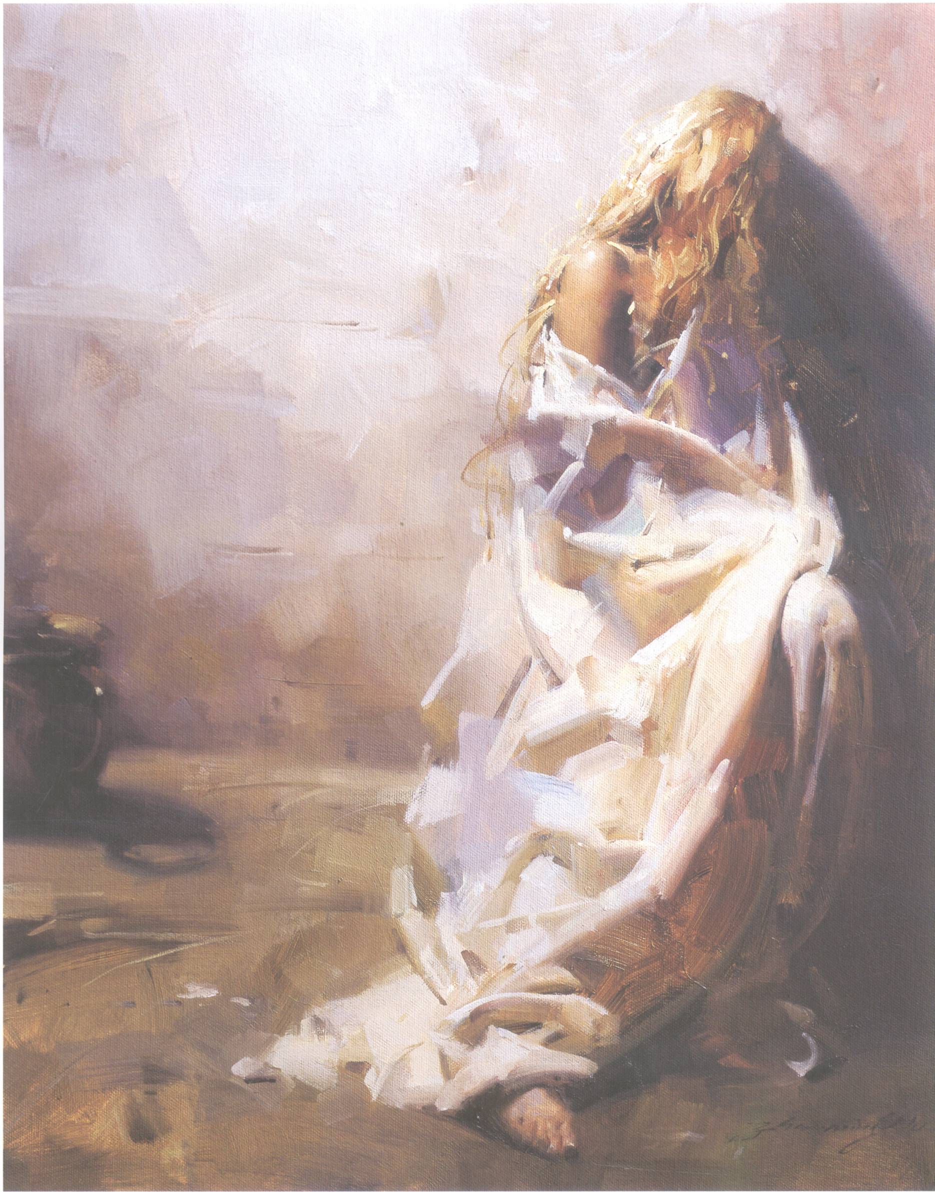
13. 裹布的人体 Figure in Drapery 50.8cm×40.64cm 20 " × 16 " 2007年