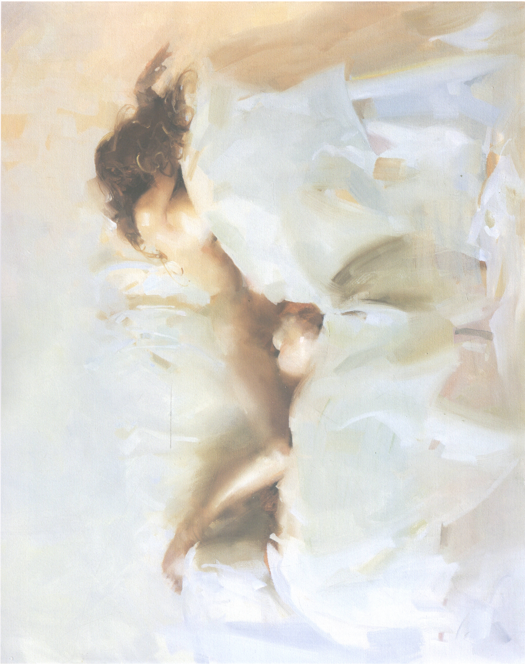
9. 静态的动势 Dynamic Movement 50.8cm×40.64cm 20"×16" 2006年