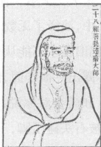
禅宗始祖达摩大师

铃木大拙认为,禅,就是“超越人类理解限域之外”的心灵训练,“它的独一无二在于它的非理性或非人类逻辑理解所到之处”。作为一个西方学者,他的看法未免显得笼统而抽象。对于西方人来说,禅或是“方形的”(艾柯语),或是垮掉派的口号,他们在哲学意义上讨论这个问题,而且使用着西方哲学常用的理路,却无从理解中国僧人清瘦孤独的