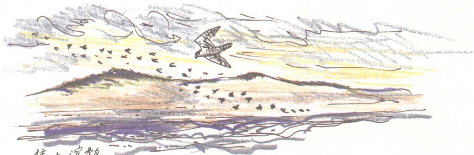
隼 + 滨鹬 莫诺莫伊岛，刮风的九月天