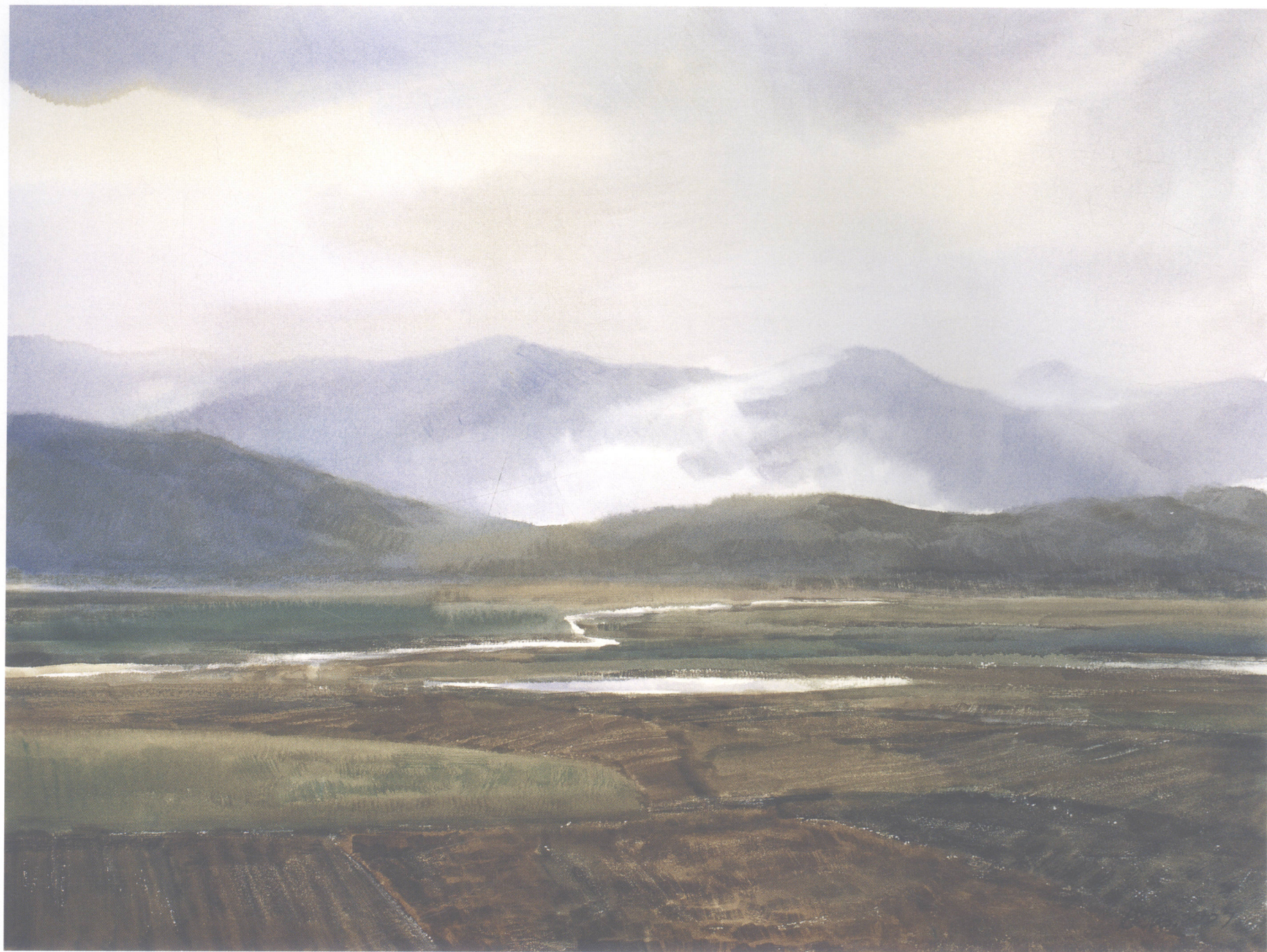
晨雾 57cm × 75cm