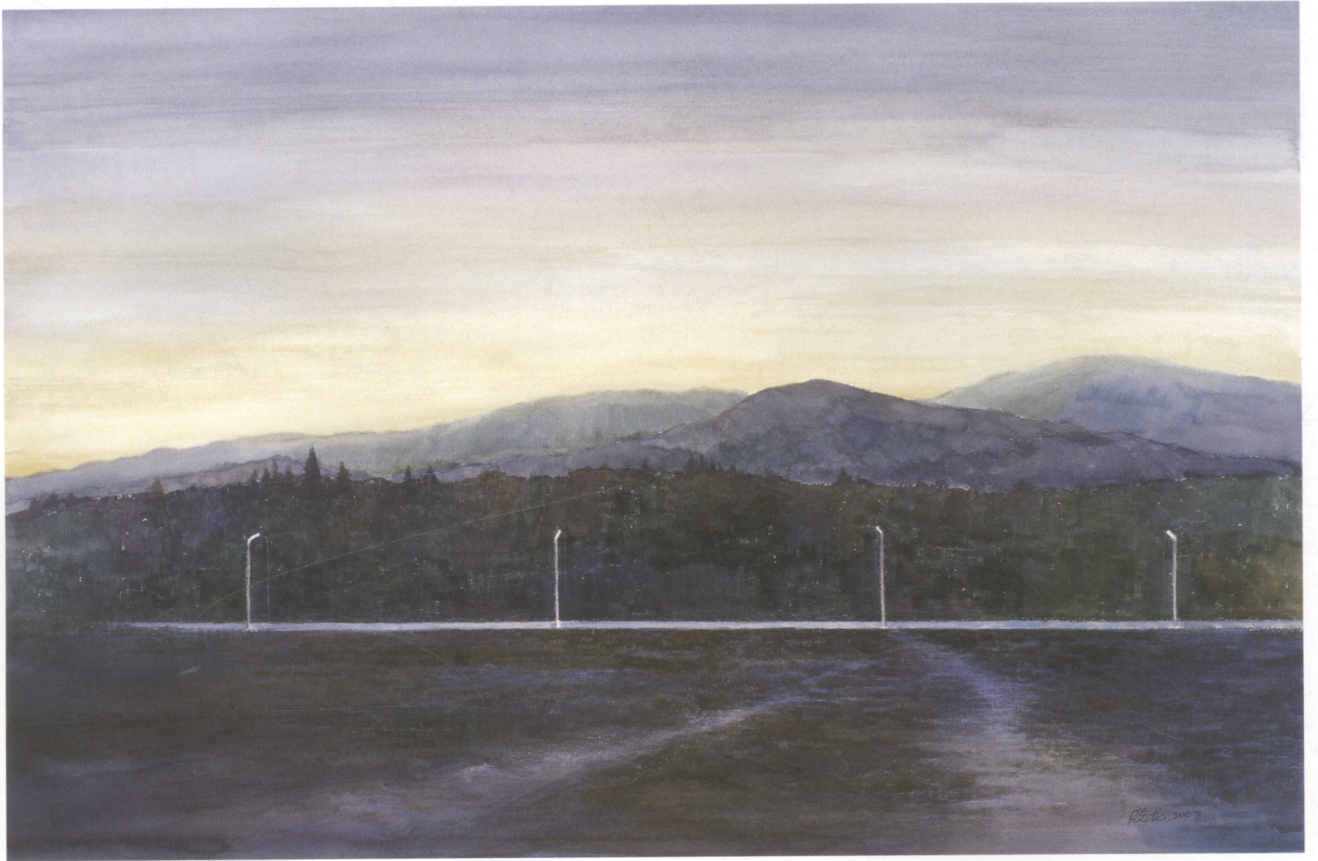
通途 66cm × 101cm