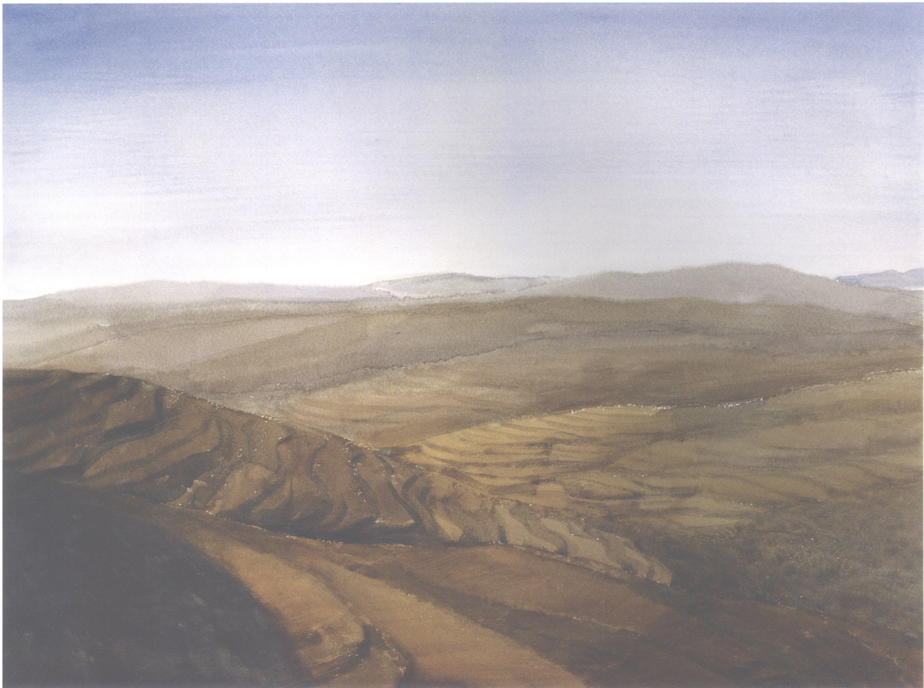
黄土地 57cm × 75cm