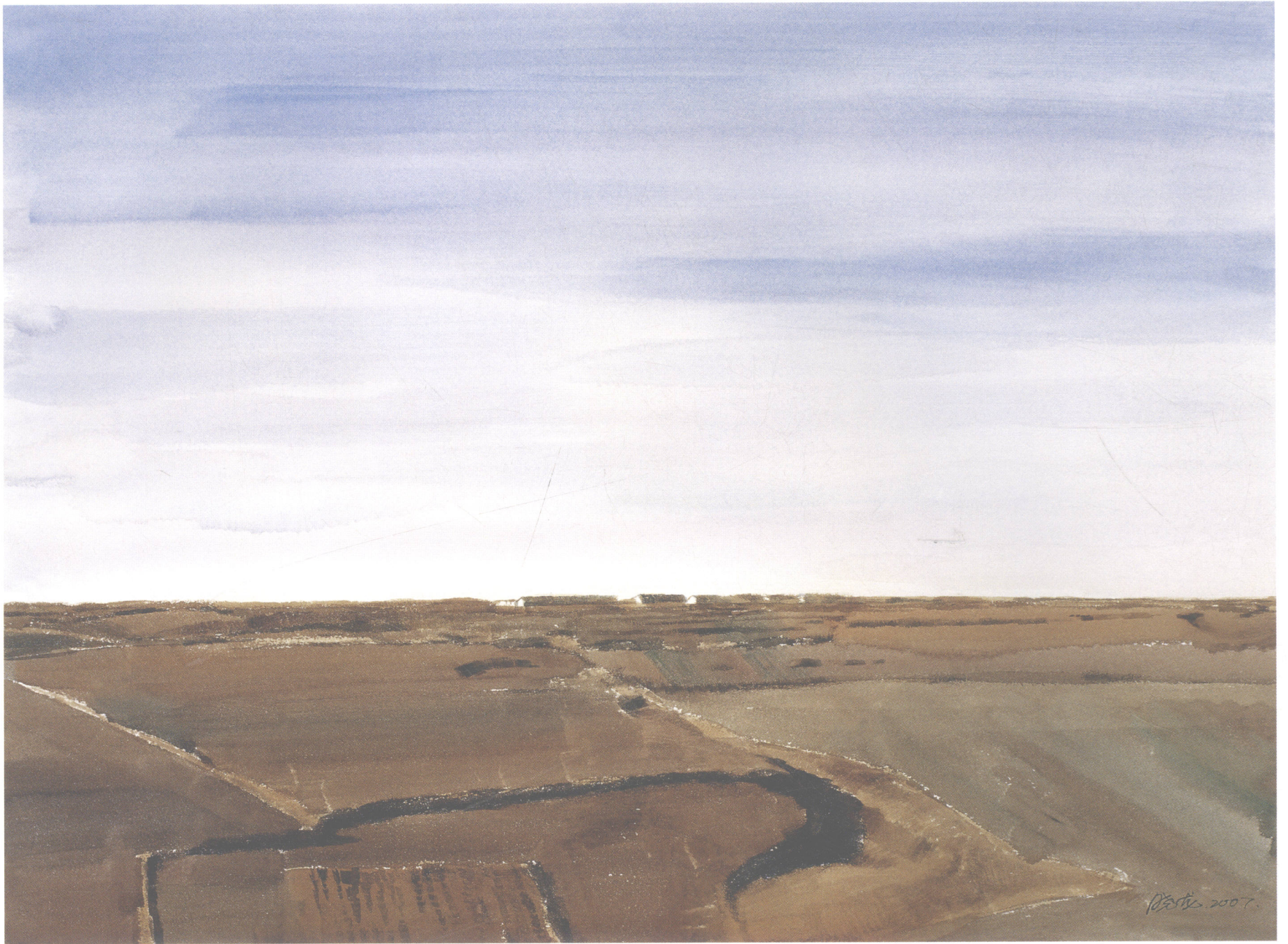
郊外 57cm x 75cm