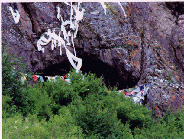
泽当镇附近山 上的猴子洞

很早很早以前，观世音菩萨派出一位有神通的猕猴，到西藏修行。猕猴来到一个岩洞里，潜心修习菩提慈悲心。就在他对佛法有了一定领悟的时候，一个住在邻近地方、由度母化身的罗刹女来到他面前，用非常爱慕的口气说：“让我们结成夫妻吧！”猕猴说：“我是观世音菩萨的居士，要是当了你的丈夫，就破了我的戒行。”罗刹女苦苦哀求，涕泪横流，猕猴总不答应。无可奈何之下，她发誓：“你不答应，我就死在你面前！”