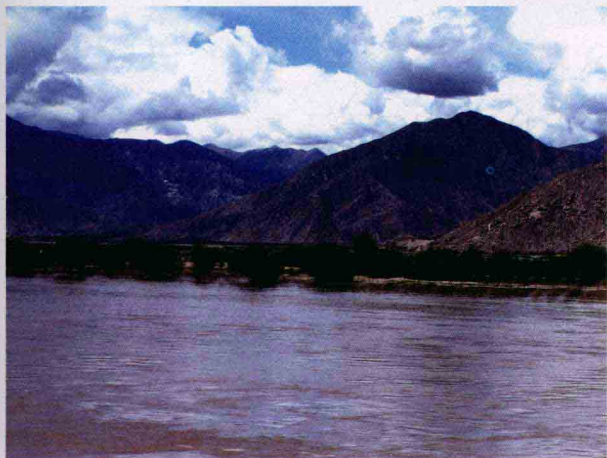
雅鲁藏布江沿江绿化带

北宽329公里，总面积7.97万平方公里(含“麦克马洪线”以南面积约2.86万平方公里)，约占西藏自治区总面积的1/15，人口1231.8万人。