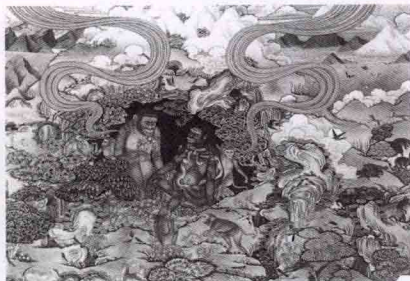
猕猴与罗刹女结合繁衍出藏族