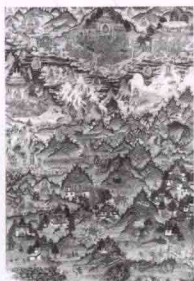
猕猴与罗刹女生下 6只小猴

猕猴被缠得没办法，只有跑到普陀山，请示观世音菩萨。观音菩萨允许他们结婚，猕猴就与罗刹女结为夫妻，生下了六个猴崽，随后小猴崽繁衍，分成四部，即赛、穆、顿、董四个氏族，从此发展成为雪域