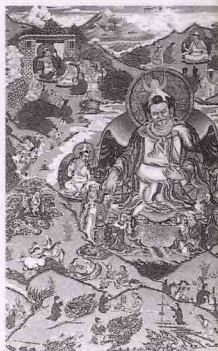
首位藏王聂赤赞普

元朝时西藏正式归入祖国版图,设立管理全国佛教和藏区事务的宣政院,由出自萨迦派的帝师“领宣